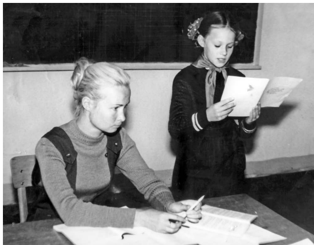
Настаўніца. 1973 г.