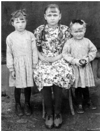
Алёшавы дзяўчаты. 1950 г.

(былі апрануты ў нямецкую форму). Калі ворагі іх выкрылі, то знайшлі ў кішэні лясіцкі адрас. Алёшу тут жа пасадзілі ў слцкую турму. Тады яго жонка Гэля з братавай пайшла ў горад, пазычыла ў заможнага случака залаты грош ды выкупіла мужа ў ахоўнікаў. Гэта адбылося ў чацвер, а на наступным тыдні, у аўторак, турма была вычышчана ад насельнікаў: усіх да аднаго