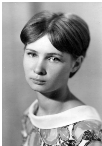
Студэнтка. 1968 г.