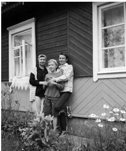
Дача на Лысай гары. 2003 г.

адмовілася, паводзіла сябе, як дзікая, а калі зразумела, што ўцячы не зможа, то сінія вочы яе палыхнулі небяспечным чырвоным агнём. Як у фільме жахаў, далібог! Гэта быў выразны знак: нешта адбылося, чаго мы не можам ведаць, кошка з намі жыць болей не хоча.