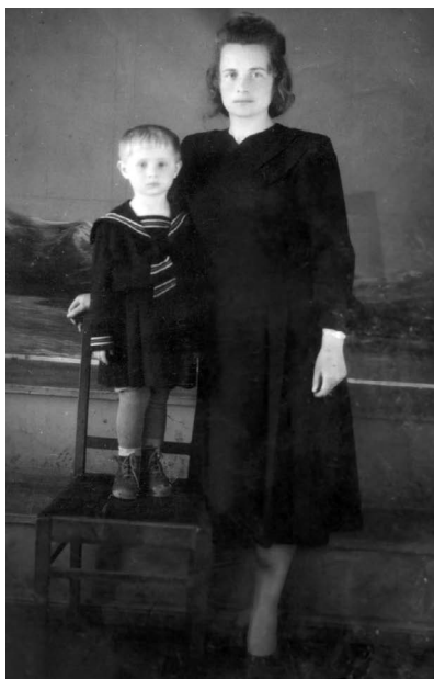
3 маці. 1953 г.

Шэсць гадоў мне, вялікая, а бацькоў бачу рэдка — у Капыльскім раёне яны працуюць аграномамі, пачалі там будавацца. Верасень, мае сяброўкі збіраюцца ў школу, і я за імі следам: таксама хачу вучыцца. Настаўніца, здаецца, і выгляду не падала, што я там «незаконна». Аловак мне дала, сшытак, палачкі паказвала... Дні два гэтак «гуляла» я