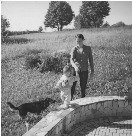
Тут добра ўсім

Дык злаўлю ці не злаўлю Гэта дробнае стварэнне? Бо канчаецца цярпенне І затрымкі не люблю.