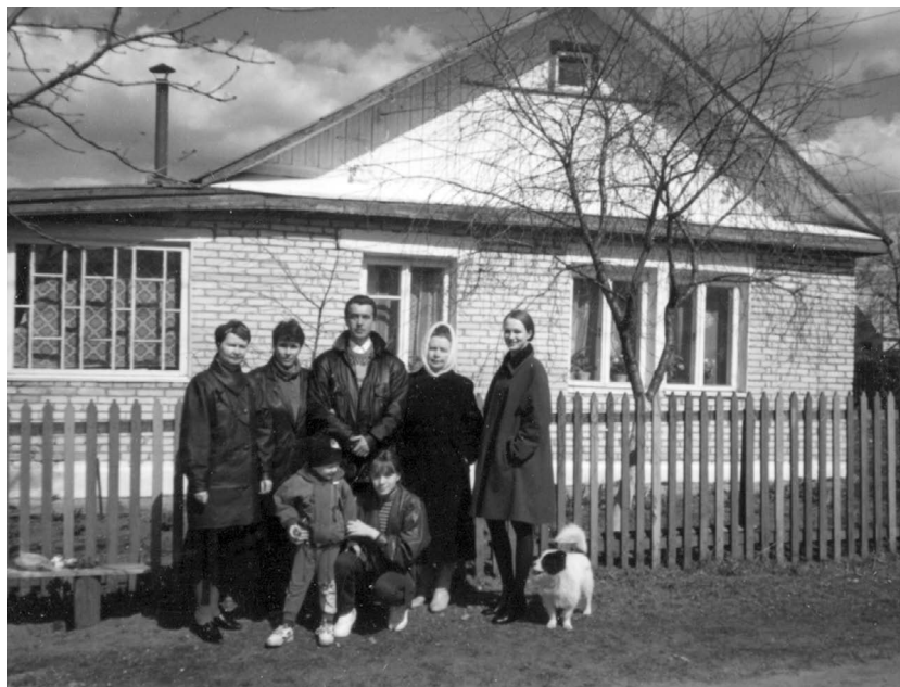
Бацькоўская хата ў Плешчаніцах. 1998 г.

З вядомых мне прадстаўнікоў кацінага роду Цімоша, напэўна, самы славуты. Не ў тым сэнсе славуты, што слава пра яго пайшла далёка, — не. Проста ён меў адну рэдкую для катоў асаблівасць: любіў агуркі. І не проста еў іх, калі голад, скажам, прыцісне, а лічыў за найлепшы ласунак. Дзеля эксперыменту мы яму прапаноўвалі на выбар кавалачак кілбасы і скрылёк маладога гурочка, і наш Цімоша, не раздумваючы, выбіраў апошняе. Ды так апетытна, смачна хрумстаў, што ўсе хатнія ад душы пацяшаліся.