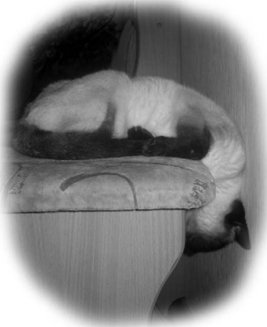
Люська з патомства Клары

З гігіенай сіямки мы ніякіх клопатаў не мелі. Акуратная была на дзіва! Нас навучылі купіць дзве місачкі для фотаработ: адна ў другую ўстаўляецца,