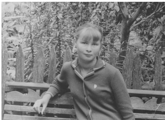
Школьніца. Сярэдзіна 1970-х гг.

Мае гады, мае таварышы, Мае настаўнікі харошыя... Набытак ваш бяссоннем важу я, А ранкам клічу з падарожжа.