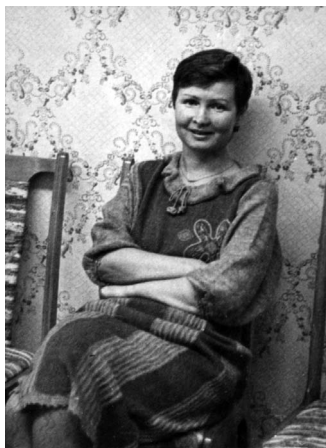
Журналістка. 1991 г.