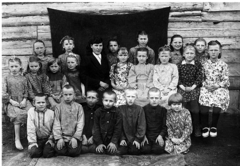
Вучні Лясіцкай школы з настаўніцай. 1948 г.