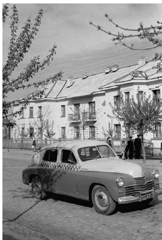
Вул. Пралетарская. 1953 г.

Адно, што на той час было добра, — клопат пра інвалідаў вайны. Іх улада «глядзела добра»: ад саюзнікаў перападаў так званы рацыён з кансервамі, у спецкраме ў Навадворцах выдавалі дыетычнае мяса (індычыну, трусцяціну), па талонах выдавалі муку. А ў краме маглі адмераць не 5, а 10 метраў тканіны, хоць чарга і хвалявалася.