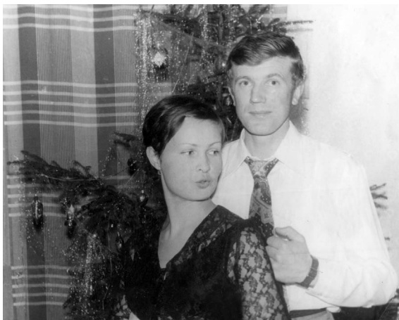
Апошні год у вайсковым гарадку. 1980 г.

непрыемнасці. Ён выслухае вас і не задасць лішніх пытанняў. І адно правуркоча на вуха, што ён усё разумее, што яму добра жывецца ў вашым доме і што ён за тое ўдзячны.