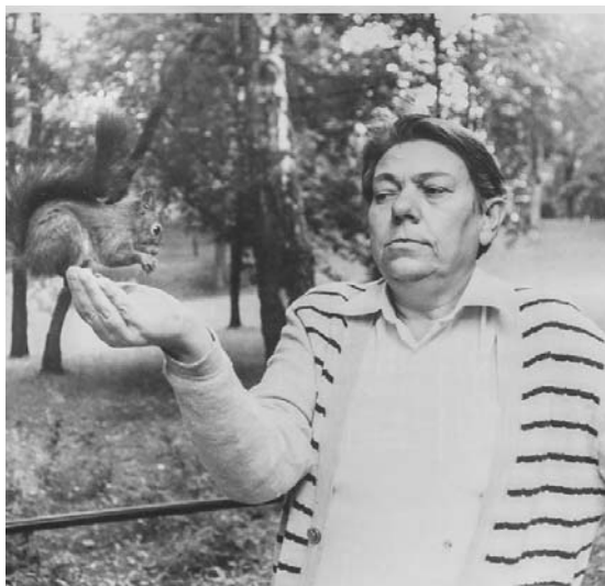
«Любіў гуляць у парку і частаваць вавёрак».

Толькі што пазваніў табе, а прыйшоў дамоў і выявіў, што канверт надпісаны,