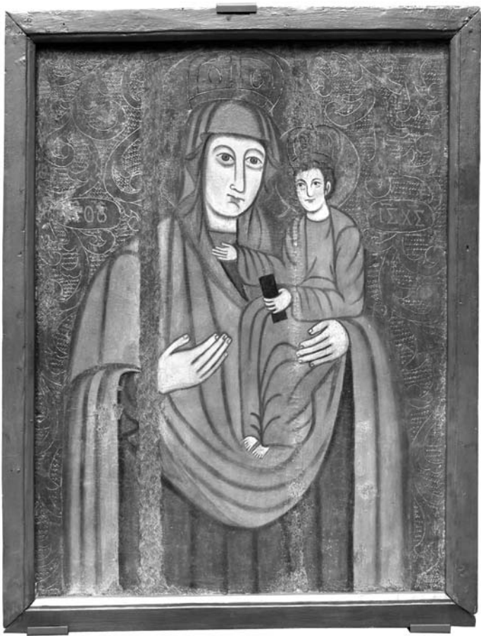
Икона Божьей Матери с Младенцем. Пинск, Кладбищенская церковь. XVIII век.