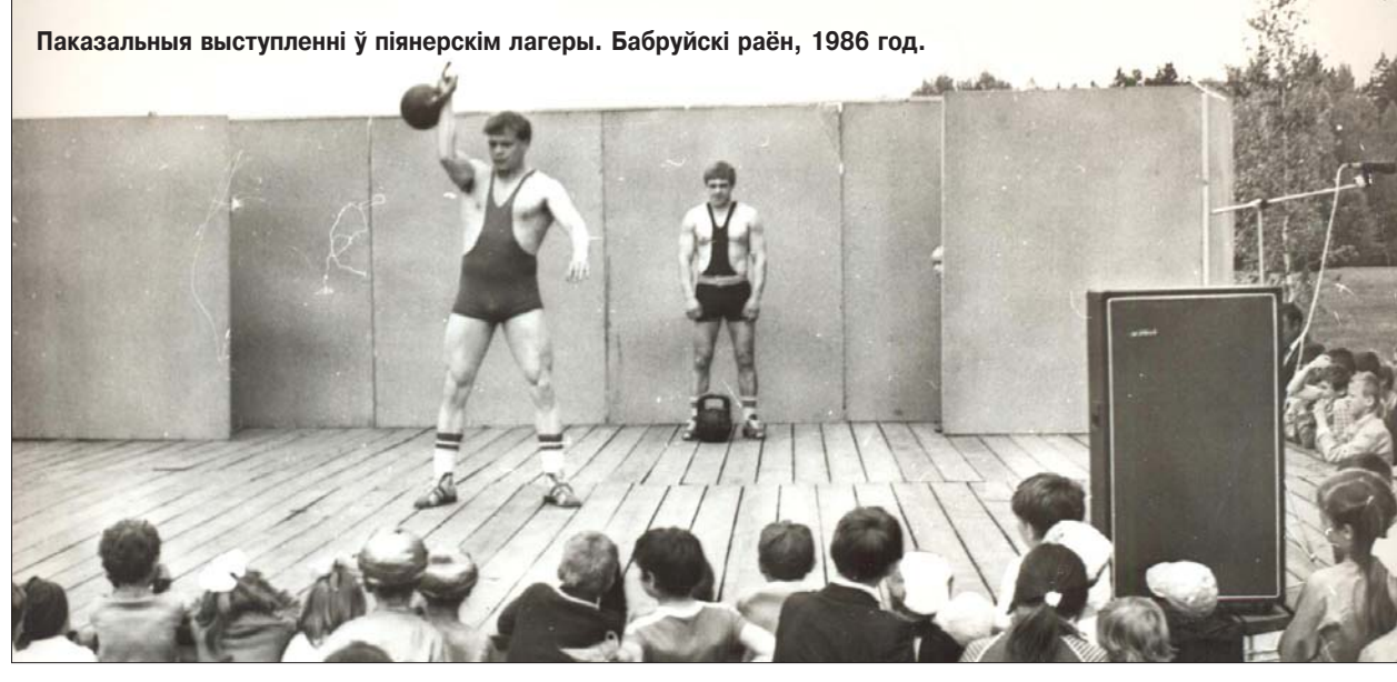
Паказальны выступленні ў піянерскім лагеры. Бабруйскі раён, 1986 год.