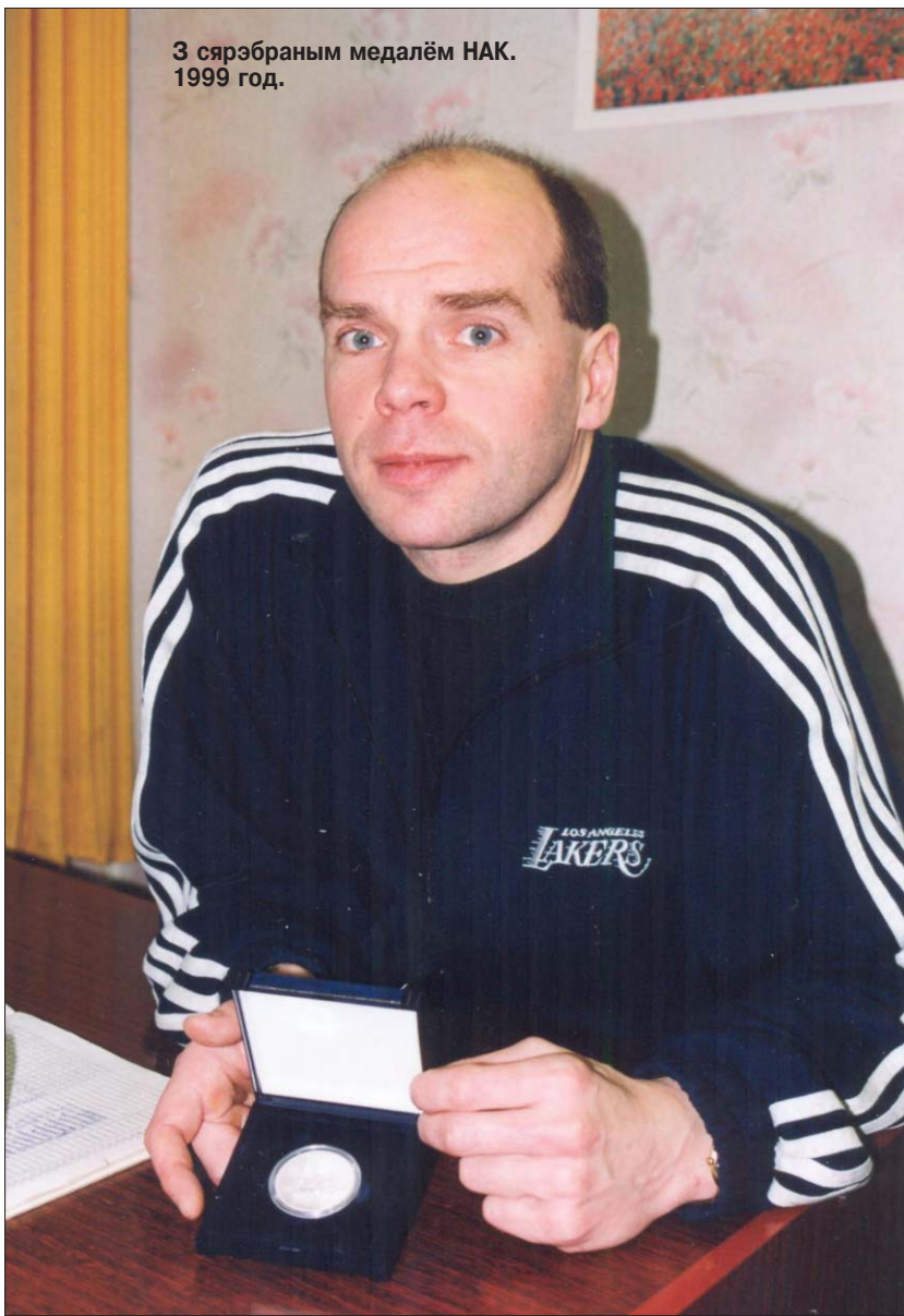
3 сярэбраным медалём НАК. 1999 год.

кай абыходзіліся! Так жанчыну з загса на руках не выносаць... Калі без жартаў, праца была складаная, цяжкая. Атрымліваў, праўда, нядрэна — 140 рублёў. Ад бацькоў не залежаў. Працаваў, вучыўся і яшчэ паспяваў трэнераванца. З веласпорту сышоў, падышоў у цяжкую атлетыку. Вайскоўцу сіла патрэбна, разважаў я тады.