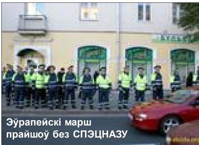
Эўрапейскі марш прайшоў без СПЭЦНАЗУ