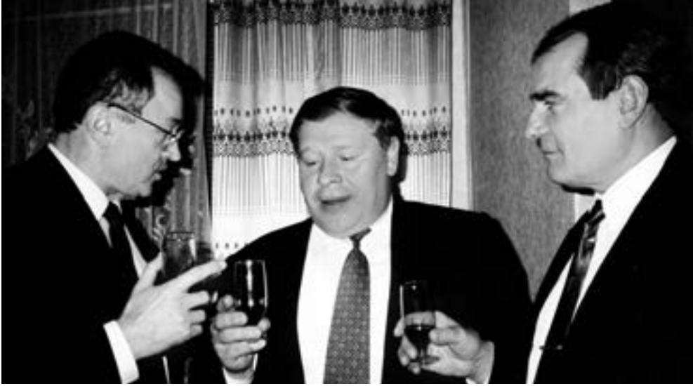
Размова «на траіх»