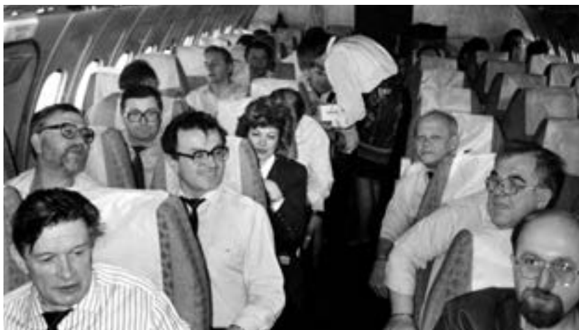
Have a good flight

I remember well, my first trip in my new role was to two countries at the same time. These pictures are a memento of that business trip. It was to the Netherlands at first, and negotiations in Germany second.