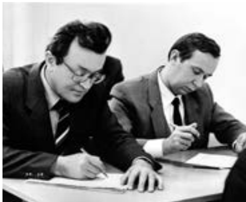
A student again

Eventually, it became a select club only for our "circle" where I mastered English quite well in three years.