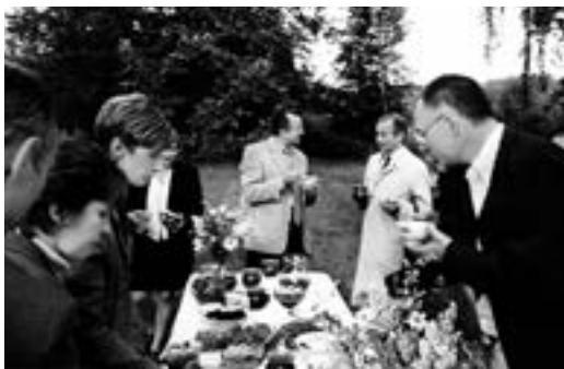
На свежым паветры

Замежным дыпламатам было цікава пабываць у доме, дзе нарадзіўся Марк Шагал, і ў сядзібе вядомага мастака Іліі Рэпіна, паглядзець на чашу амфітэатра, дзе праводзіцца «Славянскі базар». Была, канешне, і нефармальная частка, з якой і захавалася гэтае фота.