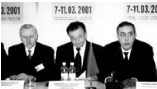
Официальное открытие выставки

Главное — ощущение свободы. У иностранцев на лицах — улыбки, в магазинах — чего только нет. В