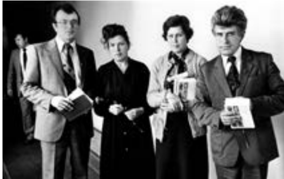
Віншум з Днём настаўніка

У 1984 годзе я стаў намеснікам старшыні Мінскага гарвыканкама (слова «мэр» тады не ўжывалі) і адразу атрымаў даручэнне заняцца будаўніцтвам Мінскага метро. Першая ветка сталічнага метрапалітэна была пабудавана пры мне. А за станцыю «Усход» нават атрымаў прэмію Савета Міністраў СССР.