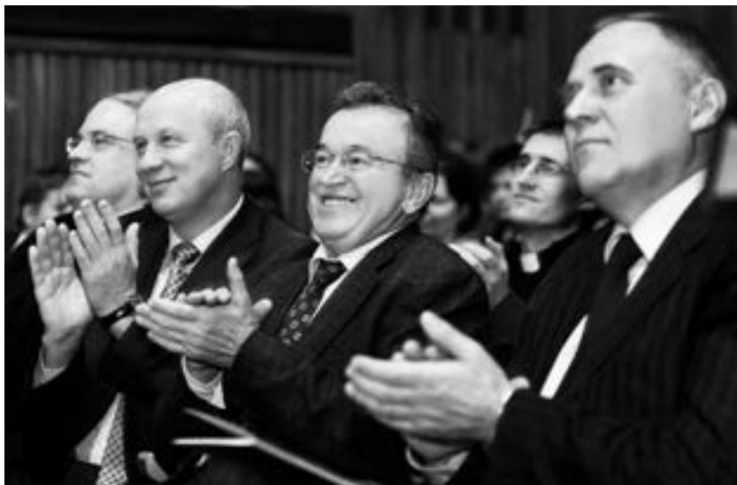
Together with former presidential candidates Alexander Kazulin and Mikola Statkevich ( on the right )

I did not return to active political work after the recovery. However, I accepted some invitations to various events held by the opposition forces. For instance, in January 2009, I took part in the founding meeting of the Belarusian Christian Democracy party as a special guest.