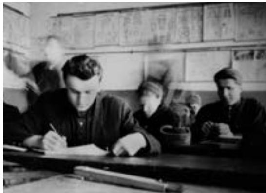
A serious student

The training was really good. Our school cooperated with various construction companies, where students could do internships and find their first jobs. For the most part, it was the railway car repair shop.