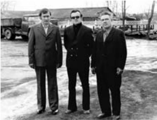
First pictures from work

Initially hired as a foreman, I became an Area Supervisor in a year's time.