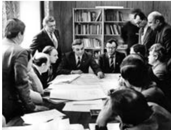
One of many staff conferences