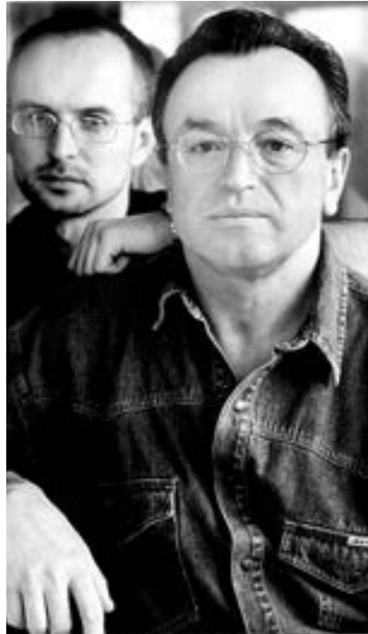
З сынам Ігарам

Вяртаючыся да асабістага жыцця Марыніча, я яшчэ раз хачу падкрэсліць, што не жадаю тут бачыць нейкіх «падзелаў». Усе ў роўнай ступені самыя блізкія герою гэтай кнігі людзі, з усімі ён быў шчаслівы.