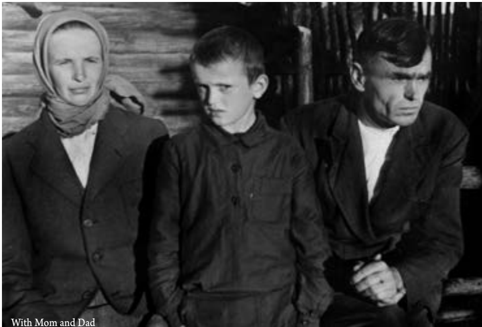
With Mom and Dad

The Rakitskis, our neighbors, were visited by a relative from Leningrad who took the picture.