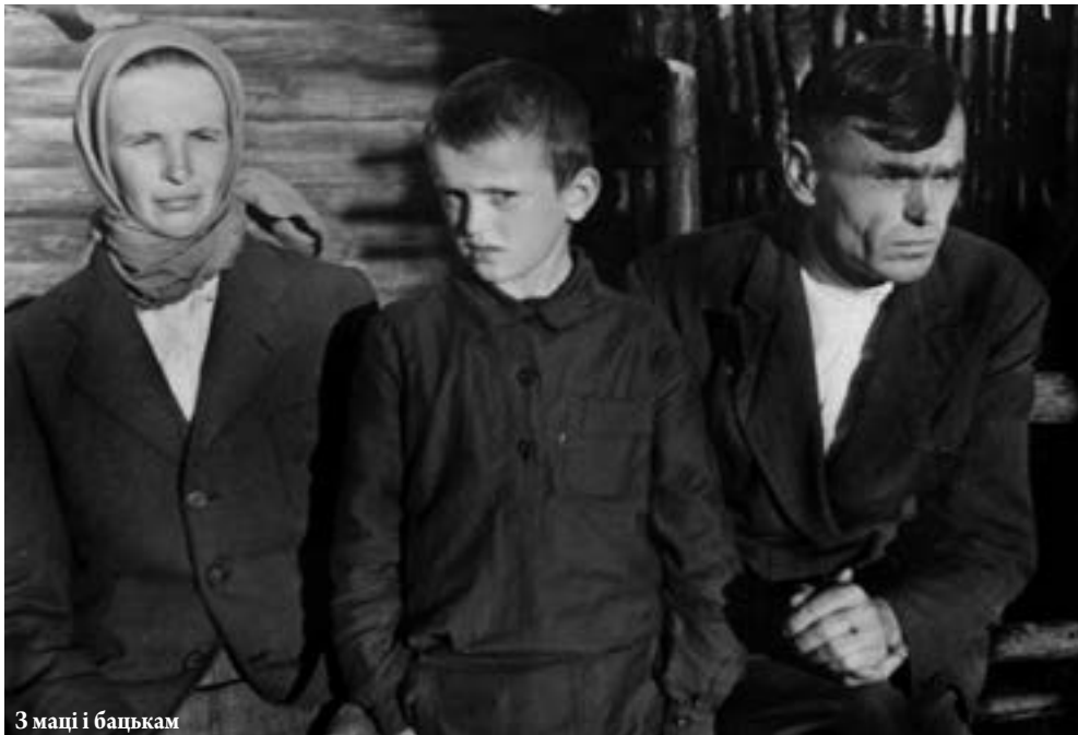
З маці і бацькам

Да нашых суседзяў Ракіцкіх прыехаў сваяк з Ленінграда. Ён і сфатаграфаван.