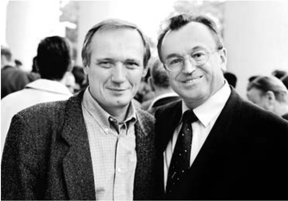
З Уладзімірам Някляевым

Некалі ён меў рэпутацыю аднаго з самых талковых чальцоў беларускага ўраду. «Асновай новай стратэгіі могуць стаць толькі эканамічныя рэформы!» — паўсюль заяўляў Марыніч, і хутчэй за ўсё менавіта праз гэта (бо Лукашэнка не збіраўся нічога рэфармаваць) быў пазбаўлены месца ўпраўлення і сасланы ў дыпламаты.