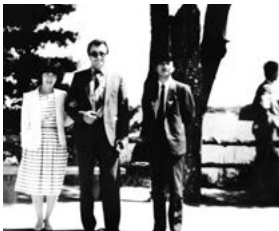
With the translator and the host