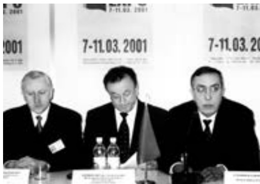
Official opening of the exhibition

The feeling of freedom is the main thing. Foreigners have smiles on their faces; the shops are stuffed with goods. Belarus is quite the opposite story. Bureaucracy tailored to slavish idolatry began to lift its head once again.