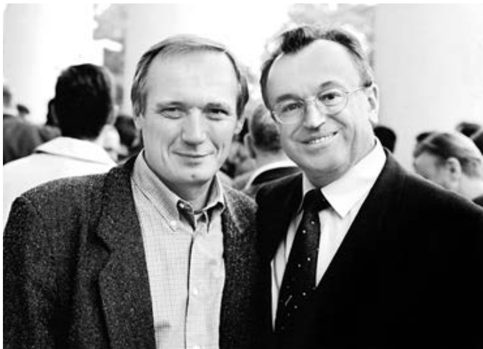
With Uladzimir Niakliayeu

"exile". He visited Helsinki as an Ambassador of Belarus to Latvia, Estonia, and Finland. We met. We had had a relationship of trust for a long time, and he told me about the plan for the presidential election 2001.