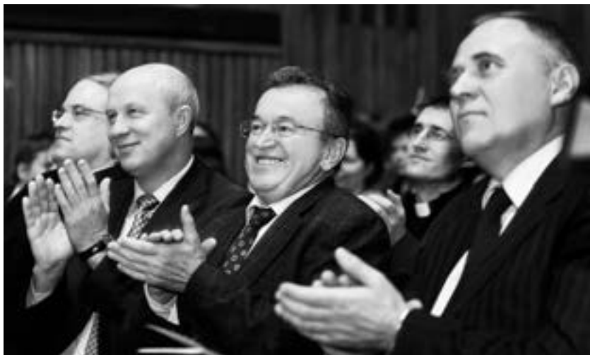
С бывшими кандидатами в президенты Александром Козулиным и Николаем Статкевичем (справа)

После того как я более или менее восстановился, активной политикой уже не занимался. Хотя время от времени меня и звали на различные оппозиционные мероприятия, например, на учредительный съезд Белорусской христианской демократии, куда в январе 2009 года я был приглашен в качестве почетного гостя.