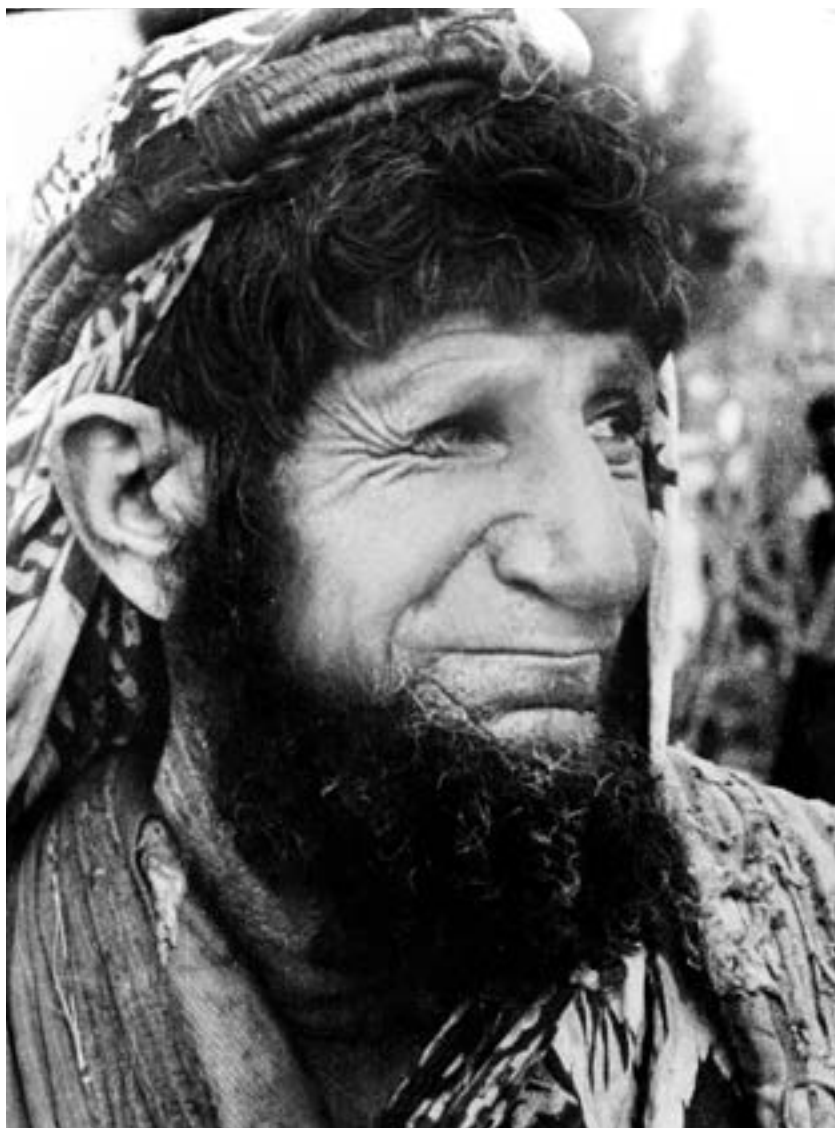
The winning photo

I was so into photography that even dared to participate in the photography competition organized by the Soviet embassy. My picture won, and I still keep it in my album.