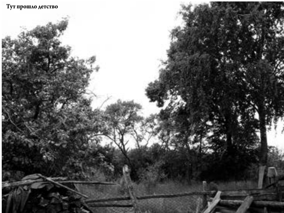
Тут прошло детство

Как и все люди, я вспоминаю свое детство и юность с доброй грустью, и на ум приходят строчки одной популярной песни — «няма таго, што раньш было».