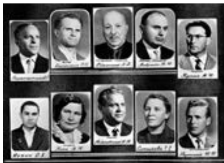
Тыя, хто вучыў

1964 год. Выпуск. Два самыя першыя фота «дзямбельскага» альбома групы № 100. На адным — нашы выкладчыкі, на другім — будучыя інжынеры. Як стараста, я ў самым цэнтры.