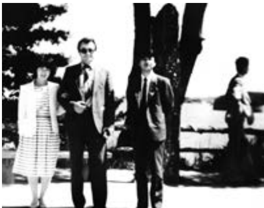
З перакладчыцай і гаспадаром