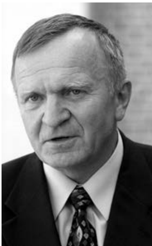
Mikhail Chyhir, former head of the Belarusian government (1994-1996)

Mikhail Marynich was raised in the Soviet system but soon he learned better. I could see that he would not endure long at his post. And so it happened."