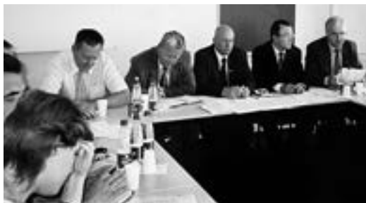
Во время пресс-конференции

Подобные контакты в то время были не единичными. Сначала вопросами реформирования белорусской экономики мы занимались параллельно с депутатской группой «Республика», а потом объединили свои усилия