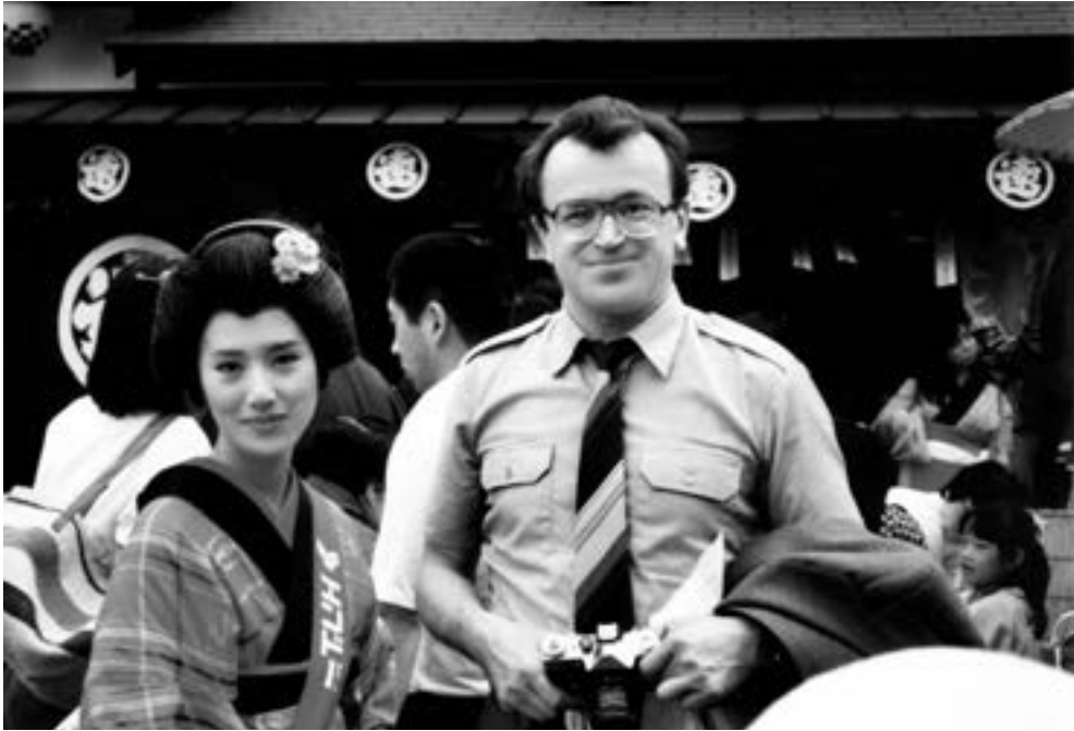
Снова в Японии

Мне судьба даст еще одну возможность побывать в Стране восходящего солнца и сделать на память снимок с одной из местных красавиц.