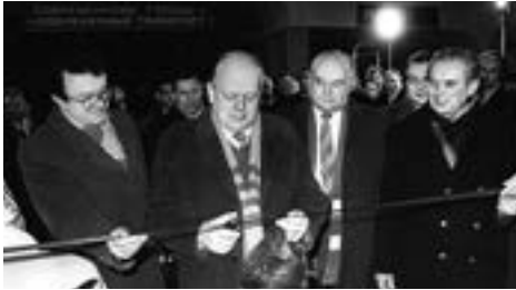
Stanislau Shushkevich was a regular visitor

"Uskhod" was built in 1986, and the second line began to operate on December 30 th , 1989, right before my appointment to the main position in the capital.