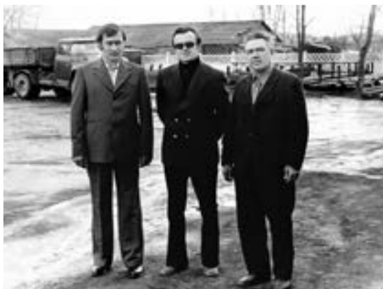
Первые трудовые снимки

Сначала я работал мастером, а через год стал начальником участка.