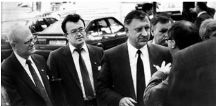
One of the visits by Mikhail Miasnikovich

From time to time we were visited by Mikhail Miasnikovich, who was one of the deputies of the then prime minister Kebich. This picture is evidence of that.