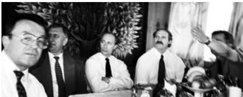
Всем знакомые лица

Собчаковская молодая команда мне очень понравилась. Потом мы довольно длительное время переписывались, поздравляли друг друга с разными праздниками. Словом, достигли того уровня отношений, который называют неформальным. О чем и свидетельствует еще один снимок.