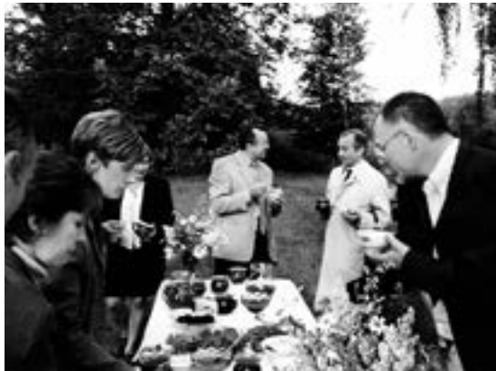
In the open air

I really wanted Belarus to follow Latvia on its path, and I did my best to promote Belarus abroad. This picture is