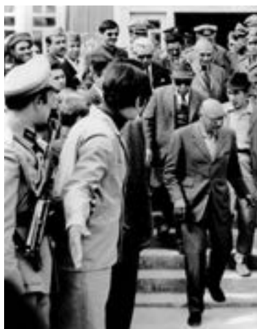
Король идет первым

Сначала я снимал его с крыши автобуса, что и запечатлено на фото одного из друзей.