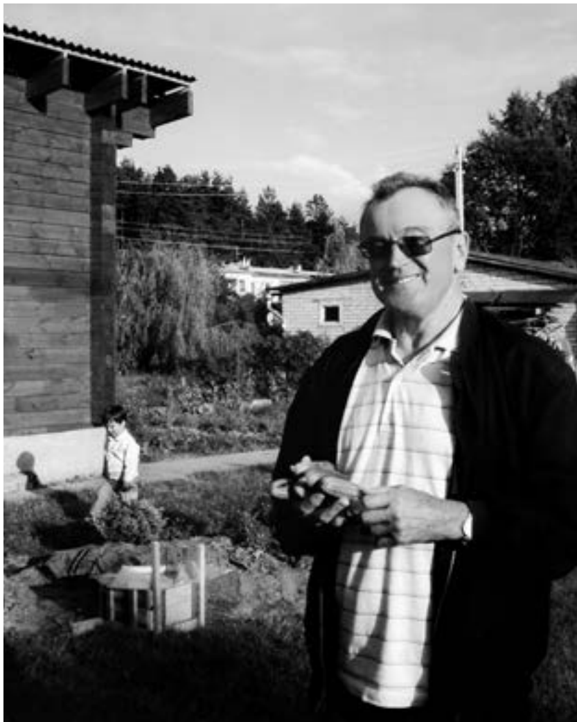
In the countryside