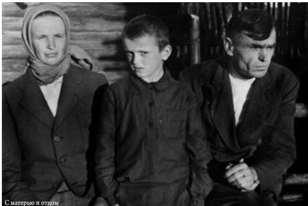
С матерью и отцом