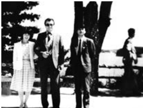
С переводчицей и хозяином