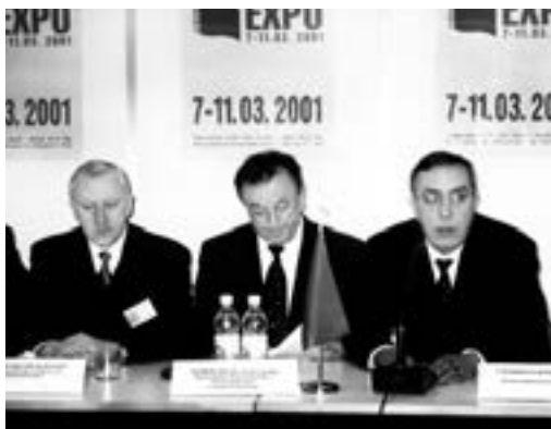
Афіцыйнае адкрыццё выставы

Дарэчы, пра такія прыклады вельмі станоўча потым выказалася беларускае МЗС. Маўляў, так і павінны працаваць дыпламаты. Безумоўна, тая паездка крыху падкарэктавала стэрэатыпы ўспрымання за мяжой нашай краіны, але засталася толькі «пясчынкай у моры».