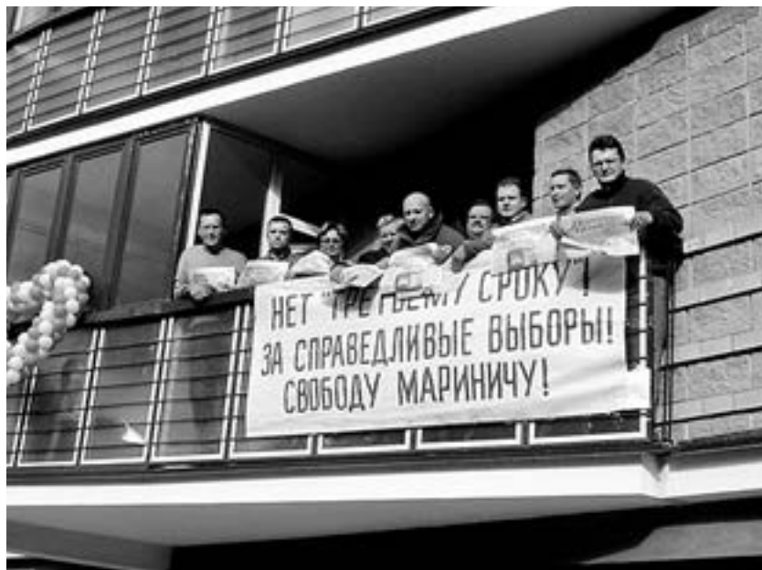
Змаганне за свабоду