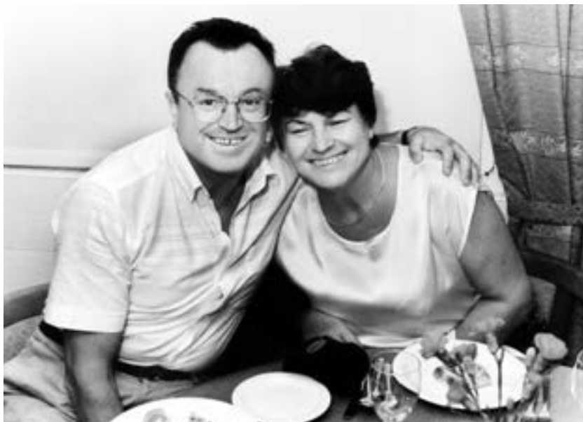
With wife Liudmila