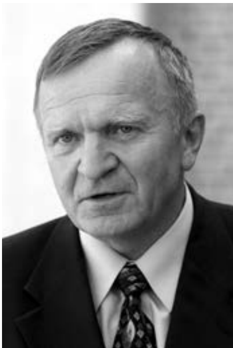
Міхаіл Чыгір, былы кіраўнік беларускага ўрада (1994-1996)

Міхаіл Марыніч быў выхаваны савецкай сістэмай, але вельмі хутка змяніў свае погляды. Для мяне было цалкам зразумела, што доўга ён там не пратрымаецца. Так і адбылося».