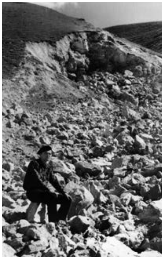
После мирного взрыва

людьми, меня иной раз просто шокировало. Другой менталитет. У нас такое невозможно по определению.