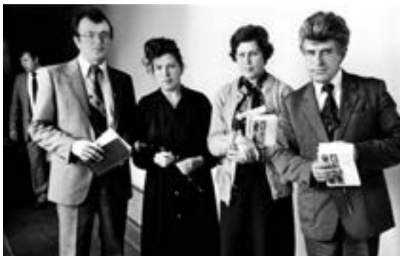
Поздравляем с Днем учителя

В 1984 году я стал заместителем председателя Минского горисполкома (слово «мэр» тогда не употребляли) и сразу получил поручение заняться строительством Минского метро. Первая ветка столичного метрополитена была построена при мне. А за станцию «Восток» даже получил премию Совета Министров СССР.