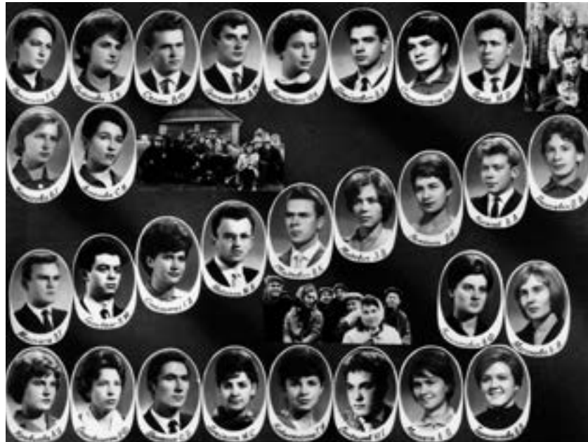
Тыя, хто вучыўся

Пасля заканчэння палітэха даволі хутка адчуў, што нечага не хапае яшчэ, і паступіў у аспіран-