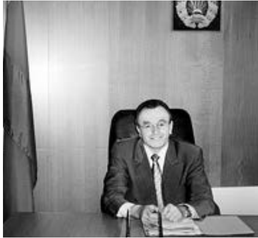
In the office