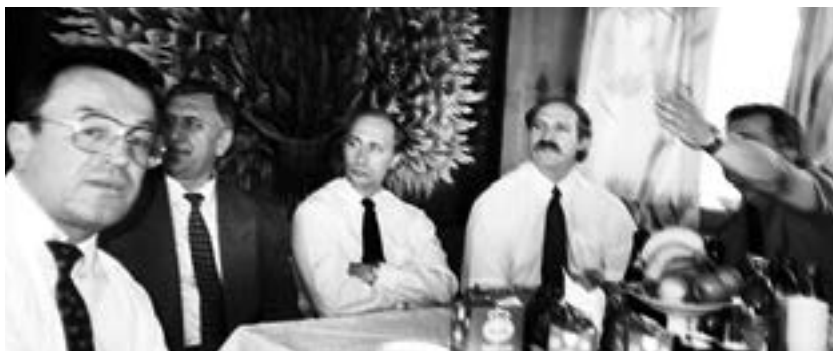
Усім знаёмыя твары

Сабчакоўская маладая каманда мне вельмі спадабалася. Потым мы даволі працяглы час ліставаліся, віншавалі адзін аднаго з рознымі святамі. Словам, дасягнулі таго ўзроўню адносін, які называюць неформальным. Аб чым і сведчыць здымак.