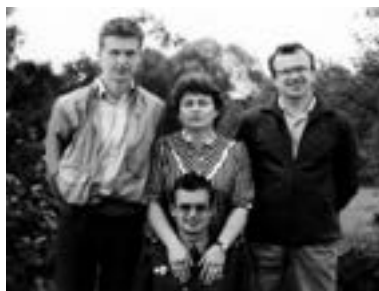
Visiting the military graduation ceremony

However, the color of khaki is not what I want to finish my recollections of those years with. Our profession — construction — was one of the most peaceful ones.