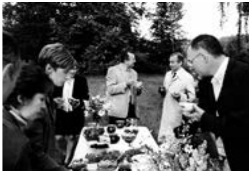
На свежем воздухе

Зарубежным дипломатам было интересно побывать в доме, где родился Марк Шагал, и в усадьбе известного художника Ильи Репина, посмотреть на чашу амфитеатра, где проводится «Славянский базар». Была, конечно, и неформальная часть, с которой и сохранилось это фото.