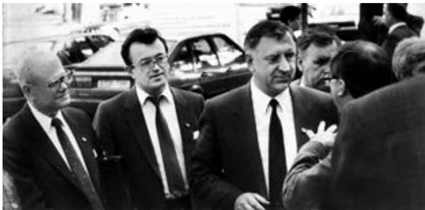
Очередной приезд Михаила Мясниковича

Время от времени нас навещал Михаил Мясникович, который тогда был одним из заместителей премьера Кебича, о чем свидетельствует этот фотоснимок.