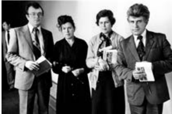
Congratulations on the Teachers' Day

In 1984 I became deputy chairman of the Minsk City Executive Committee (the word "mayor" was not in use then). Immediately they put me in charge of building the Minsk Metro. The first line of the metropolitan railway was built under my supervision. I even received an Award of the Council of Ministers of the USSR for Uskhod metro station.