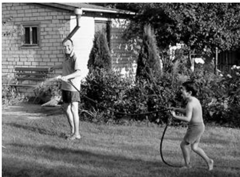
З сынам Міхаілам