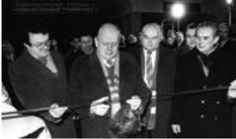
С. С. Шушкевіч — часты госць

«Усход» пабудавалі ў 1986 годзе, а па другой лініі рух пачаўся 30 снежня 1989 года, якраз перад маім прызначэннем на галоўную сталічную пасаду.