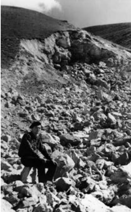
Пасля мірнага ўзрыву

талітэт. У нас такое немагчыма па вызначэнню.