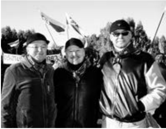
At a rally

Lithuania, because we had certain doubts about Belarus. We had a good reason, as special services often do nasty tricks just to show off.