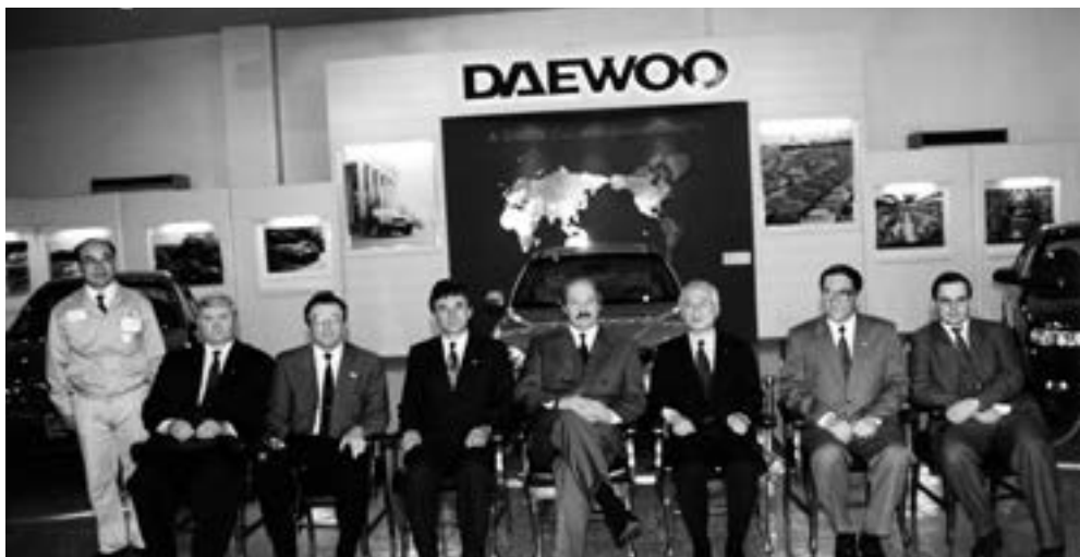
A «might-have-been» project