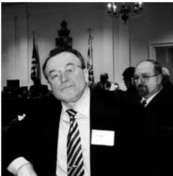
Абмеркаванне праблем бізнесу