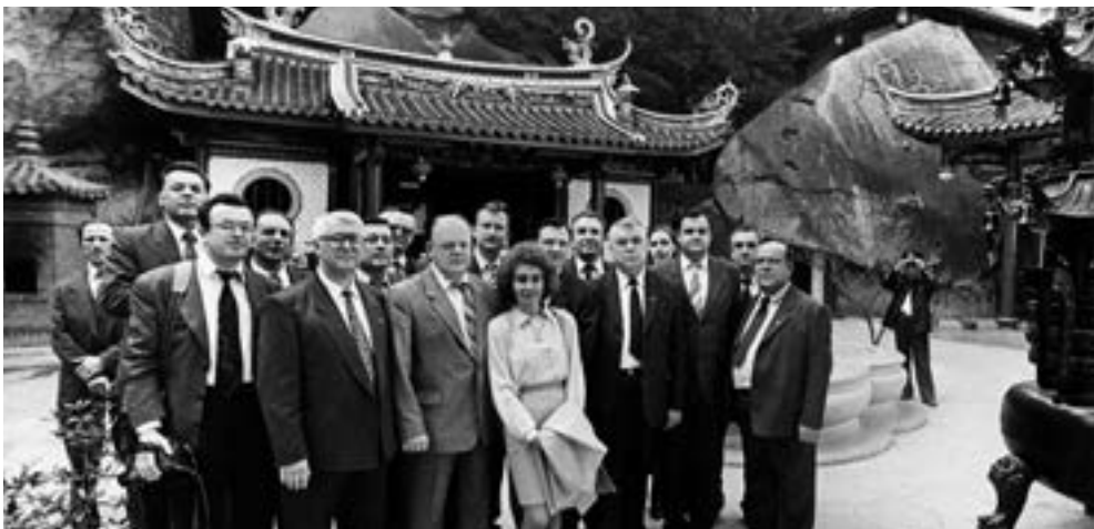
The official delegation

There were many interesting politicians back then, many