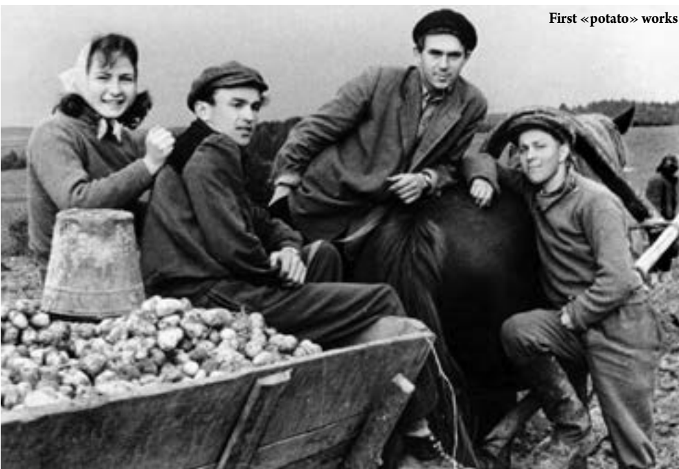
First «potato» works

In a sense, we were subcontractors for our colleagues from the other faculty who were doing the "related works".