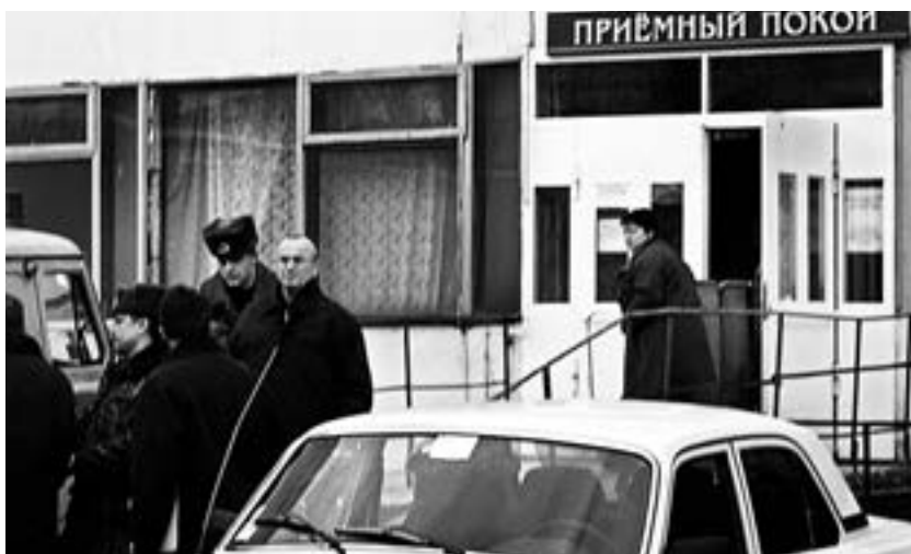
Road of sorrows