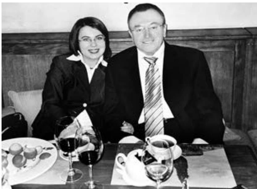
With wife Tatsiana