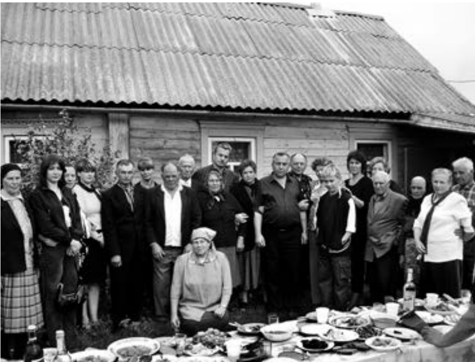
After the funeral

Let's see another photo, a very sad one. My cousin died when I was in jail. At home folks took a picture of the funeral dinner and sent it to me.