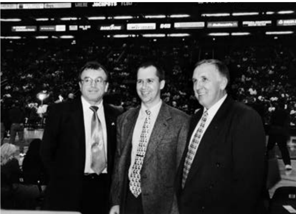
In the United States

I think that experience had something to do with his appointment as head of our High-Tech Park.