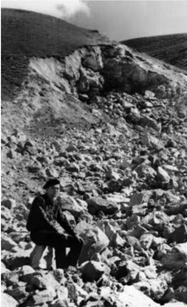
After peaceful explosion

meet us. I don't know why, but he really didn't like something. Probably, it was the way the passengers were seated in the car, "not according to rank", as they say. Soviet specialists and local residents sat together.