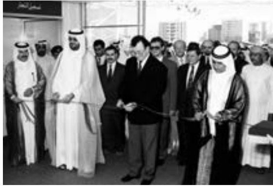
The eastern vector

However, his intentions were EXTREMELY welcome in the president's office.