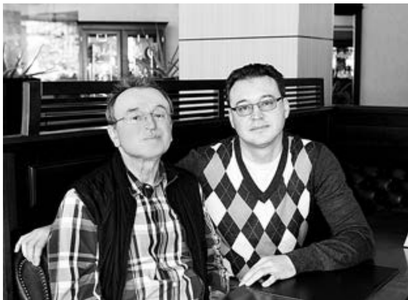
З сынам Паўдам