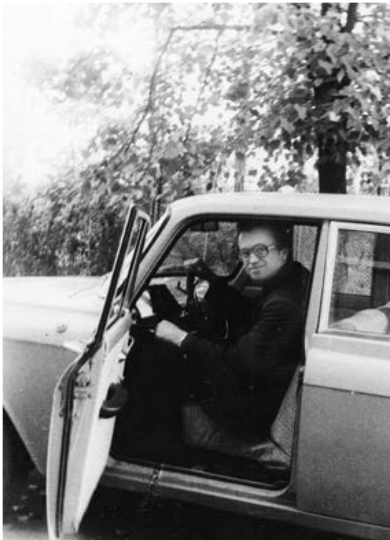
The first wheels

I got rich after that trip abroad and bought my first car, a Moskvich-412, an export version. With this picture I want to turn over the "Afghan" page of my life.