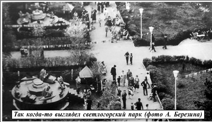
Так когда-то выглядел светлогорский парк

Благодаря сбору подписей за восстановление в Светлогорске парка культуры и отдыха дело сдвинулось с мертвой точки: рабочая группа, созданная райисполкомом, обозначила план мероприятий по благоустройству парка. Об этом сообщается в полученном Сергеем Дайнеко ответе райисполкома на коллективное обращение почти 2,5 тысяч жителей города: