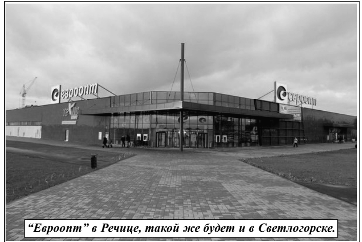
«Евроопт» в Речице, такой же будет и в Светлогорске.