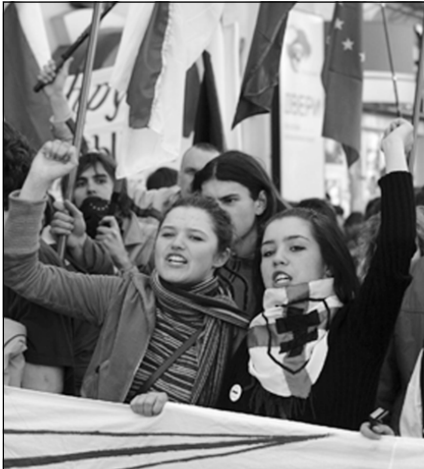
Моладзь прыняла актыўны ўдзел у святкаванні Дня Волі.

- Вуліца - гэта заўсёды патэнцыял стыхіі. Улада, канешне, можна спекуляваць на гэтым: "Мы абмяжоўваем, каб не было даўкі". Цікавая сітуацыя. Улада калісьці праводзіла сваё мерапрыемства, пасля якога адбылася такая таўканіна ў цэнтры Менска (трагедыя на Нямізе ў траўні 1999г. - рэд.) Глядзіце, у што ператварыўся натоўп. Гэта зноў спекуляцыя. Тады міліцыя элементарна не справілася са сваімі абавязкамі забяспечваць парадак. Я штосьці не прыгадваю, каб у нас апазіцыянеры самі