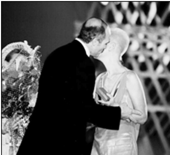
Рыгоровіч на Славянскім базары ў Віцебску.

У нашай сьліне пражывае агромністая колькасць бактэрыяў. Прычым 80% з іх аднолькавыя ва ўсіх людзей, а 20% індывідуальныя. Дык вось, калі пры пацалунку чужыя бактэрыі трапляюць да нас, наша абарончая сістэма прыходзіць у баявую гатоўнасьць, запускаяецца працэс зьяўленьня антыцелаў. Гэта дае моцны штуршок імунітэту. Стаматолягі лічаць, што рэгулярныя і працяглыя пацалункі - чудоўная прафіляктыка карыесу. Справа ў тым,