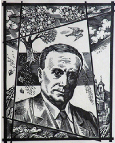
Яўхім Кіпель – прэзідэнт Другога Беларускага кангрэсу, пісьменнік, публіцыст. Мікола Рыжы. 1993.

Масавыя арышты пачаліся ў 1930 годзе. У першай палове году арыштоўвалі па два, па тры чалавекі ў месяц, а ў ліпені арыштавалі некалькі сот чалавек. Арыштавалі ня толькі навуковых супрацоўнікаў Акадэміі Навук ды ўніверсітэту, але і многа настаўнікаў з раённых гарадоў. У першую хвалю арыштаў трапіла амаль уся беларуская эліта: акадэмікі Я. Лёсік, С. Некрашэвіч, Б. Элімаў-Шыпіла, прафэсары М. Азбукін, І. Васілевіч, Г. Гарэцкі, Я. Дыла, П. Жаўрыд, І. Серада, А. Смоліч, Я. Сушынскі, М. Пракулевіч, А. Цьвікевіч, доктар І. Цьвікевіч, інжынер Ч. Родзевіч ды шмат іншых. Разам зь імі арыштавалі некалькі сот маладзейшых беларусаў.