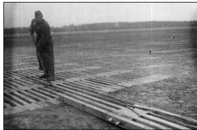
Будаўніцтва аэрадрому пад Мінскам, вясна 1941 года