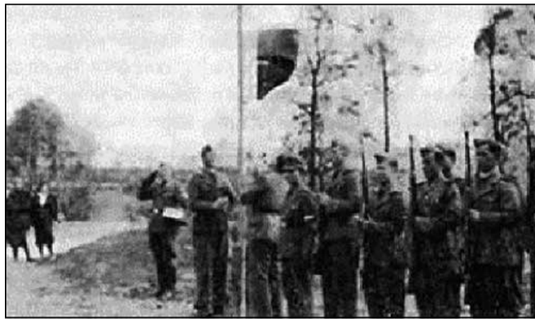
Байцы брыгады СС «Дружына»

ла, гвалціла, а пры найменшым супраціве — збівала і расстрэльвала. Дайшло да таго, што часам жыхары, заўважыўшы загадзя набліжэнне расійскіх аддзелаў (пазнаць іх было лёгка па вялікай колькасці абозу), шукалі аховы пры нямецкіх «штыцпунктах» ці мясцовых гарнізонах, калі такія былі ў ваколіцы. Бывалі выпадкі і сутычак між мясцовай беларускай паліцыяй і радыёнаўцамі.