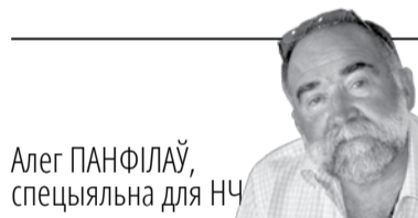
Алег ПАНФІЛАЎ, спецыяльна для НЧ

Сербы, якія перажылі навязлівае каханне Расіі, хлусню і падман Крамля, вырашылі зрабіць выбар: на парламенцкіх выбарах перамагла партыя Аляксандра Вучыча, праеўрапейскага палітыка.