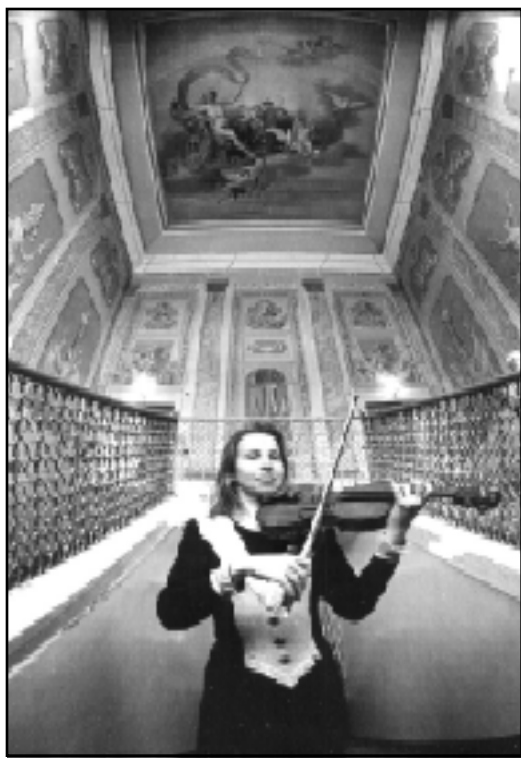
«Музы Нясвёжжа» ў Радзівілаўскім замку.

Цяпер у Полацкай Сафіі ёсьць яшчэ адзін фестываль — арганнага мастацтва.