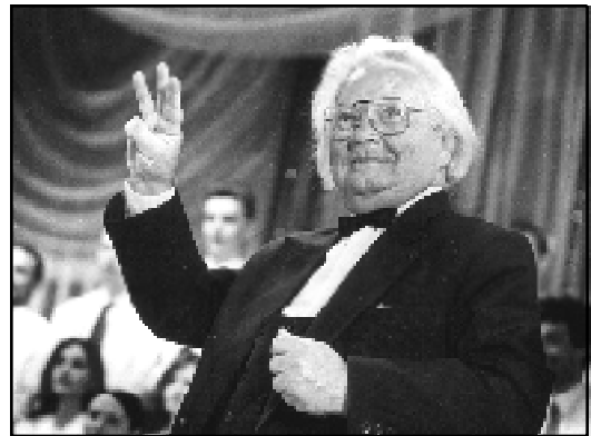
Маэстра Роўда. (1996).