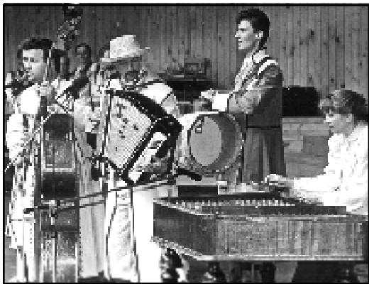
«Зьвіняць цымбалы і гармонік» у Паставах.

Кожнаму — сваё... Але ж і я — глядзяч. Мне дык ніякавата бывае ад «жывых» трансляцыяў гала-канцэртаў. Бачыш артыстаў паважанага нацыянальнага ансамблю. Буйным планам. Стараюцца, каб адпавядаць фанаграме, ды само гучаньне песьні выдае нават не «мінусоў-