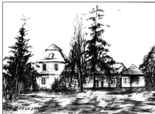
Дом Дамейкаў у Сант’яга і маёнтак у Медзьвядцы напрыканцы XIX стагоддзя.

Папера, аловак. Малюнкi Хрысьціны Сіўчыкавай.