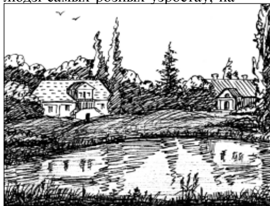
Маёнткі ў Медзьявядцы і ў Туганавічах.

Папера, пігментная (тэхнічная) асадка. Малюнкi Уладзіміра Сіўчыкава.