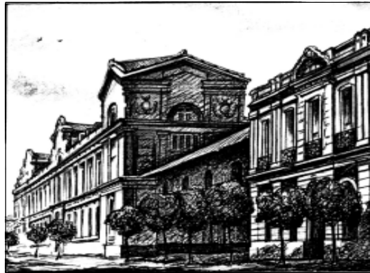
Гмахі універсітэта ў Сант’яга дэ Чылі, рэктарам якога быў І.Дамейка. Папера, аловак, шарыкавая асадка. Малюнак Уладзіміра Сіўчыкава.

На вялікі жаль, мы дагэтуль не навучыліся як сьлед шанаваць выдатных сыноў нашае Бацькаўшчыны... “Няма прарока ў сваёй Айчыне”? Ці такі ўжо лёс наканаваны ўраджэнцам беларускай