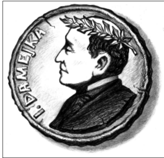
Ігнацы Дамейка. Праект медаля. Папера, аловак, шарыкавая асадка. Малюнак Уладзіміра Сіўчыкава.

маёй малодшай дачкі Хрысьціны ў падрыхтоўцы да святавання 200-годдзя нашага славутага земляка Ігнаца Дамейкі. З ласкі велешаноўнага спадара Адама Мальдзіса (дарэчы, гэтаксама юбіляра 2002 го-ду!) патрапілі да нас ксеракопіі з польскае кнігі – грунтоўнае манаграфіі Зьдзіслава Вуйціка “Ігнацы Дамейка. Літва. Францыя. Чылі”. Хрысьціна натхнілася тымі ілюстрацыямі – старадаўнімі літаграфіямі, малюнкамі і фатаграфіямі ды падахвоцілася на некалькі ўласных графічных аркушаў. Праўда, пасля напружанага навучальнага года, у сьпякотных чэрвеньскія дні праца ішла досыць