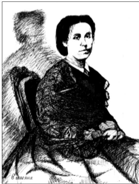
Жонка І. Дамейкі — Эррык’эта Сатамаёр-Гузман. Малюнак Хрысьціны Сіўчыкавай.

Праз некалькі гадоў наш славуты зямляк стаў удзельнікам паўстаньня на Беларусі і ў Польшчы 1831 году. Быў інтэрніраваны прускімі ўладамі ў Расію, але здолеў вырвацца з палону і выехаў са сваім даўнім сябрам Адамам Міцкевічам у Парыж, дзе паэт пачаў пісаць эпопею шляхецкага жыцьця “Пан Тадэвуш”. Дамейка спрыяў стварэньню гэтай паэмы, і яна нават першапачаткова называлася філа-