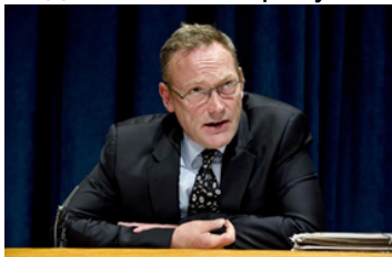
Бен Эммерсон, специальный докладчик ООН по вопросу защиты прав человека в условиях борьбы с терроризмом

В конце сентября 2014 г. был опубликован четвертый ежегодный доклад специального докладчика ООН по вопросу защиты прав человека в условиях борьбы с терроризмом Бена Эммерсона. Доклад основан на результатах анализа, проводившегося с 17 декабря 2013 г до 31 июля 2014 г.