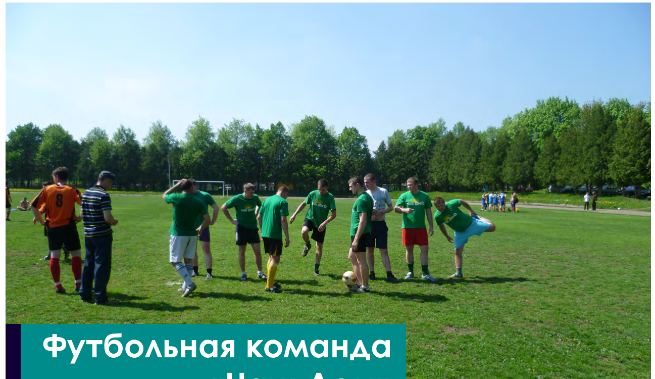
Футбольная команда «Наш Дом»

Гражданская Кампания «Наш Дом» зарегистрирована в Чехии как «Международный Центр гражданских инициатив «Наш Дом».