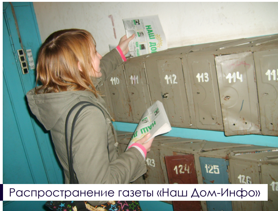
Распространение газеты «Наш Дом-Инфо»

Гражданская Кампания «Наш Дом» зарегистрирована в Чехии как «Международный Центр гражданских инициатив «Наш Дом».