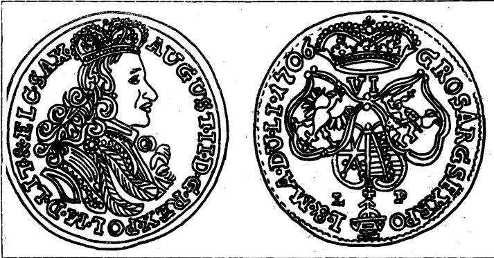
Шасцігршовік 1706 года, адчаканены ў Гародні.