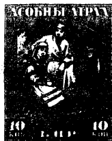
Маркі часу БНР.