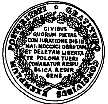
Талер 1793 года, адчаканены ў Гародні.