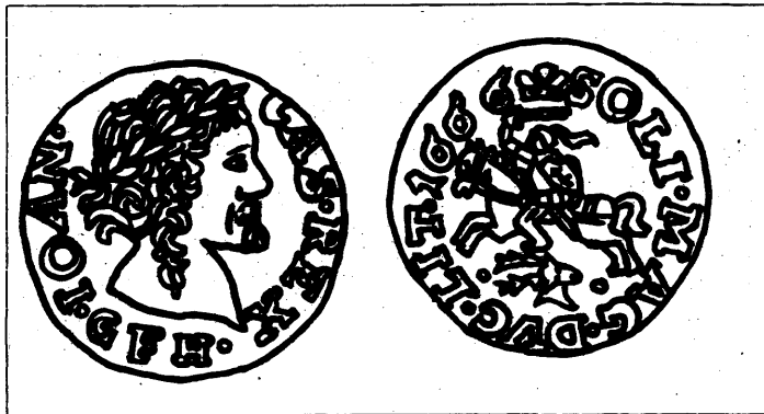
Шэлег ВКЛ, адчаканены ў Бярэзцы.