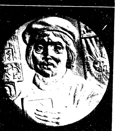
А. ЗІМЕНКА, 1986 г., rinc тапіраваны.