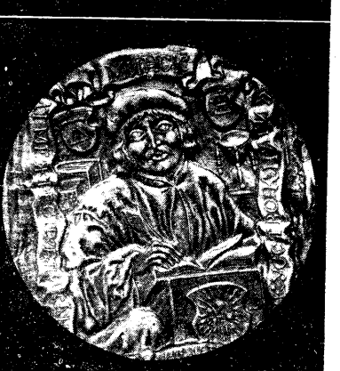
М. БАЙРАЧНЫ, 1979 г., кераміка.