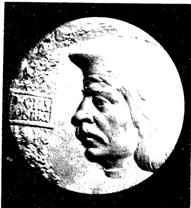
Р. ІВАНОВ, 1985 г., сілімін.