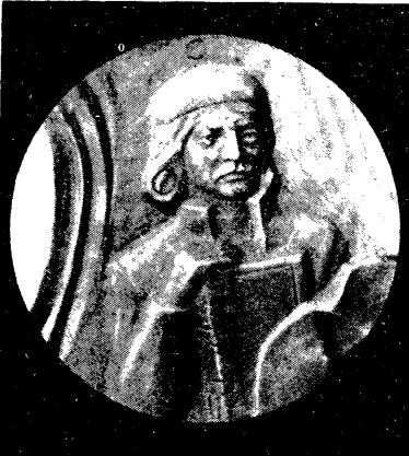
М. КАНЦАВА, 1985 г., сілімін тапіраваны.