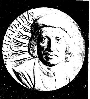
Г. АСТАШОНАК, 1985 г., сілімін.