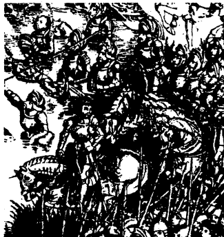
Аршанская бітва (фрагмент). Пераправа войска Астрожскага праз Дняпро. З карціны XVI ст.

8 верасня 1514 г. і пачалася рашаючая бітва паміж Оршай і Дуброўным на р.Крапіўне, недалёка ад Аршанскага замка. Бітву пачало маскоўскае войска, і ў адказ на гэта К.Астрожскі пасля кароткай прамовы паўвёў у атаку сваю конніцу, і завязаўся жорсткі бой, які некаторы час ішоў з пераменным поспехам для двух бакоў. Адназначна, што з маскоўскага боку ў атаку пайшлі палкі Булгакава-Голіцы, а Чаляднін