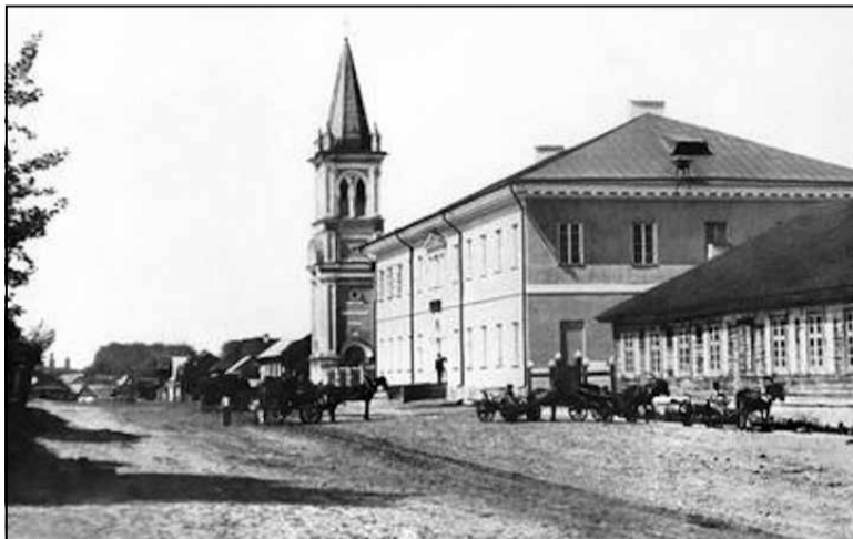
Слутцкая гімназія. Пачатак ХХ ст.

Быў малады, а таму, мякка сказаўшы, не зусім разумны. Гэта ж колькі можна было ўведаць! Але што-колечы асела ў памяці і час ад часу падавала сігналы, нагадвала пра сябе.