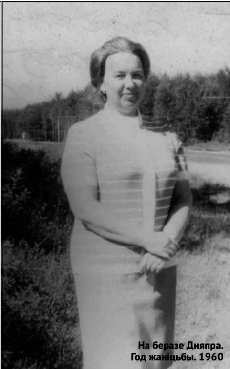
На берэзе Дняпра. Год жаніцьбы. 1960