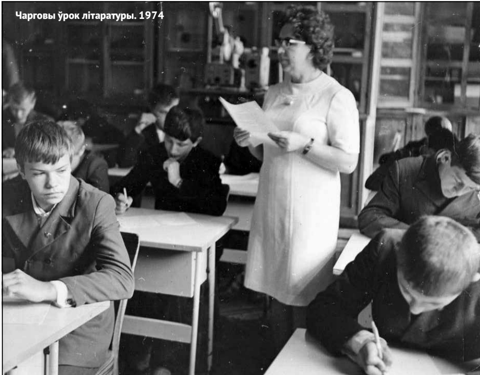
Чарговы ўрок літаратуры. 1974