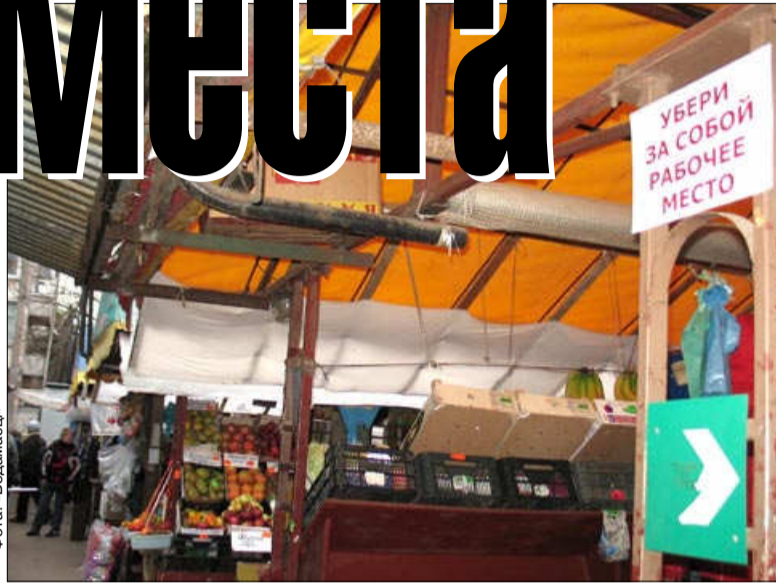
На рынке Форты скоро уберут все рабочие места

Мини-рынки в сегодняшней форме создавались в Гродно в 2001-2003 годах именно как мера «перехода к цивилизованной торговле». Городские власти таким образом «упорядочивали» стихийную торговлю возле самых популярных магазинов. Торговля «с асфальта», однако, не исчезла и вряд ли исчезнет и после появления супермаркетов. Популярным людям, которые продают в небольших количествах домашний творог, молоко, зелень с частных огородов, сало и мясо, яблоки, семечки, вяленую рыбу, носки ручной вязки - оплата места на мини-рынке, а тем более регистрация предпринимателем, остается не по карману.