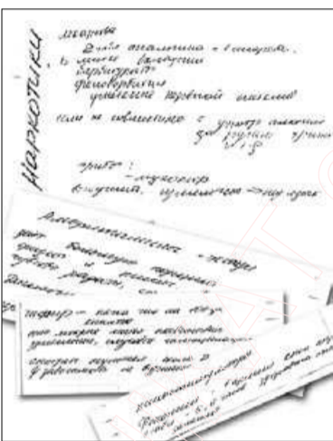
Канспект студэнтаў псіфака

“Звычайнага чалавека не адпусцілі б! Ён прызнаўся ў факце неаднаразовага продажу наркатыкаў нават дзецям - Здасюку пагража-