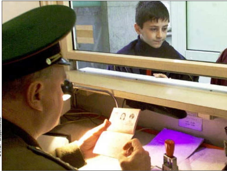
Ваше імя ў «базе дадзеных» спраўдзіць памежнік

Забарону на выезд грамадзянаў з тэрыторыі Беларусі рэгулюе Закон «Аб парадку выезду з Рэспублікі Беларусь і ўезду ў Рэспубліку Беларусь грамадзянаў Рэспублікі Бела-