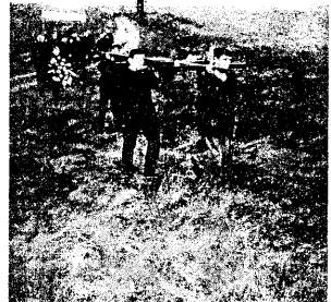
Крайовы падыходзяць да месца усталяваньня крыжа

21 ліпеня (2 жніўня па н.ст.) Міхал Валовіч быў павешаны ў Гродне. Пазьней каты таёмна схавалі цела