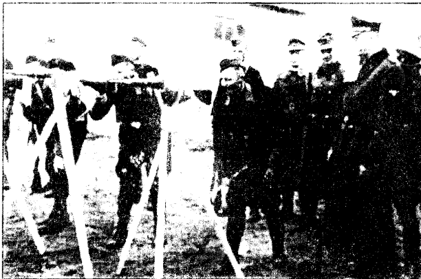
Жаўнеры БКА на занятках па стральбе, 1944 г.

...Родзька Усевалод закідаў штабу /БКА - С. Е./, што штаб складаецца зь вельмі маладых афіцэраў і выглядае непаважна. Я асабіста цалкам зь ім згаджаўся... Увага затрымоўвалася на адзіным кандыдаце на штабную працу - гэта на падпалкоўніку царскай арміі Гуцько Язэпу. Прэзыдэнт /Беларускай Цэнтральнай Рады, Радаслаў Астроўскі - С. Е./ напісаў пісьмо да Гуцько, запрашаючы яго на начальніка штабу БКА. Гуцько свой прыезд у Менск адцягваў і прыбыў толькі ў пачатку траўня 1944 году разам зь Якуцэвічам Паўлам. Пры першай гутарцы з Прэзыдэнтам падпалкоўнік Гуцько згадаў прыняць становішча начальніка штабу і на другі дзень зьявіўся да мяне, просячы, каб я даў яму акты для азнаямленьня. Прагледзеўшы акты, Гуцько пайшоў да Прэзыдэнта і катэгарычна адмовіўся ад працы ў БКА. У гутарцы са мною ён сказаў, што калі апэрацыйная частка штабу належыць не да