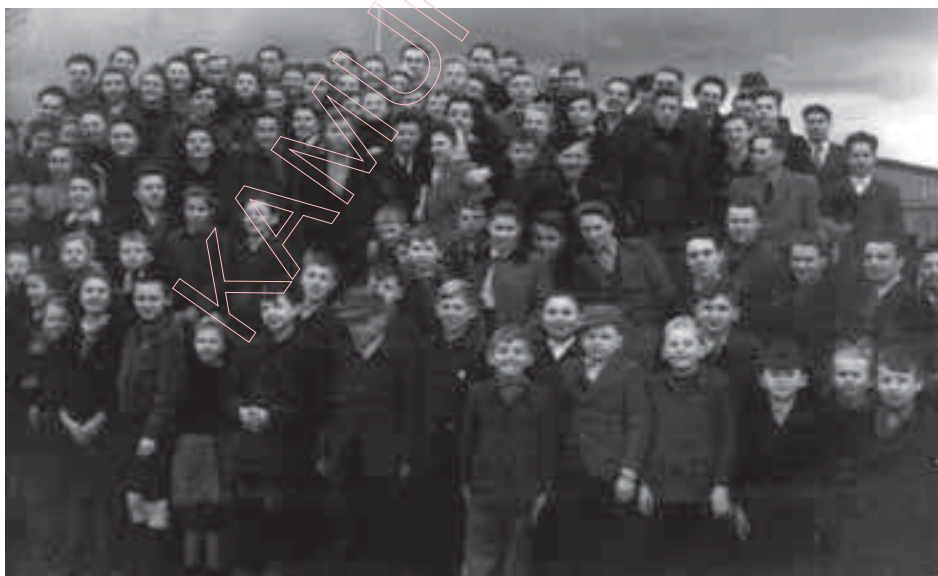
У дзень ад’езду Адзінаццаткі ў Вялікабрытанію. Разьвітаньне з малодшымі сябрамі. Міхэльсдорф, 8 студзеня 1948 г.