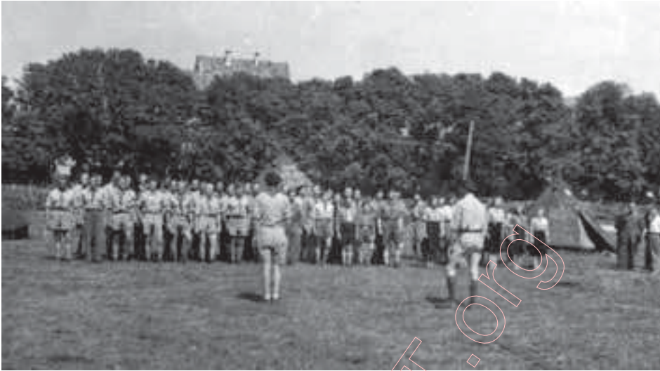
Удзельнікі Другога гадавога з'езду скаўцкіх кіраўнікоў і сэн'ераў у Остэргофэне, Нямеччына. Жнівень 1947 г.