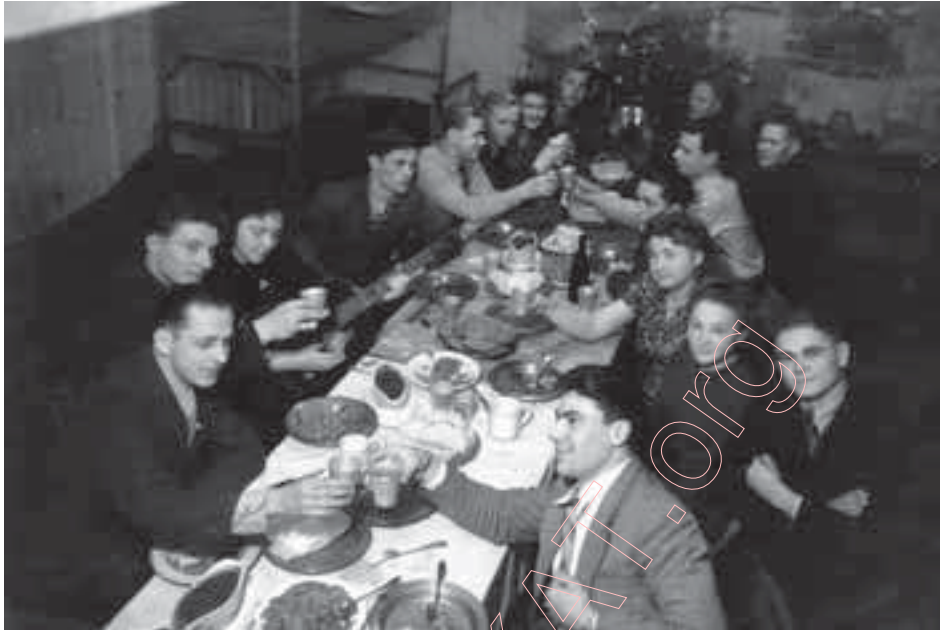
Міхэльсдорф. Бурса – пакой „Галоднай браціі”. Сустрэча Новага 1947 г.