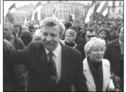
А. Мілінкевіч падчас сустрэчы з прыхільнікамі

Удзельнікаў галадоўцы ў падтрымку пратэстанцкай царквы "Новае жыццё" наведваў лідэр дэмакратычных сіл Аляксандр Мілінкевіч.