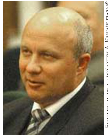
Былы кандыдат у прэзідэнты А. Казулін галадуе 52 дні з патрабаваннем разгляду палітычнай сітуацыі ў Беларусі на Радзе Бяспэкі ААН