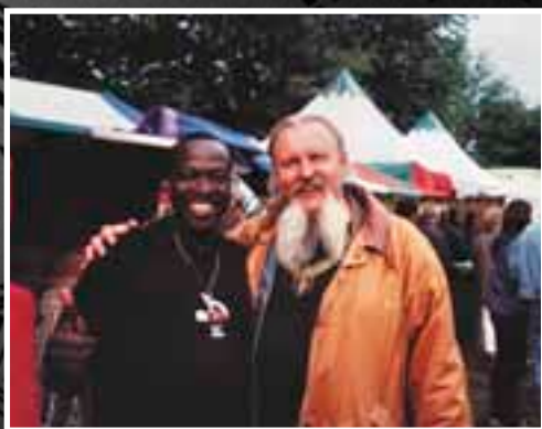
Mundial. Тилбург. Голландия