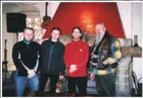
Антс и этно-трио Троица. Эстония