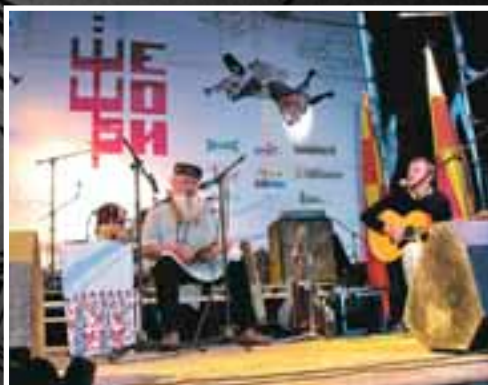
Шешори. Украина. 2007