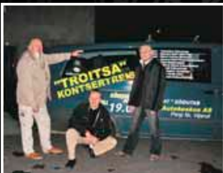
Наш тур. Эстония. 2005