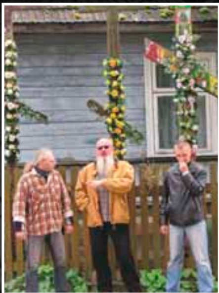
Съемки для польского ТВ. 2007