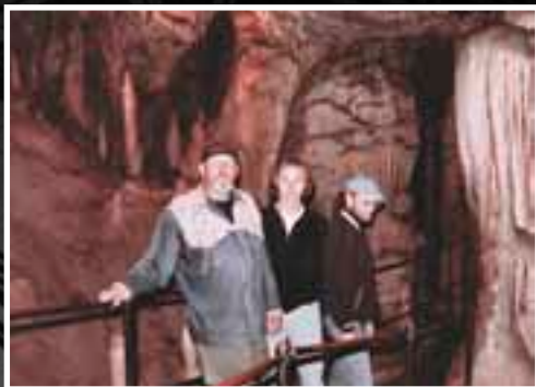
«Постойска яма». Словения