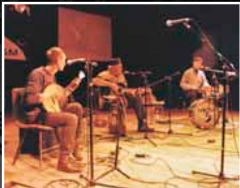
Первые выступления «Троицы»