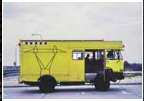
DAF — 6 тонн!