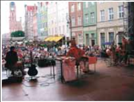
Гданьск. Польша. 2005