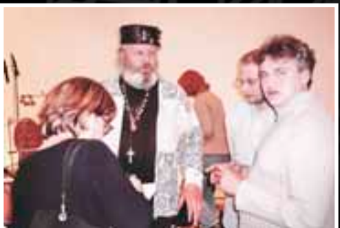
У Д. Диброва на «Антропологии. Москва»