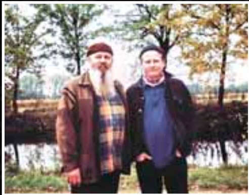
С Лайошем Фогораши