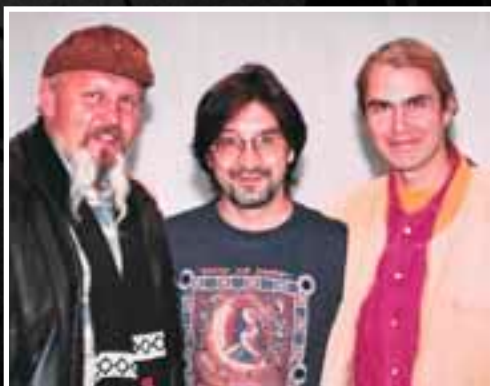
С Ю. Шевчуком