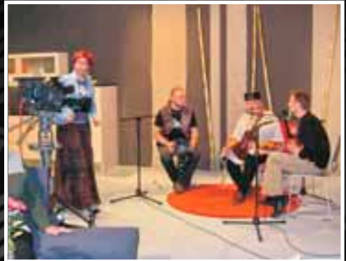
Эстонское ТВ. Таллинн