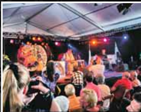
Folkwood. Эйнховен. Голландия. 2006