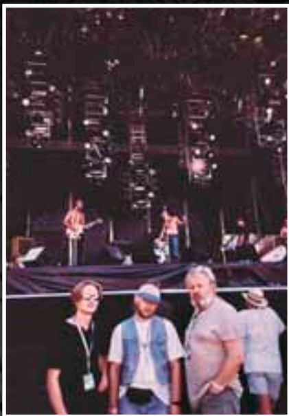
Sziget. Венгрия. 1999