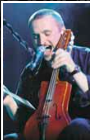
Ю. Дмитриев. 2008