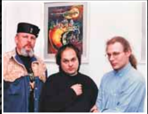
гр. «Князь Мышкин». Брест. 1998