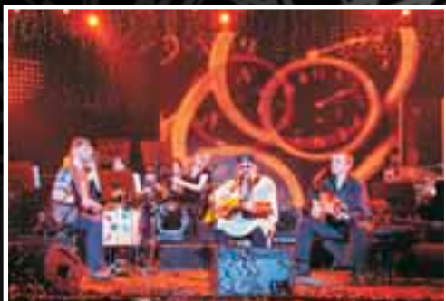
Белосток. Польша. 2006