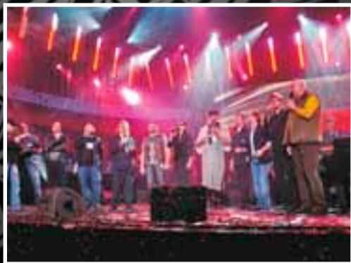
Белосток. Польша. 2006