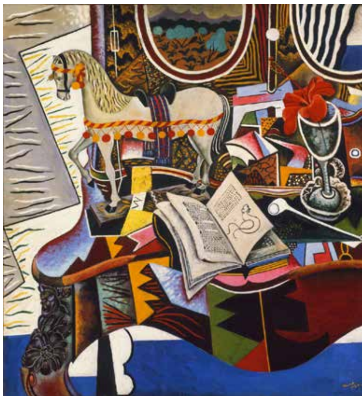
Мая майстэрня. Жаан Міро