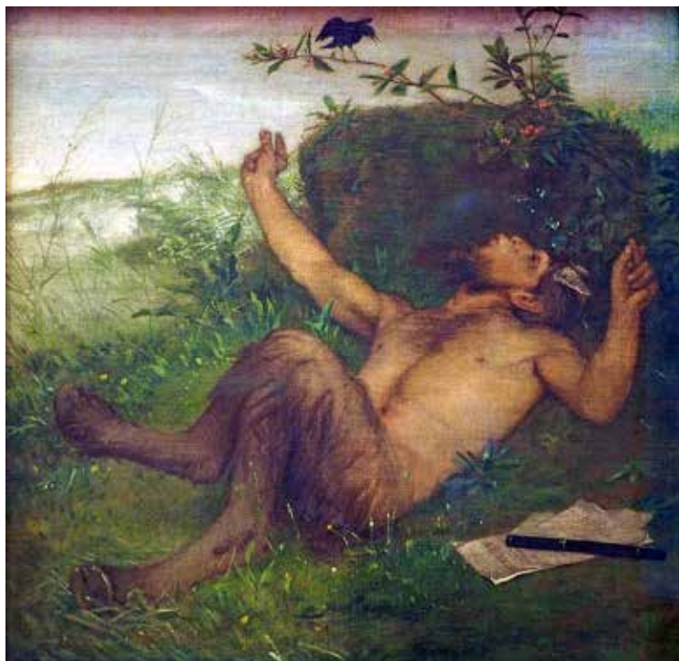
Фаўн і дрозд. Арнольд Бёклін