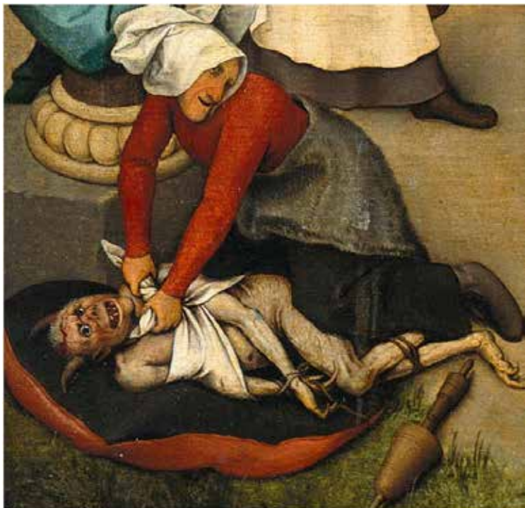
Чорт і баба. Геронім Босх