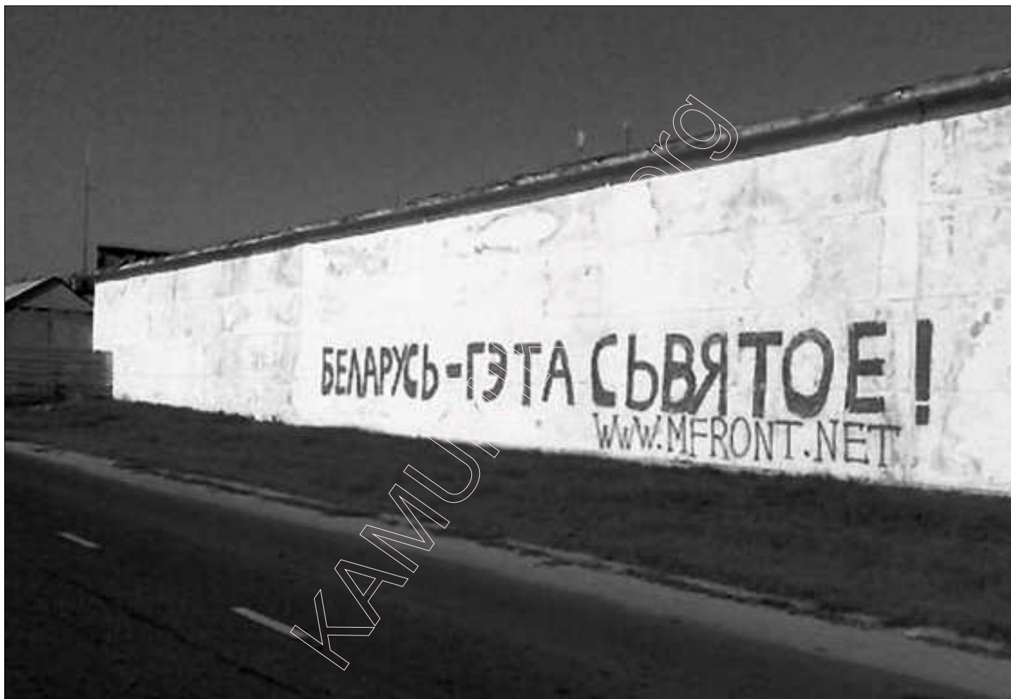
4. Надпіс на белай сьцяне. (Фота Даніка Нясвіскага).

Вітаю. Сусьветнай практыкай зьяўляецца стварэньне пры партыях моладзевых арганізацыяў. Падчас працы ў якіх маладыя людзі набіраюцца вопыту ў камунікацыях з іншымі групамі, арганізатарскага вопыту і г.д. Натуральна, што моладзі лягчэй асвоіцца ў сваім