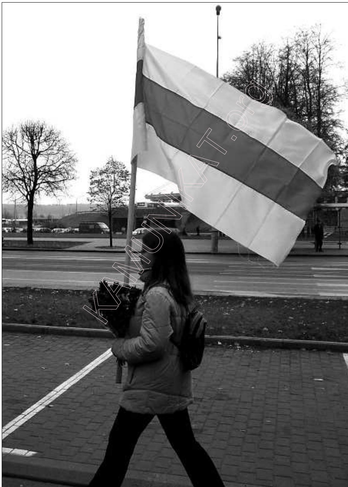
1. Нішто ля сьніць Беларусі.

НЬЮ-ЁРК – ВАРШАВА, верасень-сьнежань 2007 г.