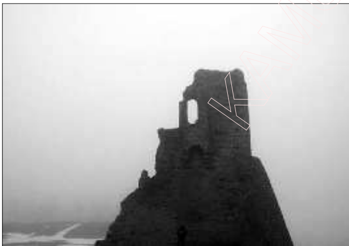
8. Вакно гісторыі.

На мітынгх выступалі намеснікі старшыні Фронту і Партыі Юрый Беленькі, Сяргей Папкоў, адказны сакратар Управы Фронту і Партыі Алесь Чахольскі. Была выказана ўдзячнасьць жыхарам вёсак Грозаў і Семежава за захаваньне і дагляд за крыжамі, якія ўсталяваныя ў памяць Случкіх Герояў. У прамовах выступаўцаў была адзначана, што для сучасных беларусаў, дарослых і моладзі, Случкі Збройнае Чыно зьяўляецца прыкладам змаганьня супраць расейскага імперскага акупанта. Гэта вельмі актуальна ў цяперашні час, калі гэбўска-пуцінскае імперскае хэўра вядзе эканамічную, сацыяльную і інфармацыйную вайну супраць нашай краіны. У Расеі мільёнамі вымірае няшчасны народ, жыруе толькі лубянская і алігархічная эліта. Там ужо няма каму пампаваць газ і нафту, працаваць на Поўначы і ў Сібіры, служыць ў іх варварскай арміі. Вось туды, за тысячы кілёметраў ад роднага дому, яны й зьбіраюцца накіраваць беларусаў, нашых работнікаў, інжынэраў, нашу моладзь. Змагарныя Случакі дакладна сьведчаць, што галоўны вораг беларусаў