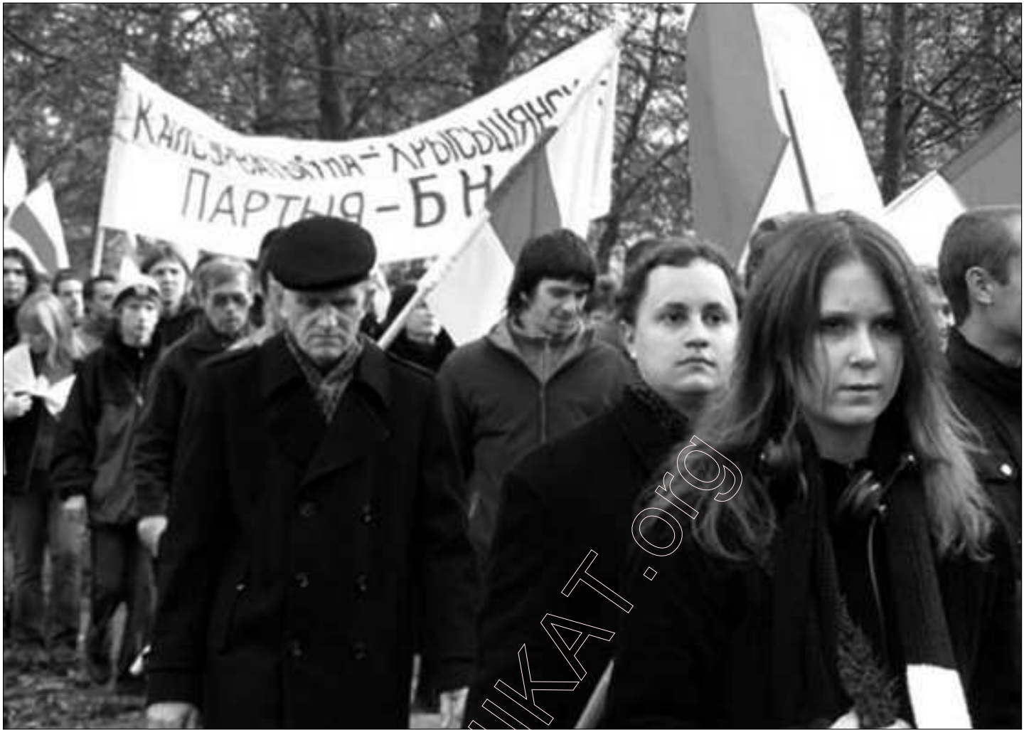
2. Дзяды-2007. Хаджэньне на Курапаты.

зыцця Мэмарыялу ўжо вызначылася, але кожны беларус, кожная сям'я можа паставіць тут свой крыж.