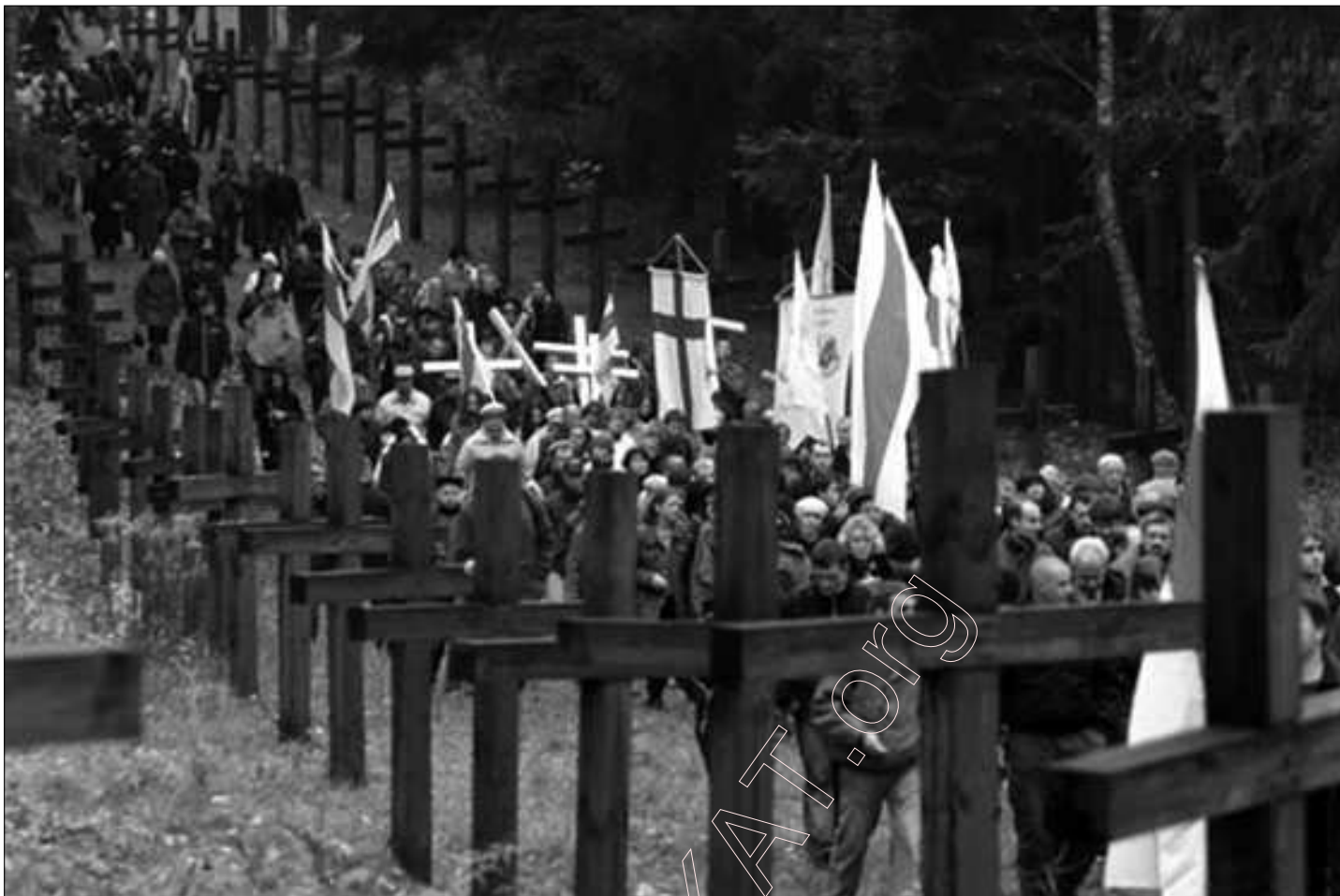
3. Крыжовае ішсьце. Народны Мэмарыял Куропаты.