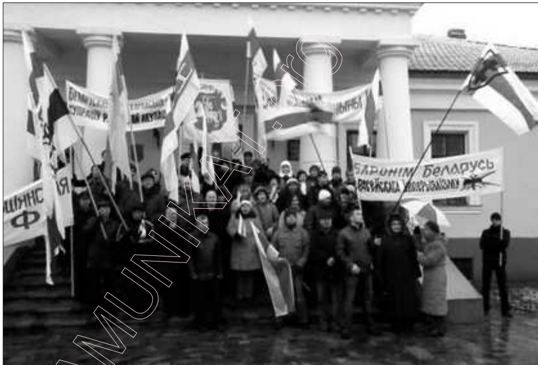
7. Група сяброў Кансэрватыўна-Хрысьціянскай Партыі – БНФ у Слуцку 25 лістапада 2007 г.

Арганізоўваючы свой „празднік”, рэжым нібыта прыгадаў гісторыю Менску. Але бітва на Нямізе і зьнішчэньне горада адбыліся ў сакавіку 1067 г., у люты холад. Раней антыбеларускі рэжым, каб выкрэсьціць з памяці народу Дзень Беларускай вайсковай славы 8 верасня, трубіў паўсюль, што 8 верасня трэба сьвяткаваць дзень пачатку ў 1941 годзе блакады Ленінграда. Прыцягненая за вушы чужая дата не прыжылася. Тады ненавісьнікі Беларусі вырашылі прыцягнуць за вушы эпізод з сакавіцкай трагедыяй 1067 года. На працягу двух дзён ракой лілася разліўная гарэлка і каньяк, на эстрадах сьпявалі расейскую папу і танцавалі, дзіка тупаючы нагамі. Пускалі ў неба фаервэркі. Постсавецкая публіка „отдыхала і праздновала”. Што ж сьвяткаваў рэжым унутранай акупацыі? Рэжым арганізаваў буйнамаштабную пьянку і сатанінскія скокі. „празднуя” угодкі разбурэньня нашага роднага горада і масавага забойства гараджанаў – нашых дзядоў.