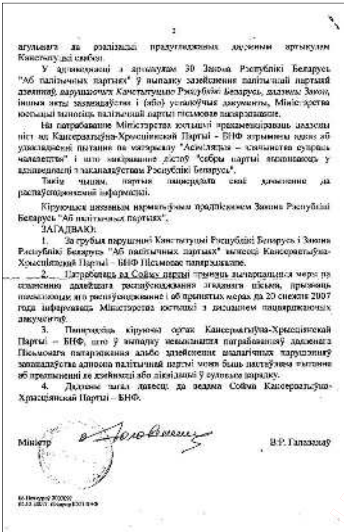
6. Загад Мініюста, стар. 2.

Міністэрства юстыцыі Кансэрватыўна-Хрысціянскай Партыі – БНФ не атрымала.