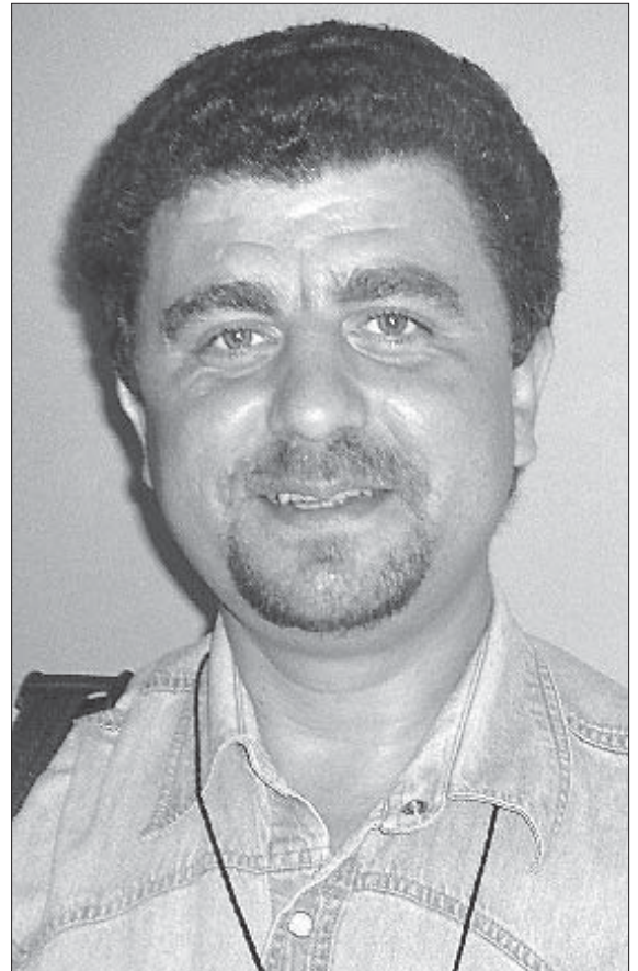
НЯГЛЕДЗЯЧЫ НА РЭПРЭСЫ, ЗьМІЦЕР НЯ СТРАЧВАЕ АПТЫМІЗМУ АДНОСНА ЭўРАПЕЙСКАЙ БУДУЧЫНІ БЕЛАРУСІ

А палове на першую ночы выйшаў на волю намеснік старшыні Магілёўскай суполкі Партыі