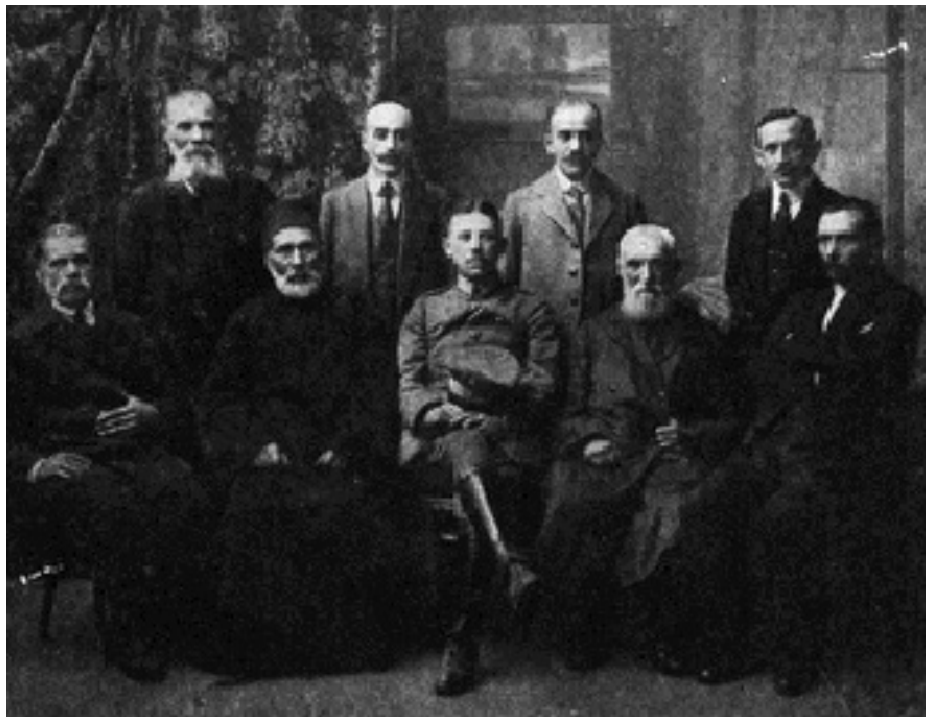
Слоні́мскае самакіраванне часоў нямецкай акупацыі

прывілеяў для буржуазных пластоў насельніцтва ў сэнсе развіцця гандлю, адкрыцця паасобных прадпрыемстваў і г. д. Самакіраванне гэтае было створана да моманту адыходу царскіх войск, за два тыдні да прыходу немцаў. Пры ім жа