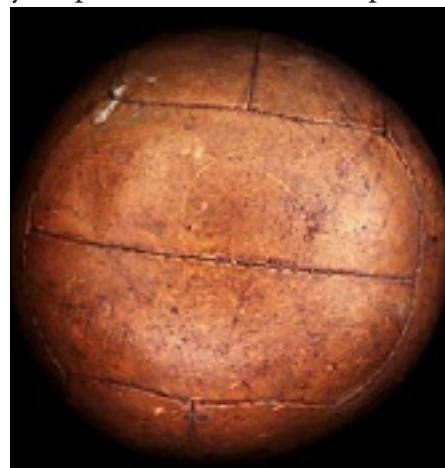
Футбольны мяч, 1934 год

У пачатку кастрычніка ў Слоніме праводзіўся тыдзень LOPP (Liga Obrony Powietrznej і Przeciwegazowej; Таварыства супрацьпаветранай і хімічнай абароны). У яго рамках на гарадскім стадыёне прайшлі два футбольныя матчы — у панядзелак, 1-га і ў суботу, 6-га кастрычніка. У першым паядынку Strzelec прайграў WKS (нумар палка ў газетнай публікацыі не пазначаны) — 2:5 (1:1). “Стральцы” адкрылі лік у першым тайме і выйгравалі