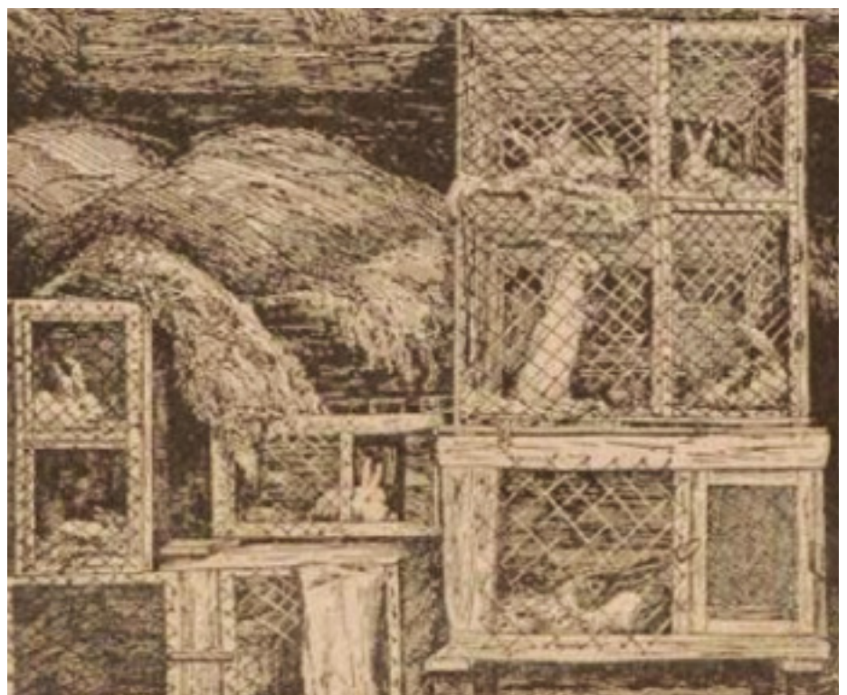
Салдацкая трусіная ферма падчас Першай сусветнай вайны, верагодна, у Слоніме. Малюнак Вальтэра Фэста быў апублікаваны ў “Ваеннай газеце ў Баранавічах” (1917, № 65, 15 жніўня)

Жанчыну вызвалілі, яна атрымала неабходную дапамогу. Ці атрымаў пакаранне сужыцель, невядома.