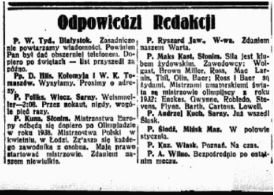
Адказы на пытанні слонімцаў у варшаўскай газеце

Высвятляецца, што ў 1934-м у Слоніме былі, як мінімум, два чытачы варшаўскага “Спартыўнага агляду” (“Przegląd Sportowy”). У адным з нумароў