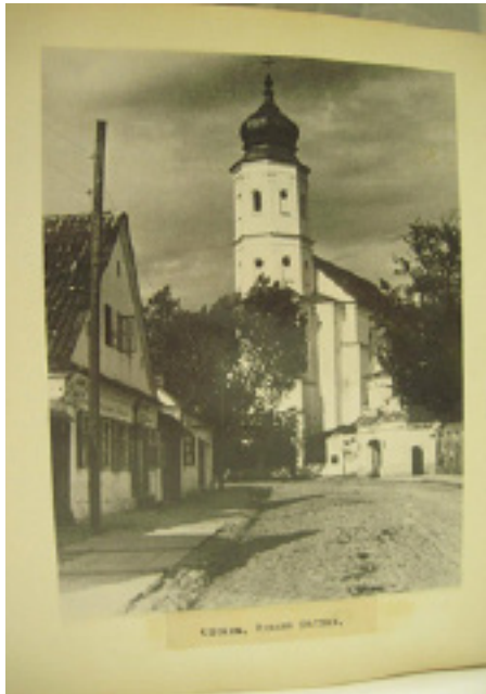
Памылковы подпіс у музеі: “Слонім. Будынак ратушы”