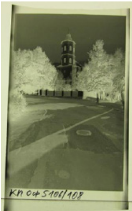
Свята-Троіцкі сабор у Слоніме. 1970-1980-я гады.