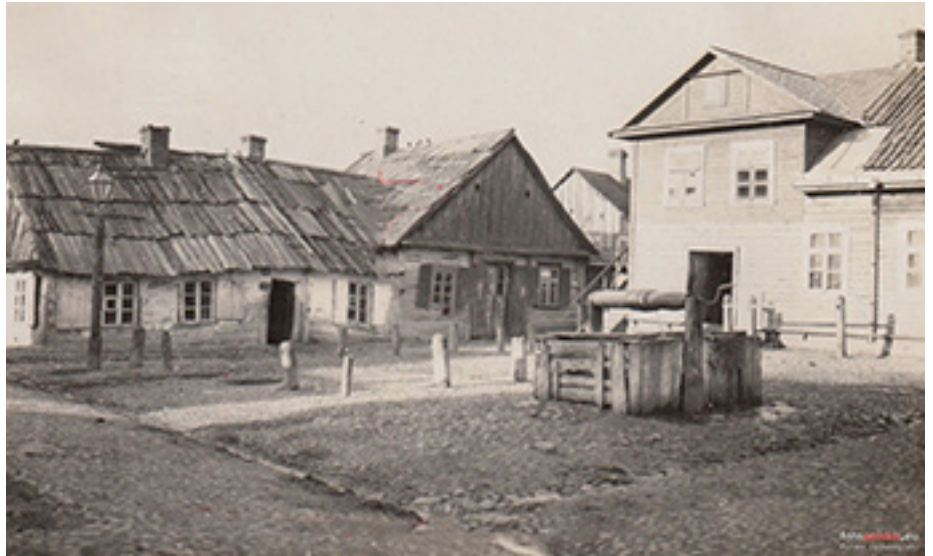
У Слоніме дамы стаялі вельмі шчыльна

11. Пакоі для распрання і мэбля ў іх павінны быць пастаянна чыстыя; бялізна, як