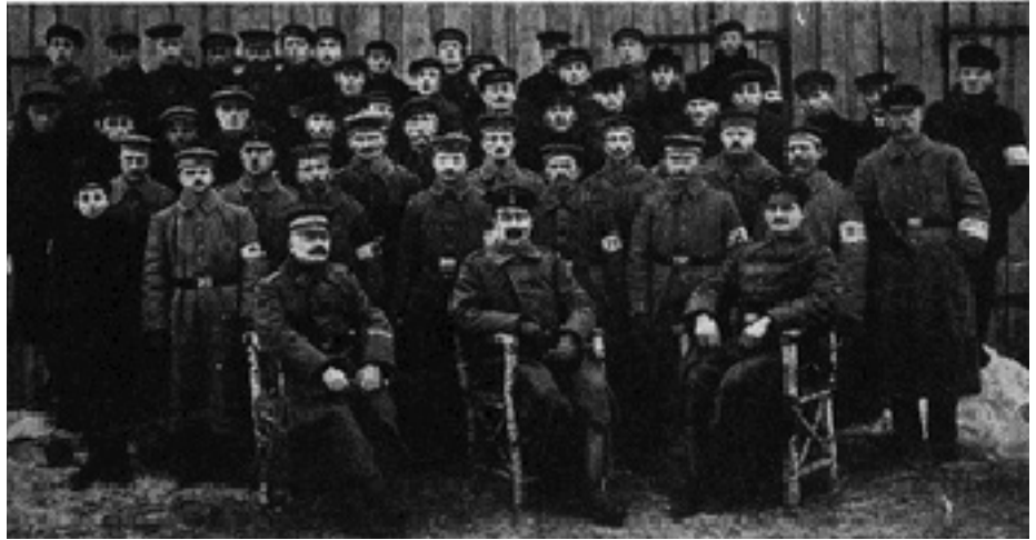
Удзельнікі народнай міліцыі ў Слоніме

Лютаўская рэвалюцыя і ўтварэнне ў Расіі Саветаў рабочых і салдацкіх дэпутатаў унесла яшчэ большае ажыўленне ў пачатую працу. Але адначасна ажывілі сваю дзейнасць старыя дробнабуржуазныя арганізацыі Бунд, Паалей-Цыён і іншыя, і адразу вызначыліся дзве асноўныя плыні. Адна лічыла, што пазбаўленне ад жахаў вайны, і ў тым ліку ад нямецкай акупацыі, павінна прыйсці шляхам пераможнага наступлення “рэвалюцыйнай” рускай арміі (гэта армія Часовага ўраду і Керанскага) супраць нямецкай арміі, што змусіць апошнюю на заключэнне дэмакратычнага міру без анэксій і кантрыбуцый. Да гэтага ў асноўным зводзіўся пункт гледжання ўсіх арганізацый меншавіцкага кірунку. Другая плынь, так званая левая група, якая складалася з двух-трох таварышаў, якія лічылі сябе бальшавікамі, з паасобных максімалістаў, левых бундаўцаў і групы беспартыйных рабочых, абараняла пазіцыю няўхільнасці другой рэвалюцыі ў Расіі, калі ва ўлады сапраўды стануць Саветы рабочых і салдацкіх дэпутатаў, якія даб’юцца безадкладнага сканчэння імперыялістычнай вайны. Адсюль задача вядзення агітацыі сярод нямецкіх салдат за хутчэйшую перамогу рэвалюцыі