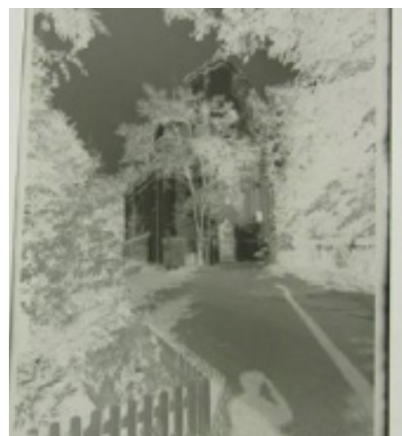
Праваслаўныя храмы ў Жыровічах. 1970-1980-я гады. Чорна-белыя негатывы.