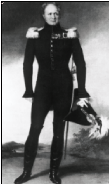
Імператар Расеі Аляксандр I (1801-1825).