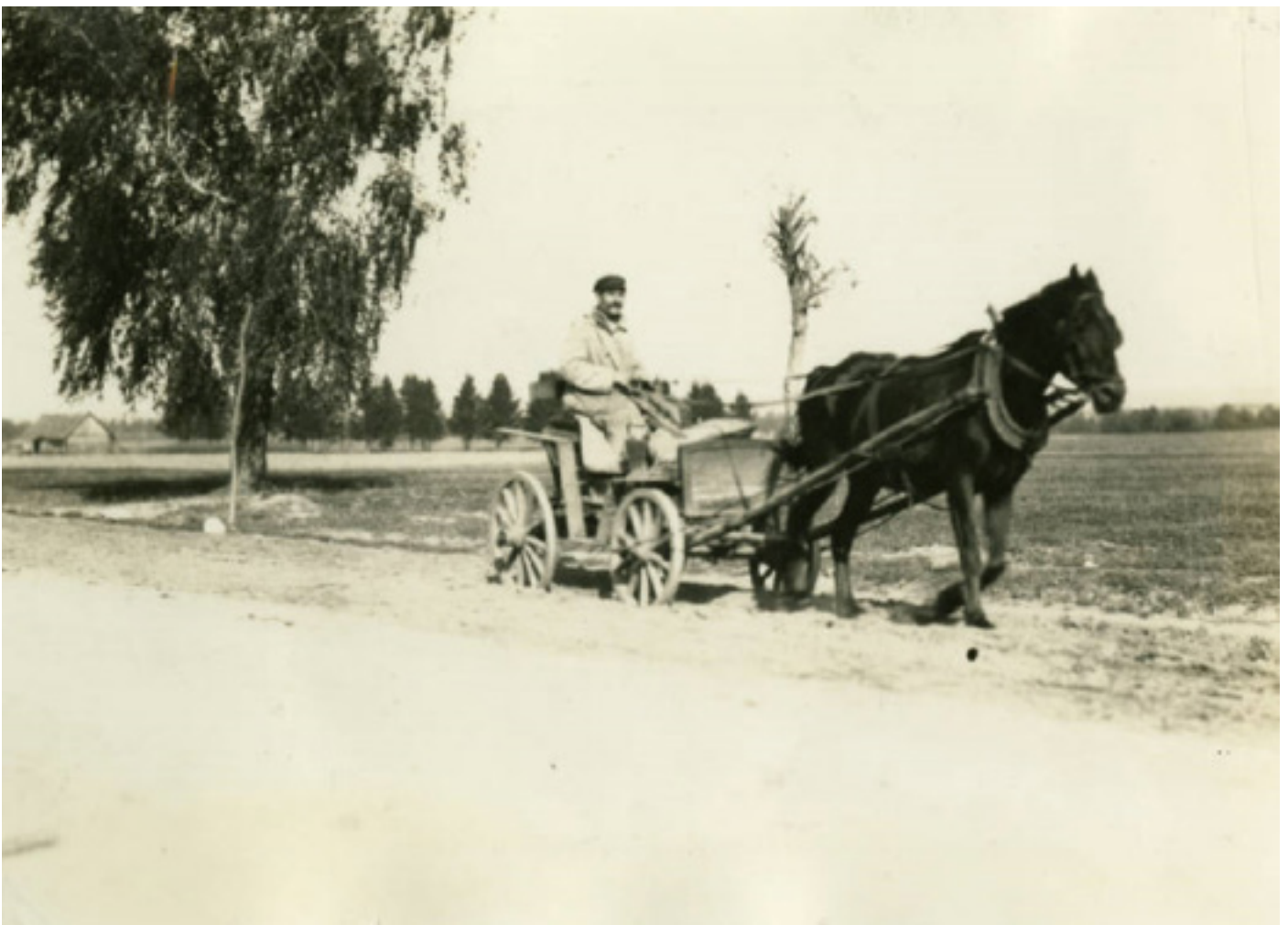
Яшчэ адзін здымак, зроблены паміж Слонімам і Жыровічамі