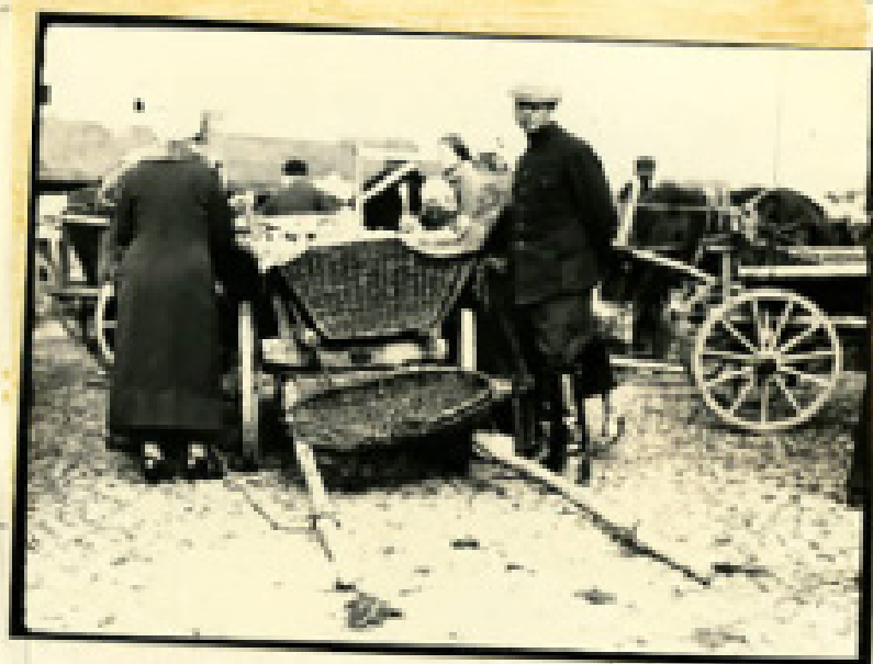
Fig No. 425