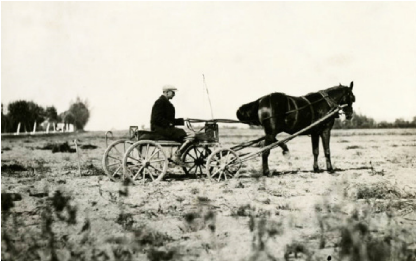
Упраўляючы маёнтка Пуслоўскіх. Луіза Бойд піша, што яго фурманка вельмі зручная — лёгкая і хуткая. Яна зрабіла фота дзесьці паміж Слонімам і Жыровічамі