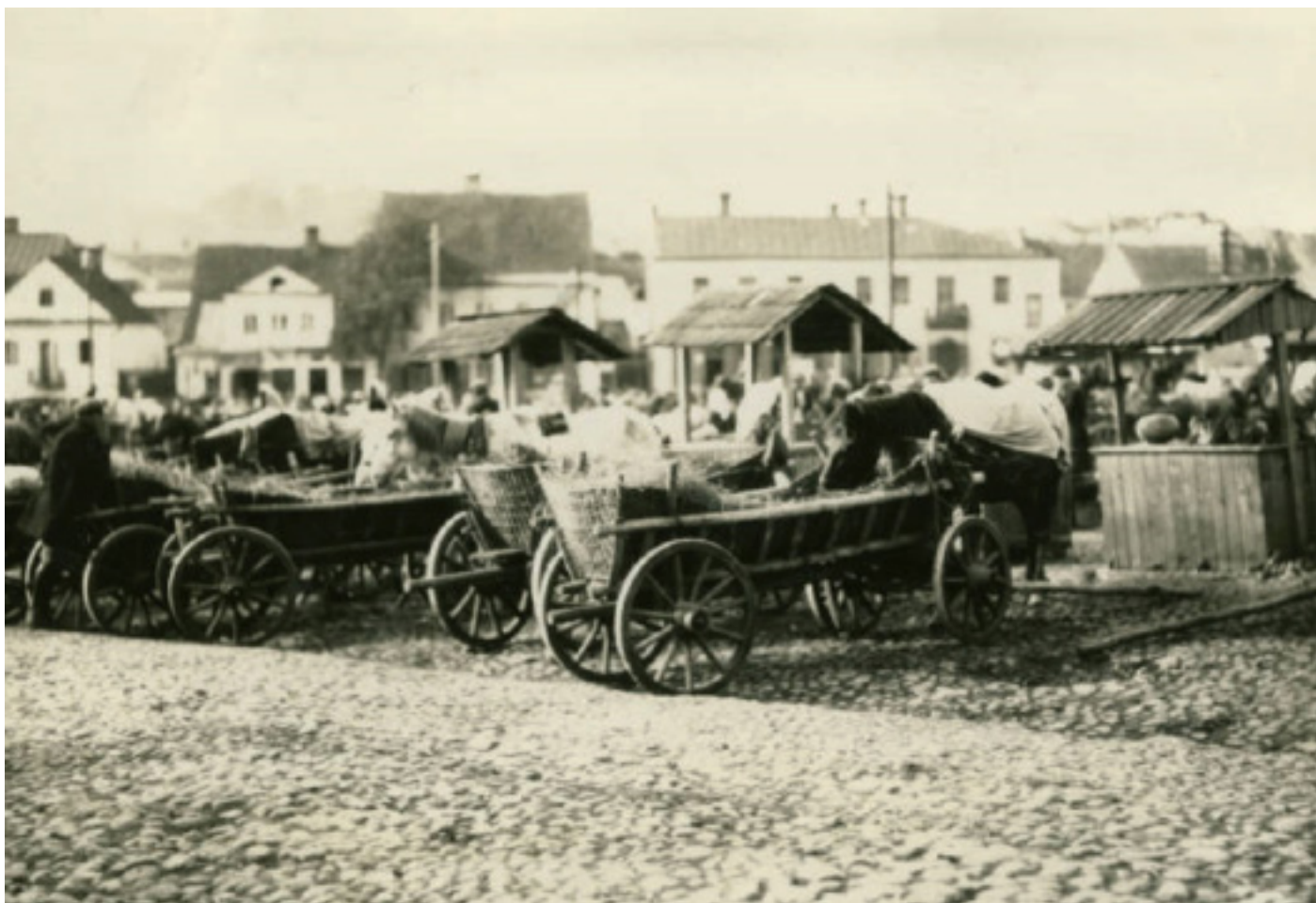
На рынку ў Слоніме