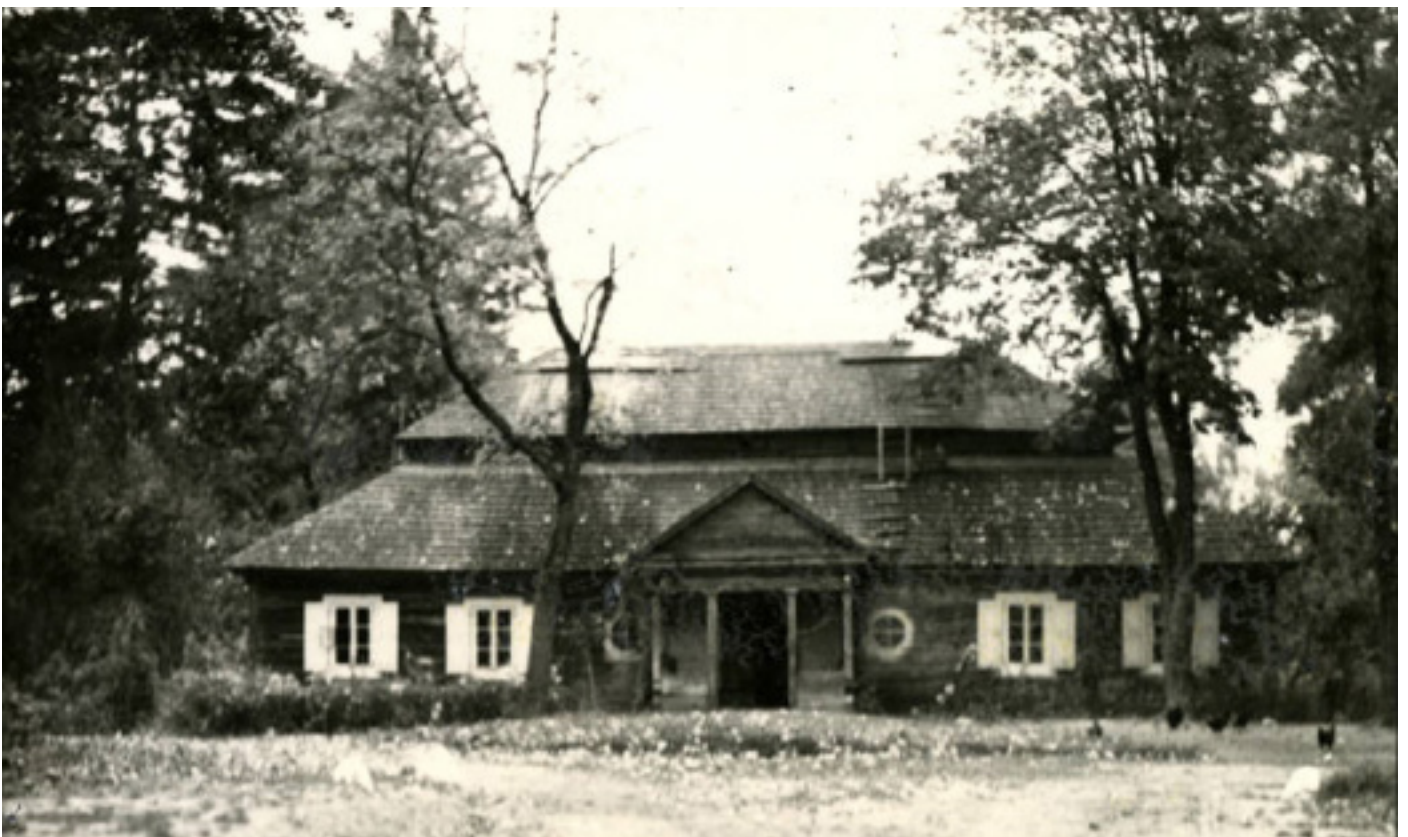
Дом у Марачоўшчыне (Мерачоўшчыне), дзе нарадзіўся Тадэвуш Касцюшка