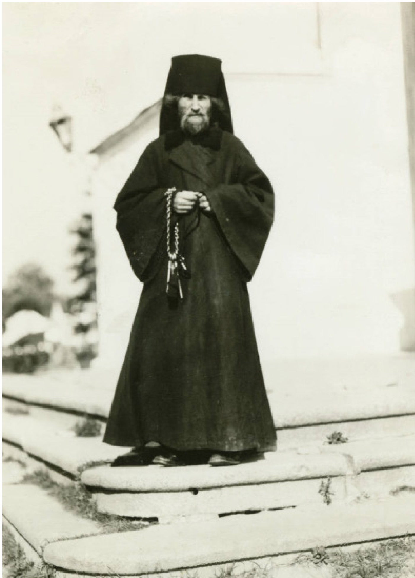
Манах каля сабора ў Жыровічах