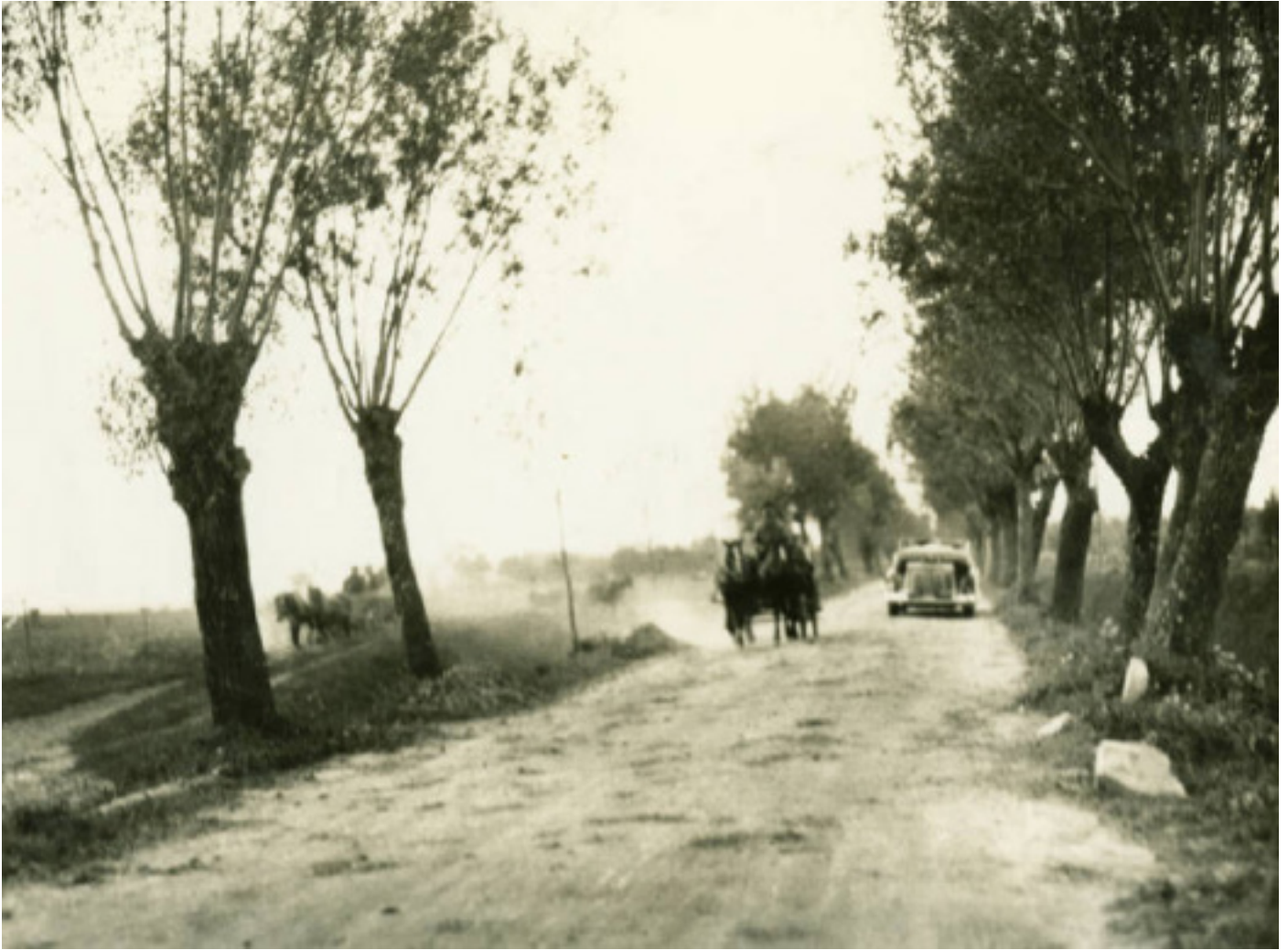
“Пакард” на дарогах палохаў і людзей, і коней. У прэсе міжваеннага часу часта можна сустрэць паведамленні пра здарэнні, калі і ў Слоніме, і ў наваколлі коні палохаліся аўтамабіляў, кідаліся ў бок, перакувалі вазы. Бойд таксама бачыла, як коні ўцякалі з дарогі, пабачыўшы “Пакард”