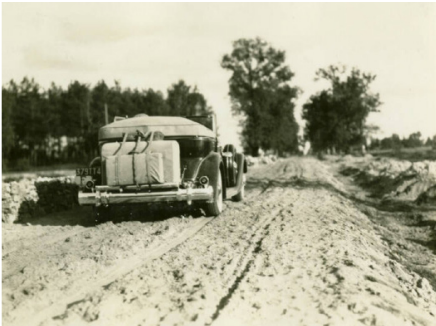
Аўтамабіль Луізы Бойд на палескай дарозе

па Палессі. Амерыканка заязджала і ў яго Косава, зрабіла некалькі здымкаў і ў мястэчку, і ў наваколлі. У яе, дарэчы, былі два выдатныя фотаапараты. Здымкі з экспедыцыі яна надрукавала ўжо пасля вяртання ў Злучаныя Штаты.