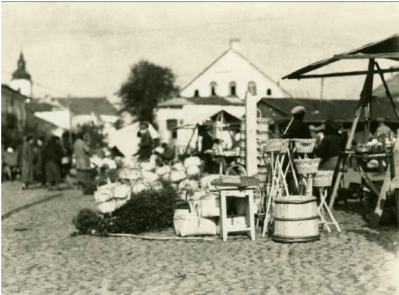
Слонім, Гандлёвая плошча, 9 кастрычніка 1934 г. Ідзе гандаль разнастайнымі кошыкамі

У аўторак, 9 кастрычніка 1934 года, у Слонім на аўтамабілі “Пакард” з боку Баранавічаў прыехала амерыканка Луіза Арнэр Бойд (1887 — 1972). Адна з самых багатых жанчын ЗША была вядомай падарожніцай — даследавала Арктыку, Грэнландыю. Дагэтуль невядома, хто ёй распавёў пра Палессе. Ці яна пра яго дзесьці прачытала? У любым разе Бойд захапілася ідэяй там пабываць.