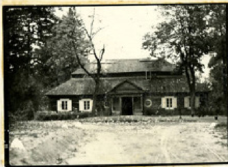
Fig. 14 9