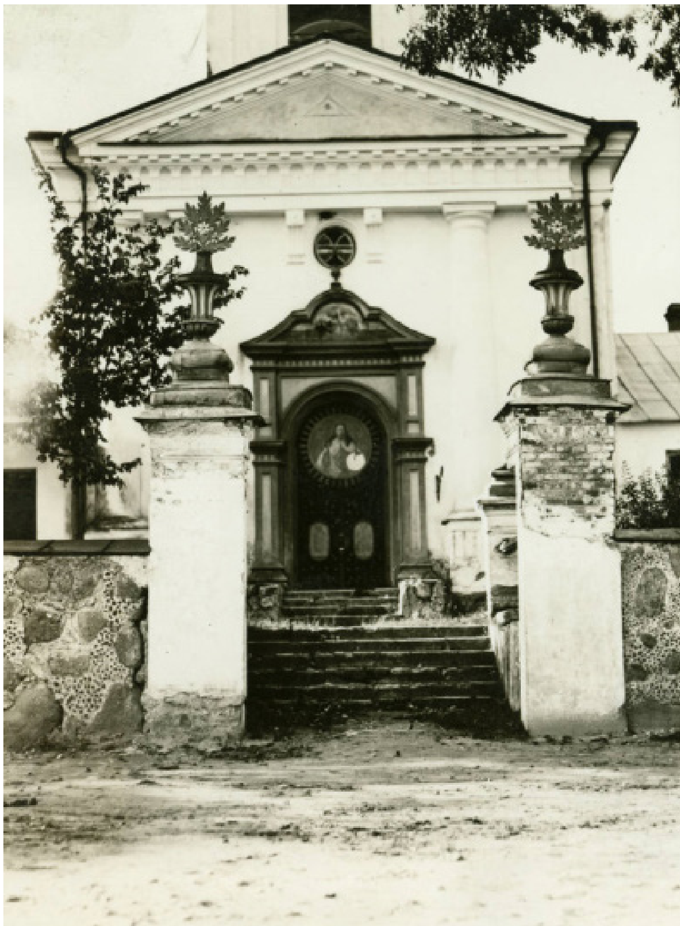
У Жыровічах Луізе Бойд расказалі пра гісторыю праваслаўнай святыні. У сваіх нататках яна зрабіла шмат памылак. Напрыклад, напісала, што гэты храм пабудаваны ў канцы XV стагоддзя