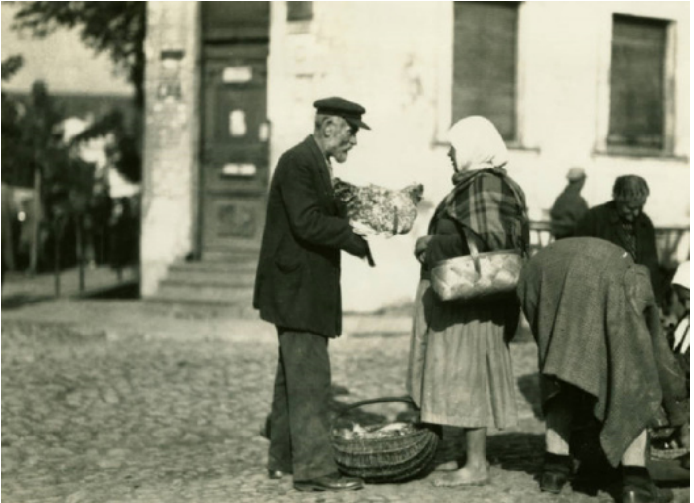
Працяг, пачатак на ст. 1-3.