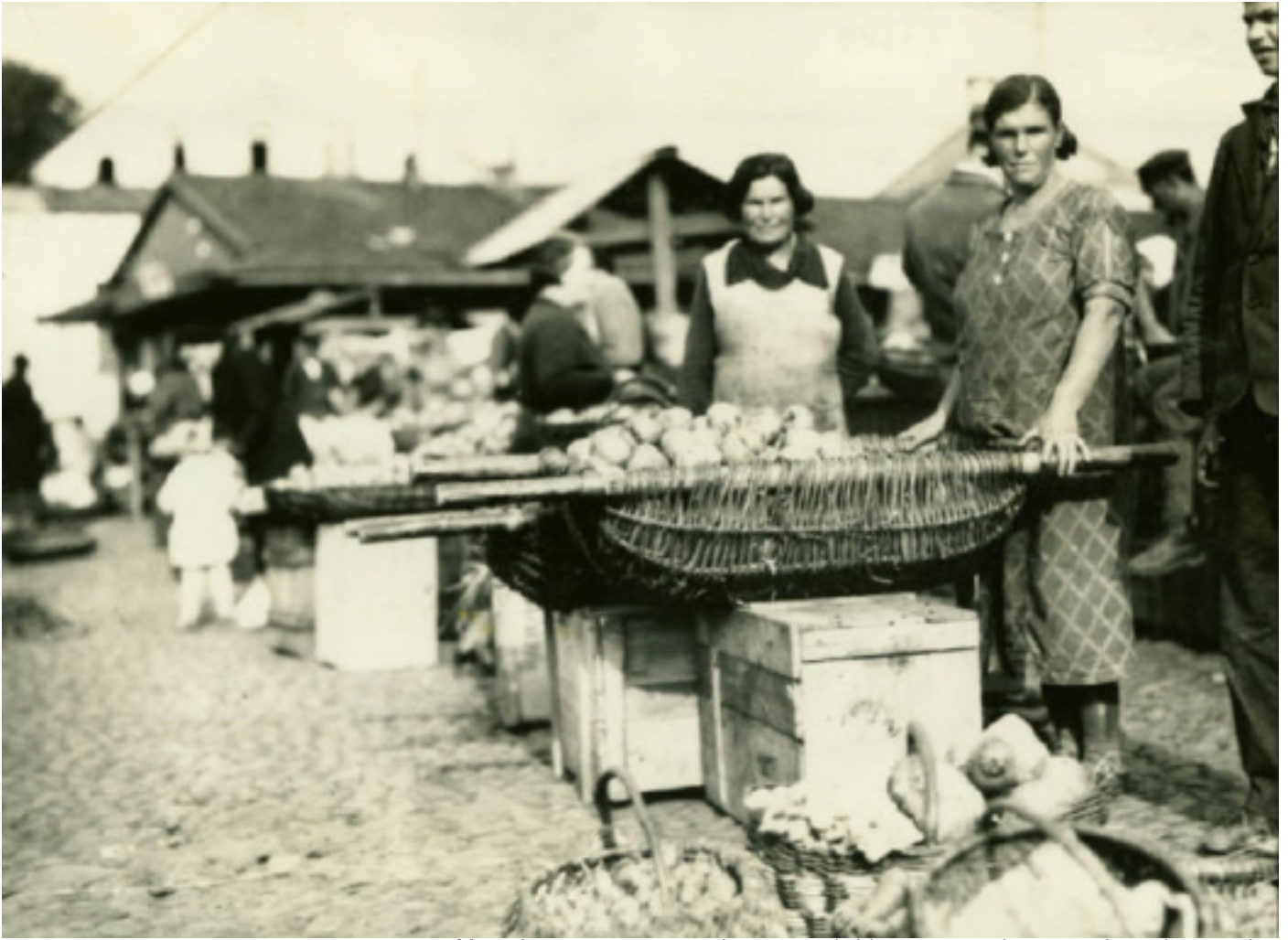
У такіх плеченых насілках насілі і прадавалі гародніну ці садавіну