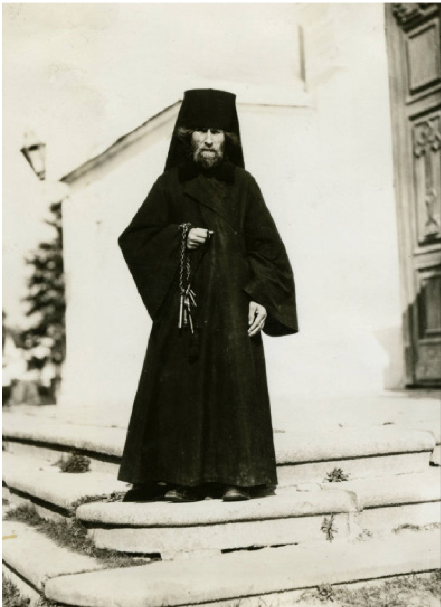
Луіза Бойд наведала Жыровічы 9 кастрычніка 1934-га. На двух фота — манах са звязкай ключоў каля сабора. Амерыканка адзначае, што ў манастыры на той час жылі 6-8 манахаў