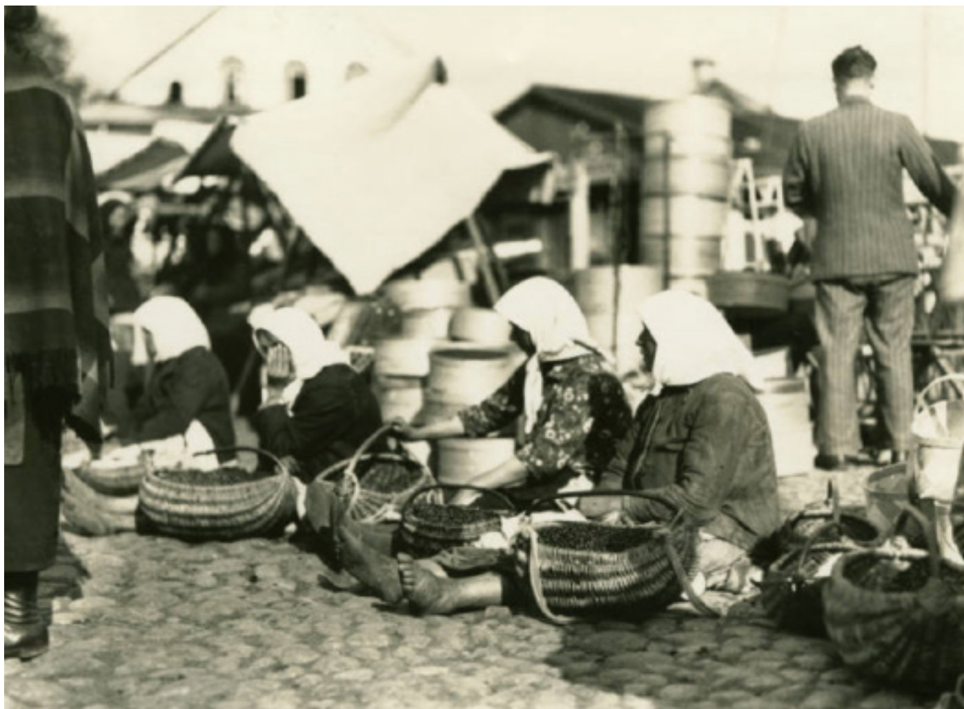
Жанчыны прадаюць на слоні́мскім рынку ягады, сабраныя ў лесе