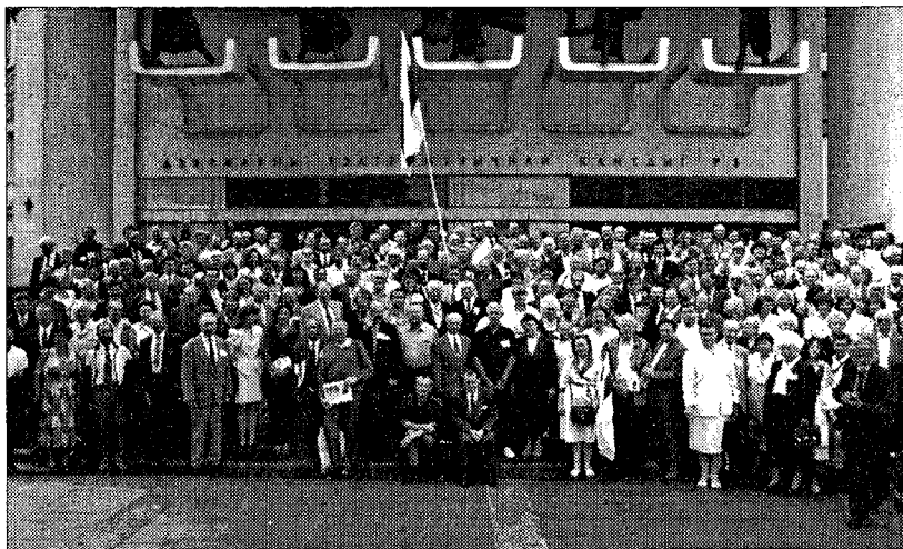
Жывом! Будам жыць! Удзельнікі Другога зьезду беларусаў сьвету «Бацькаўшчына». Менск, 1997.