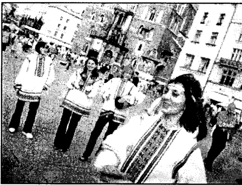
Пружанска-Шарашоўскі вакальны ансамбль "Атава" вельмі добра сябе адчувае на вуліцах Кракава.