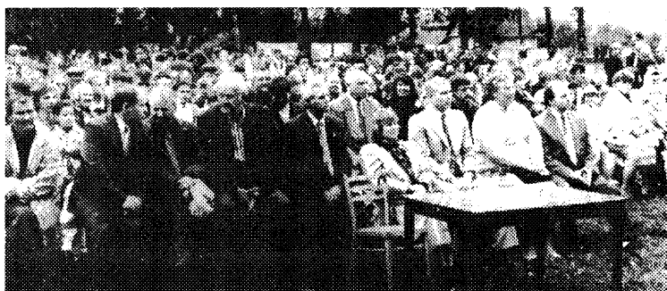
(Закачэнне. Пачатак на 2-й стар.)

На сцэну запрашаюцца госці свята... У сваіх прамовах кожны пічыра выказае сваё стаўленне да паэта. Я. Э. Аляхавіч зазначыў, што "... імя Яна Чачота называецца ў першым радзе сярод тых, хто стаў ля вытокаў беларускага нацыянальнага Адраджэння. На радзіме Яна Чачота добра ведаюць яго творы, ён прывіваў іх сваёму народу... На Карэліччыне ўшаноўваюць памяць вядомага паэта і фалькларыста. 15 чэрвеня адбылася традыцыйная карэліцкая навуковая чытанні, у гарпасёлку Карэліччы ўстаноўлены бюст, адна з вуліц у вёсцы Малышчыцы, мясцовая сярэдняя і Карэліцкая музычная школы будуюць насіць імя Яна Чачота..."