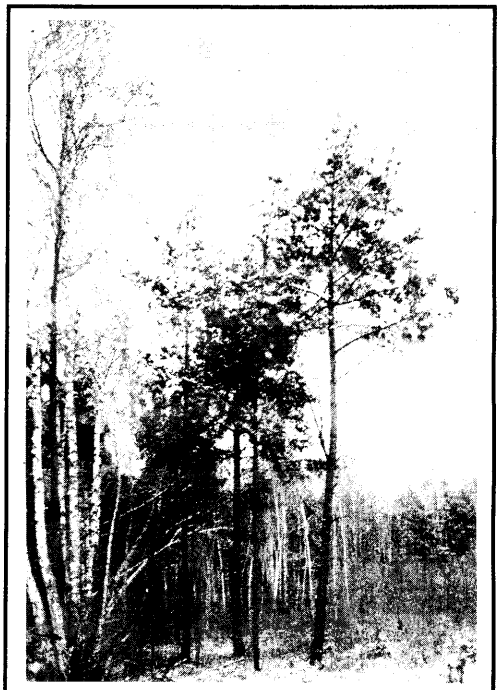
Надвор'е сёлетняй зімой зменлівае: то снег ідзе, то дождж...