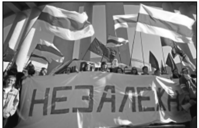
Дзень Волі - 2007

Акрамя масавай акцыі, паводле ўдзельнікаў аргкамітэту, прадугледжваецца шэраг іншых мерапрыем-