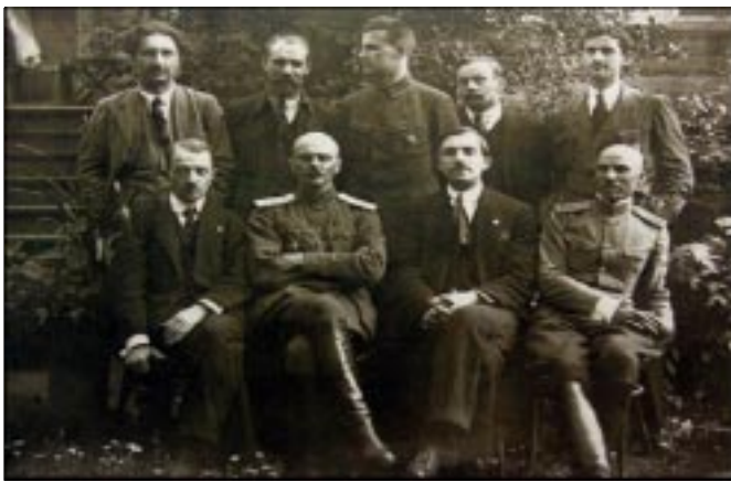
Першы ўрад БНР - Народны Сакратарыят: (зьлева направа, сядзяць) Алесь Бурбіс, Іван Серада, Язэп Варонка (старшыня), Васіль Захарка; (стаяць) Аркадзь Смоліч, Пётра Крэчэўскі, Кастусь Езавітаў, Антон Аўсянік, Лявон Заяц

25 Сакавіка Беларусь сьвяткуе 90-ю гадавіну з дня абвяшчэння незалежнасці Беларускай Народнай Рэспублікі.