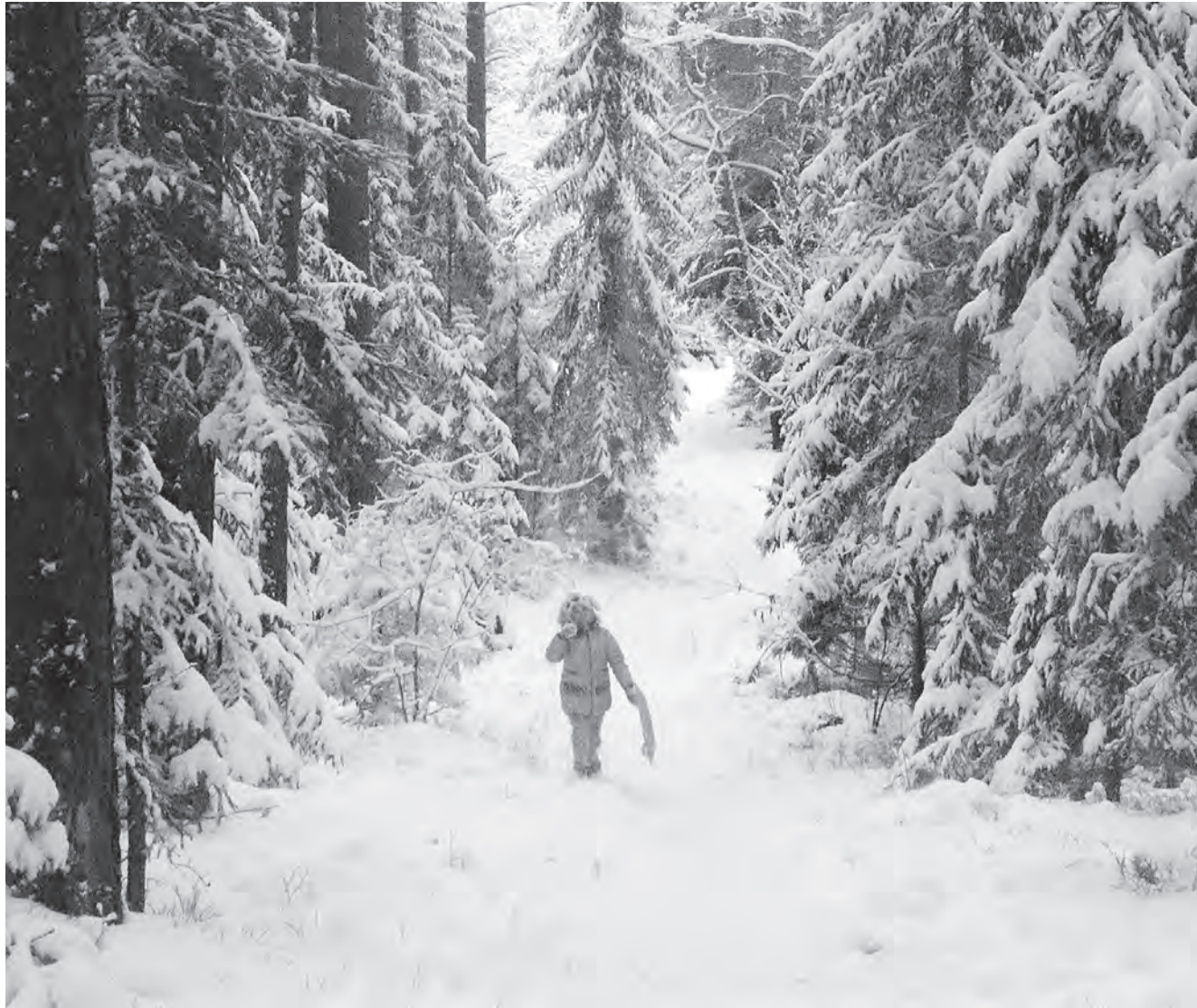
У лесе на Вілейшчыне.