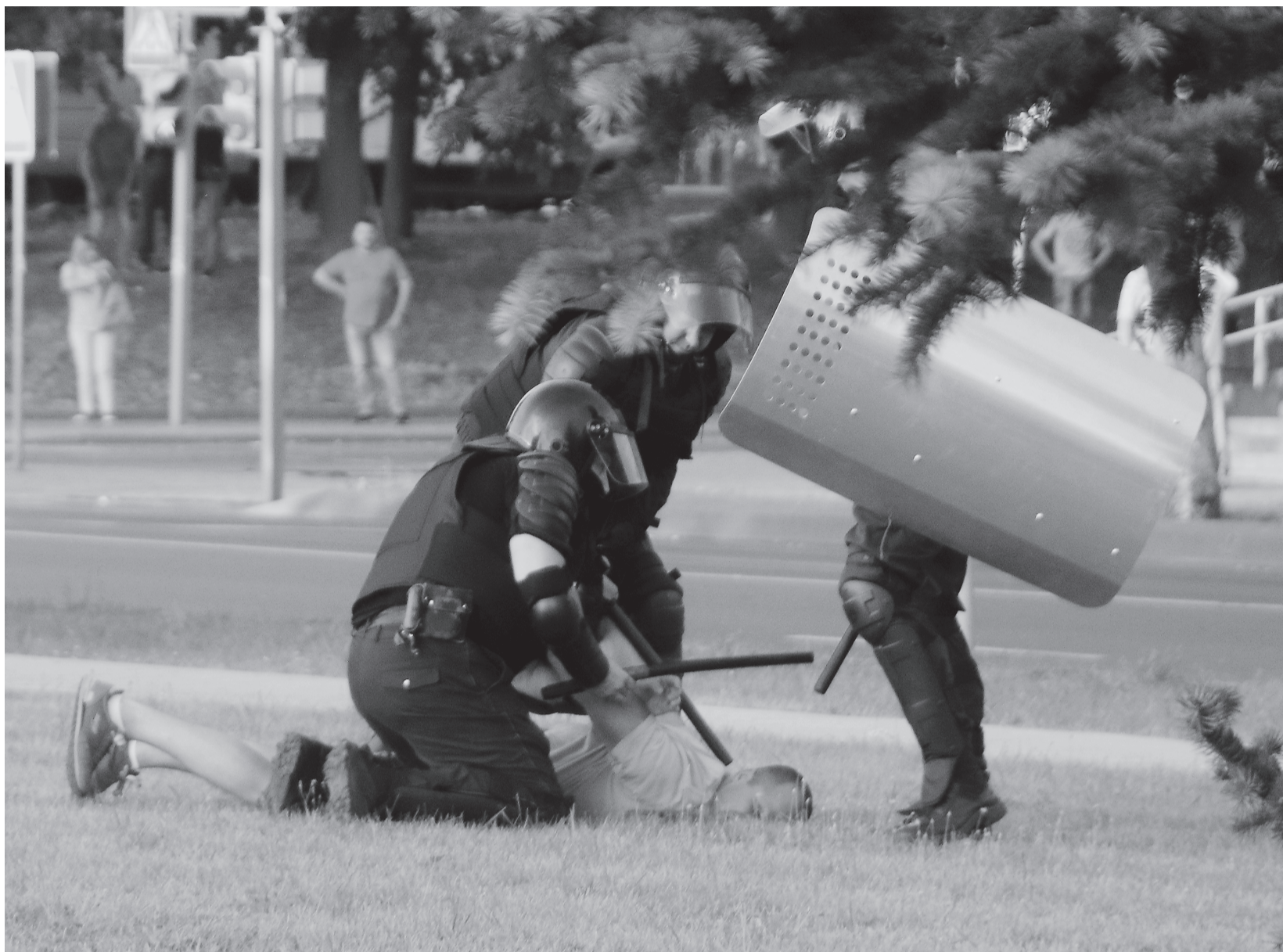
Затрыманне падчас пратэснай акцыі ў Маладзечне 10 жніўня 2020.

вязках затрыманага; – парушаюць максімальны тэрмін адміністрацыйнага затрымання без вызначаных законам падстаў для гэтага;