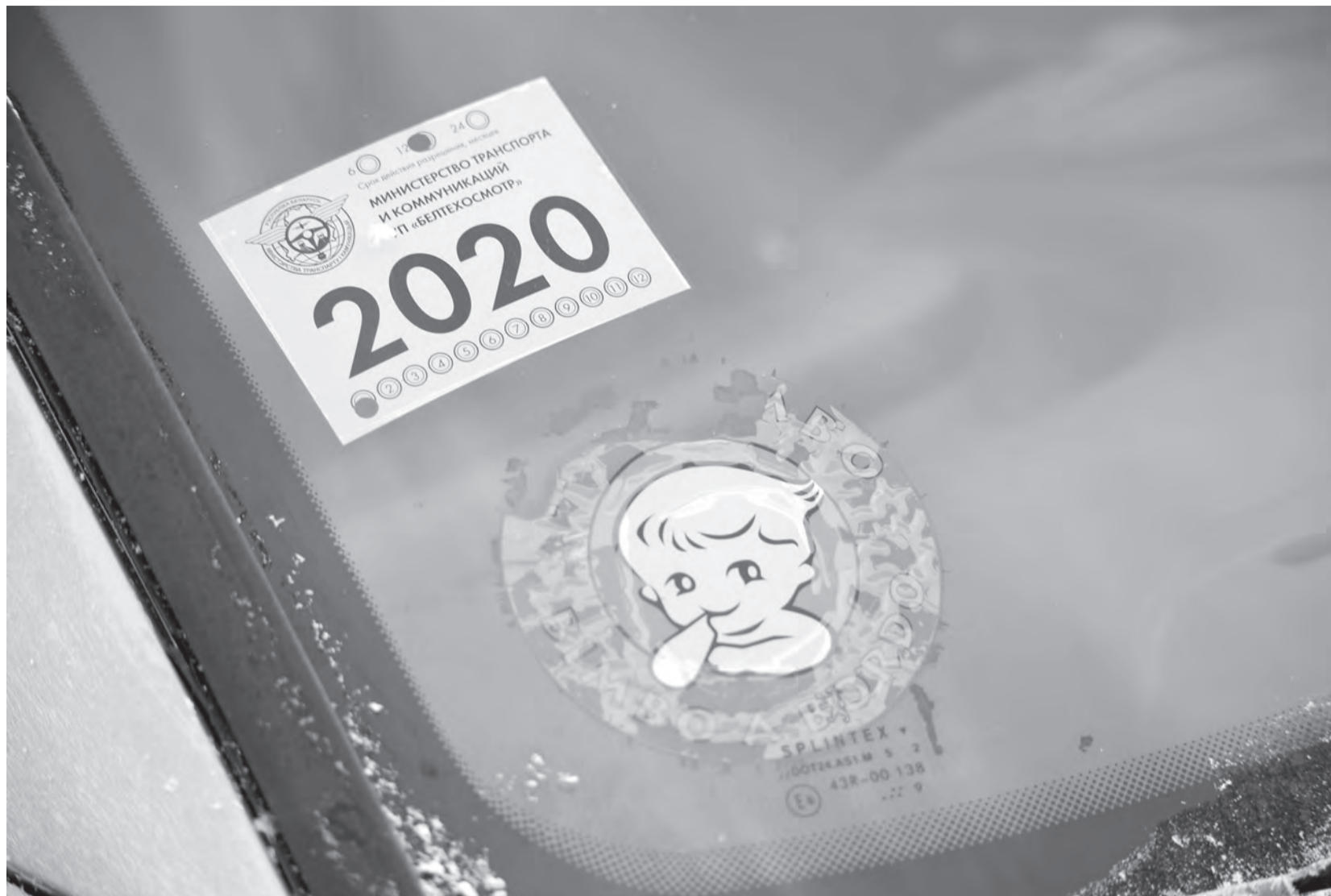
Што важна ведаць аўтааматарам пра тэхагляд, расказвае прадстаўнік «Белтэхагляду».

Кодэкса аб адміністрацыйных правапарушэннях, кіраванне транспартным сродкам без дазволу на допуск да ўдзелу ў дарожным руху цягне папярэджанне або штраф у памеры ад адной да трох базавых велічынь.