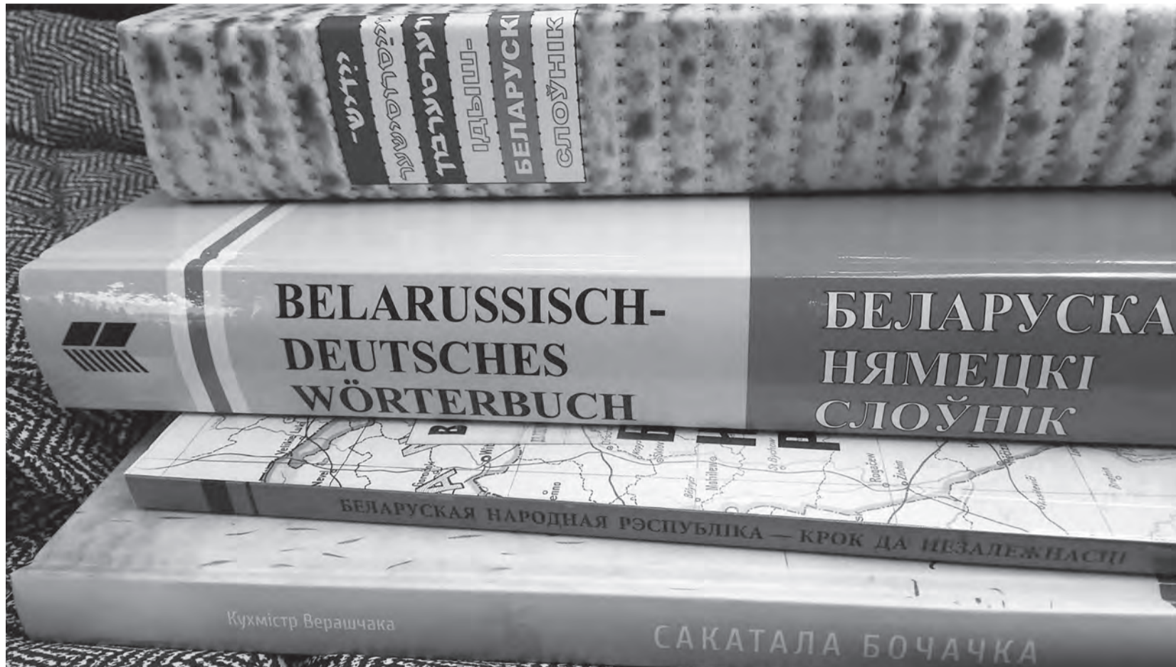
Лінгвісты сцвярджаюць, што словы нямецкага паходжання ў параўнанні з іншымі запазычаннямі найбольш трывала захоўваюцца ў сучаснай беларускай мове.

Найбольш германізмаў да 15-19 стагоддзяў прыходзіла да нас праз польскую мову, бо ў другой палове 16-18 стагоддзяў беларускія землі знаходзіліся ў складзе Рэчы Паспалітай. Нямецкія словы запазычваліся беларускай мовай часам ужо ў