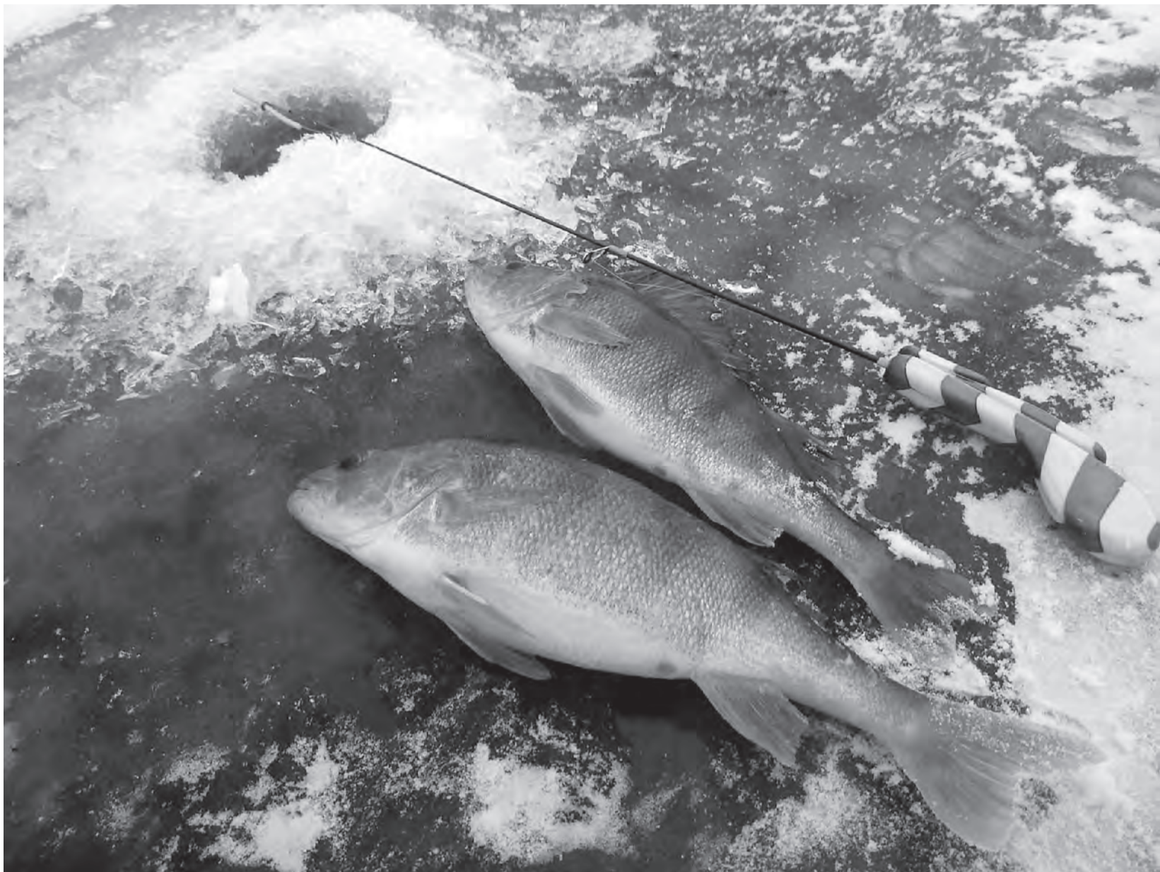
Гэта рыба здабытая законна. Але так бывае не заўсёды.

Людзей, якія ловяць рыбу незаконна і захоўваюць забароненыя прылады для рыбнай лоўлі, прыцягнулі да адміністрацыйнай адказнасці. Яны атрымалі штраф ад пяці да пяцідзiesiąці базавых велічынь. Летась гэтыя сумы складалі ад 135 да 1350 рублёў. Сёлета