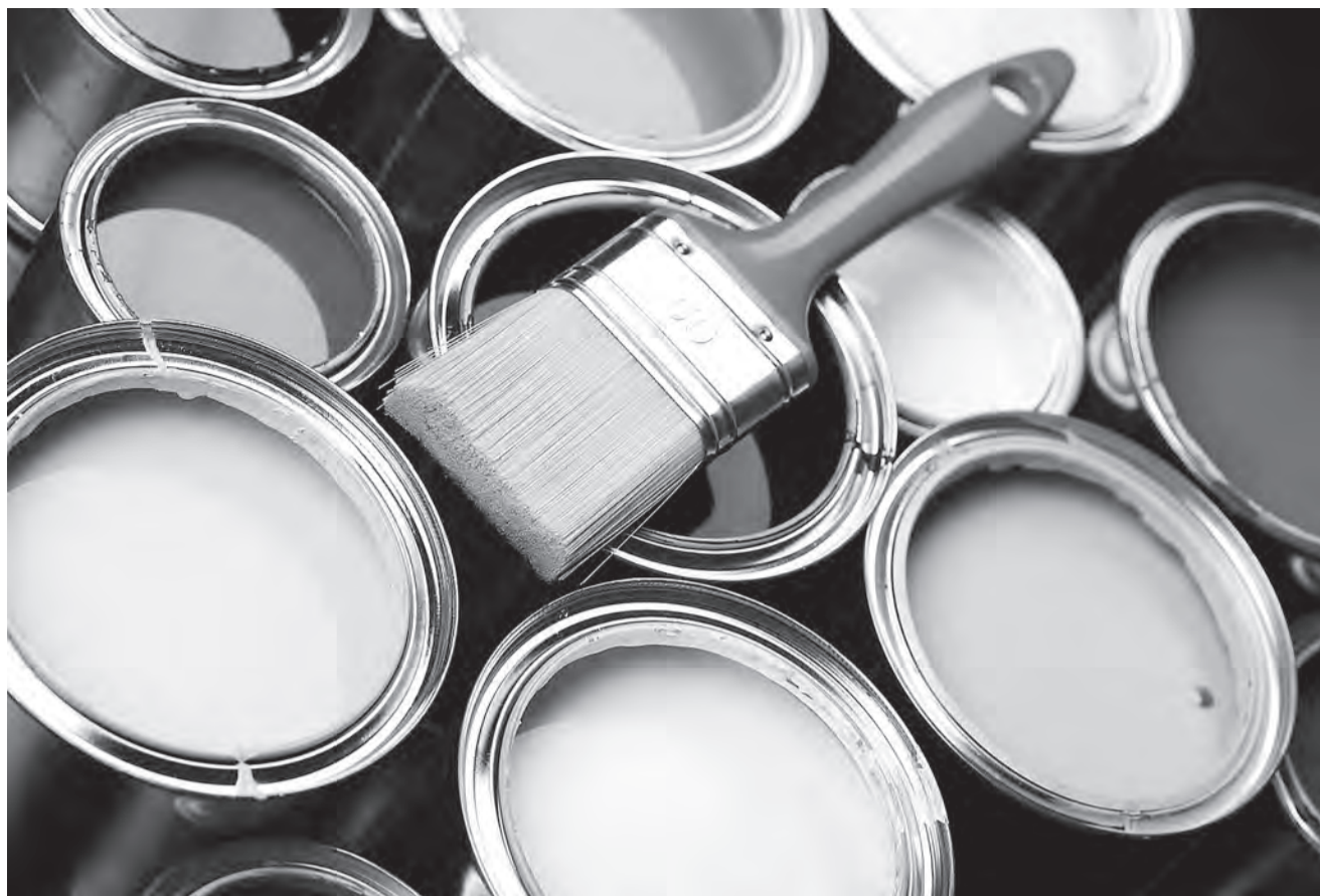
Фарбу, каб абліць саперніка, пакрыўджаны муж знайшоў у кватэры.