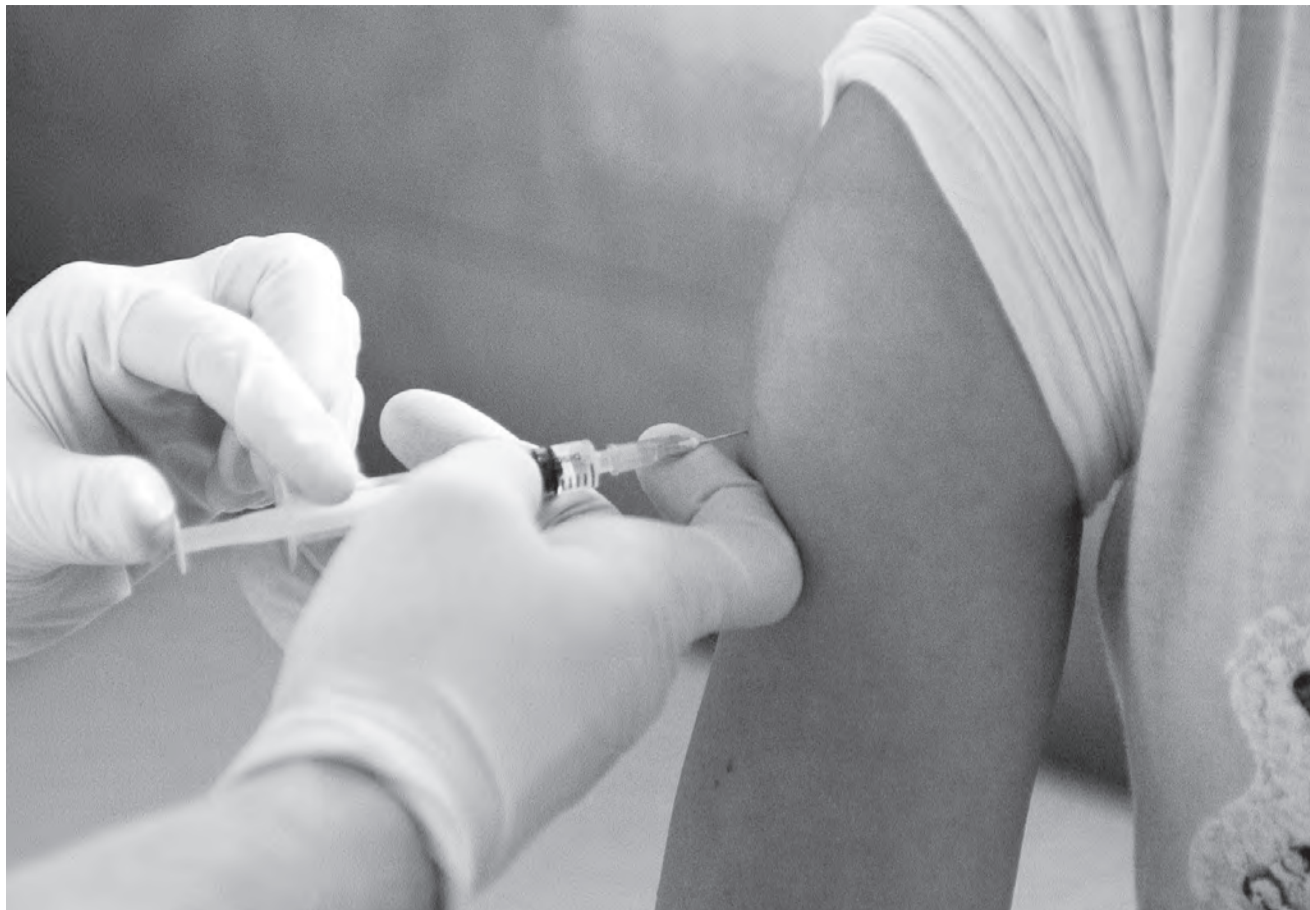
Каб правесці працэдуру правільна, вілейскі медперсанал праходзіў вучобу.