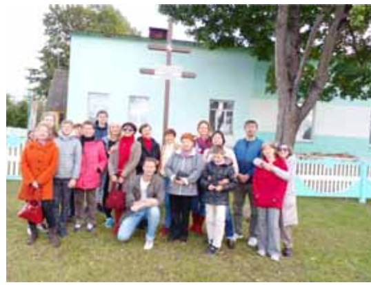
Грозава, каля крыжа паўстанцам

Мясціна Грозава - вялікае паселішча. На цэнтральным пляцы захавалася некалькі дарэвалюцыйных будынкаў, якія былі