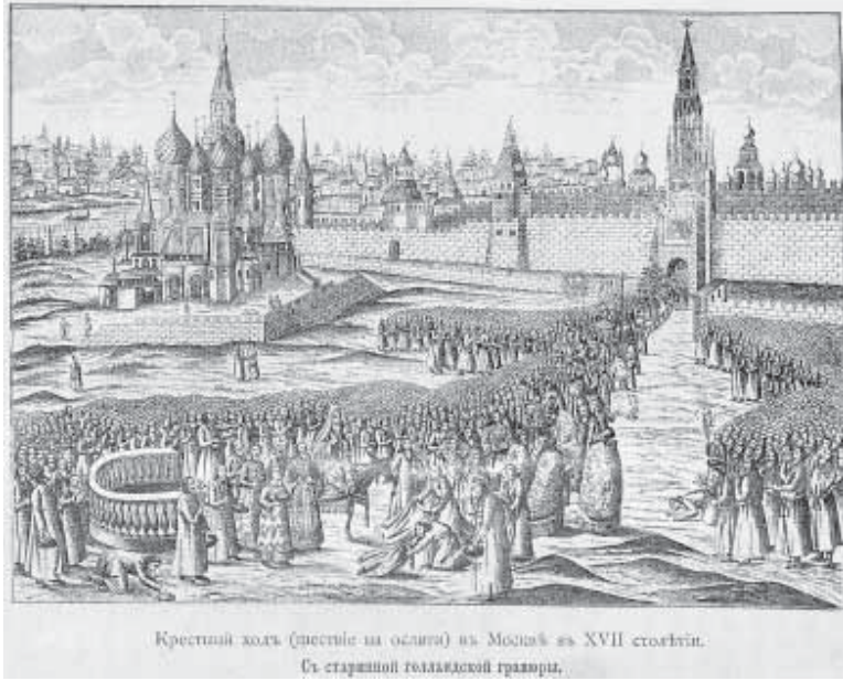
Крэмынскі адрэзак (фрагмент ад асцяго) з Масквы ў XVII ст. Гравюра па старажытнай голандскай гравюры.

У 1480 г. з'явіўся рэальны вораг ВКЛ на ўсходзе - Вялікае Княства Маскоўскае. Усё гэта актывізуе мураванае абарончае дойлідства, якое прыстасоўваецца да новай агняпальнай зброі. Будуюцца інкастэляваныя абарончыя храмы розных канфесій.