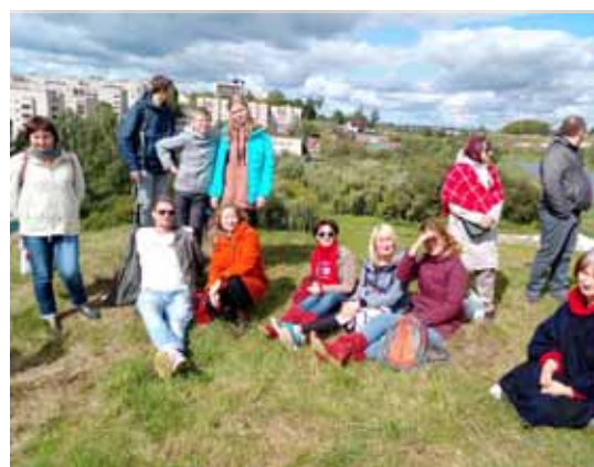
Капыль, на Замкавай гары

У Капылі першай справай мы... узялі штурмам Замкавую гару. Давялося сапраўды няпроста на стромкую вышыню ўзбірацца, адкуль адкрываюцца прыгожыя краявіды гарадка. Затым пашпацыравалі ў цэнтр горада, дзе адбывалася святкаванне Дня пісьменства. На свята гэтае магілёўцы наведваюцца штогод, і кожны з нас знаходзіць