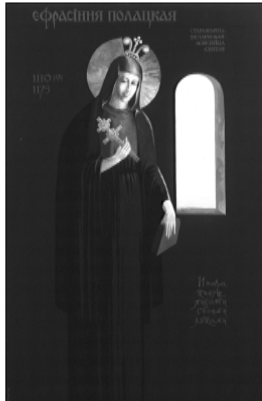
Ул. Васюк Плакат «Ефрасіння Полацкая».

Тамара, жанчына, у нейкім пазасьведомым адчуваньні прасторы і часу, заглябляецца ў гісторыю, быццам сама сябе суцяшае: жылі людзі тысячы гадоў да нас і жыць будуць праз тысячы