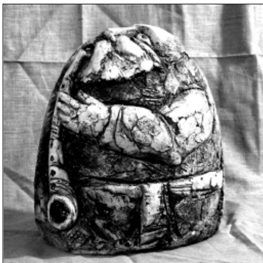
Т. Васюк. Музыка.

У 2002 годзе Валодзя і Тома адзначылі трыццаць гадоў сумеснага жыцця.