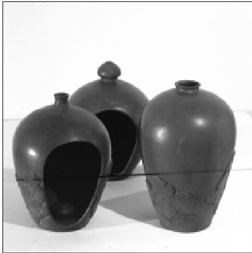
Т. Васюк. Капліцы.

было, каб абодва яны трапілі ў майстэрню да цудоўнага мастака і педагога Дубара, які да самазабыцця любіў пясчотны, мяккі жывапіс Бялінскага-Бядулі. Ён вучыў слухаць сваю зямлю, пісаць не фарбамі – душою. І, пэўна ж, добра ведаючы, ды што там, нават адчуваючы кожнага са сваіх вучняў, менавіта настаўнік аднойчы зірнуў на Тому з Валодзем і сказаў: