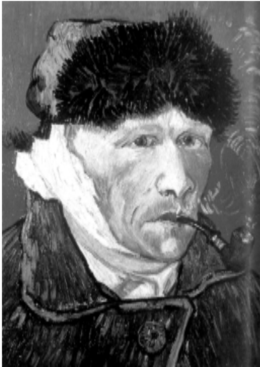
В.Ван Гог. Аўтанартрэт.