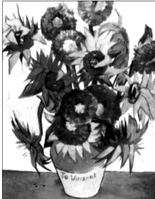
М. Нацэўскі. Сланечнікі.

сексалаг, партнёркі. Затое псіхааналітык-фрэйдзіст мог бы доўга разважаць пра сублімацыю сексуальнай энергіі ў творчую.