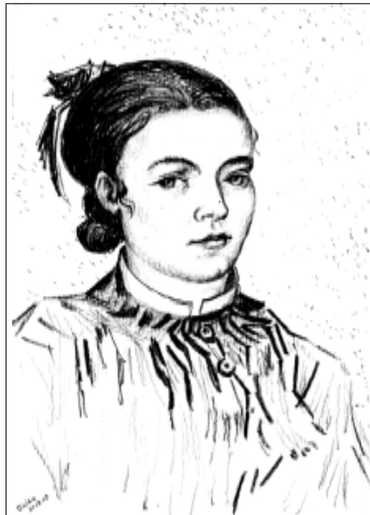
В.Ван Гог. La Mousmi .