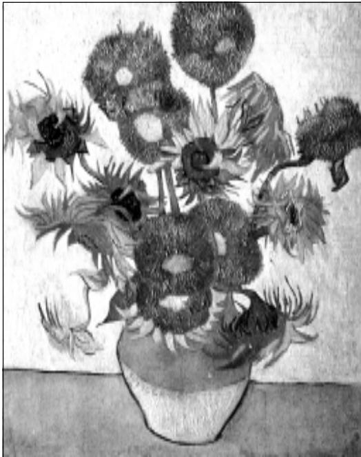
В. Ван Гог. Сланечнікі.