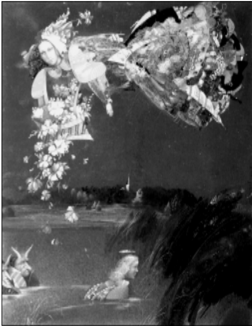
«Загнаны анёл», алей.