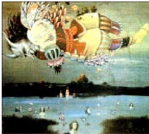
«Злаічасны вечар», алей, (1994).

карціну. Сто пяцьдзесят рублёў — гэта і па тым часе быў ня кошт для сапраўднага твора. Але паколькі працуючы ў часопісе “Мастацтва” добра ведала мастакоў, і пейзаж Уладзіміра Тоўсьціка заўважыла яшчэ на выставе, дзе дамовілася, кошт мне, вядома ж, занізілі. Гэта была шчаслівая пара, калі за тое, што напішаш і надрукуеш, плацілі някепскія ганарары. І я, можа першы і адзін раз у жыцьці, мела магчымасьць купіць карціну.