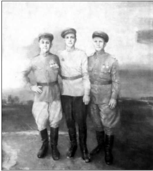
«Вярнуліся», алей, (1985).