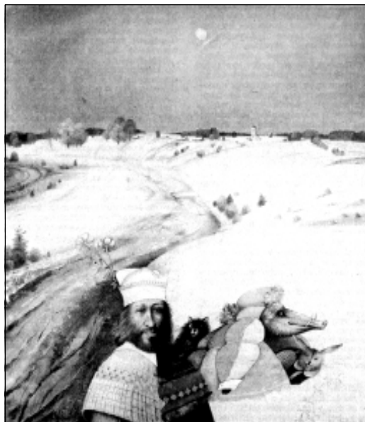
«Дарога дамоў», алей, (1996).