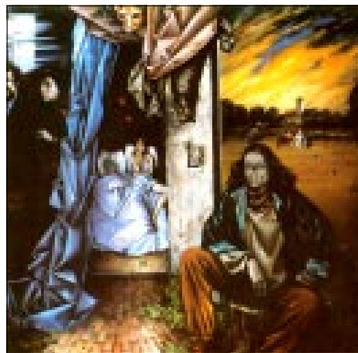
«Хроніка аднаго вечару», алей, (1989).