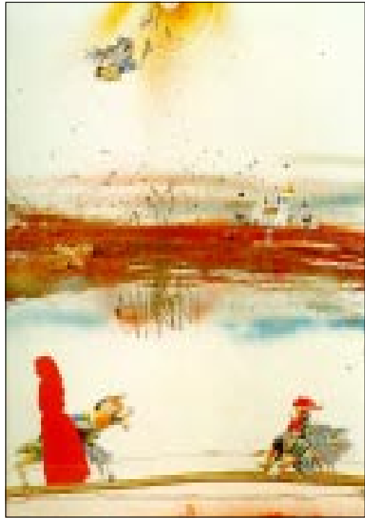
«Казачны калейдаскоп», алей, (1985).