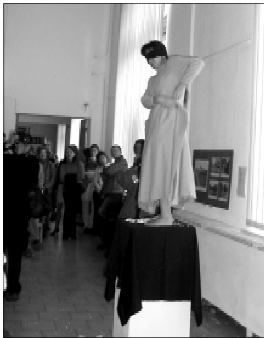
Перформанс Сакіко Ямаокі.

валяў перформансаў больш чым у 30 краінах, запісаньнямі і фотаздымкамі некаторых са 160 перформансаў можна было азнаёміцца на невяліччай экспазіцыі, дэманстраваў свае глыбокія пачуцьці да паўднёвага суседа Канады – ЗША. Для жыхара Квебеку глабалізацыя – праблема істотная ён лічыць, што “Канада” гэта штучнае утварэньне, амерыканцы – усе, хто спажывае забаўляльную прадукцыю RMF-FM і MTV. Пад гукі нечага дужа падобнага на The Residents актор выканаў рухі рукамі, апранутымі ў каляровыя пальчаткі, у кожнай руцэ па каляровай пластыкавай рыдлёвачцы, пазначыў чатыры вуглы залы каляровай клейкай стужкай, за кожную “мяжу” паставіў па шклянцы з мінеральнай вадой, намалюваў на твары губной памадай тоўстыя прагняны губы і лёг на падлозе, сімвалізуючы смагу; падняўся, кідаў тэнісны мячык у шклянкі, калі ўдалося патрапіць, заслужыў апладысменты публікі. Песьня “God is American – Nein! Der Gott ist deutch!” служыла сваеасаблівым ключом да звышзадачы аўтара: штучнасьць, цацачнасьць і адначасова агрэсіўная татальнасьць сучаснай масавай культуры імпе-