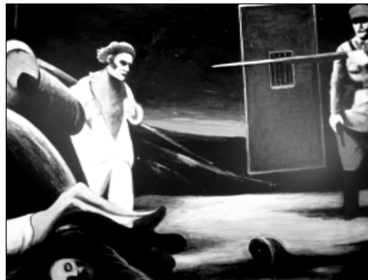
«Курапаты. За што?».

ноўскім. Памятаю, як ён прыйшоў неяк да мяне пасля ўроку, які прысьвяціў паўстанню Каліноўскага, – увесь маркотны і змардаваны. Атрымаў ад