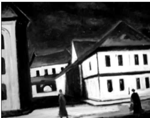
«Менск XIX-га стагоддзя».

Добра сябравалі са славытым краязнаўцам Генадзем Каха-