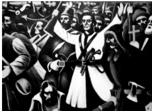
«Мой Кастусь Каліноўскі».

К. І.: На пачатку я збіраўся займацца толькі тэматычнымі творамі. Першыя мае працы былі звязаныя з жыццём заходнебеларускай вёскі. Так, дыпломная работа была прысьвечаная канфлікту паміж сялянамі і панамі, хаця асаблівай канфліктнасці не было. Прынамсі, не параўнальна, як пры бальшавіцкім рэжыме. Называлася “Паўстаньне нарачанскіх рыбакоў”. Яно, па сутнасці, не было паўстаннем, гэта была проста забастоўка, але