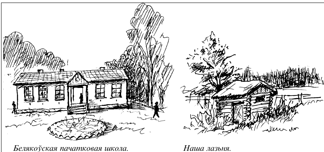
Белякоўская пачатковая школа.