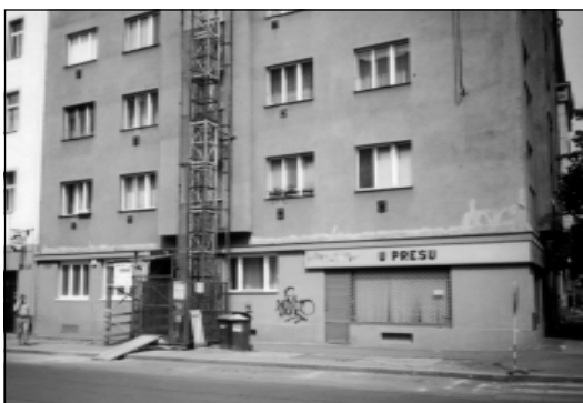
Кран-пад’ёмнік перад домам на вуліцы У Вршавіцкего Надражы, дзе жыў Васіль Быкаў. Вакно быкаўскай кватэры на першым паверсе справа ад крана.

У тых красавіцкія дні шмат гаварылі і пісалі пра забойства ў Расеі дэпутата Думы