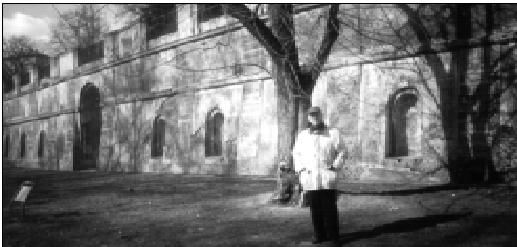
Васіль Быкаў у Гаўлічкавых садах.

Быкаў любіў чырвонае віно, умеў і любіў выпіць, шановаў добрае застолье і