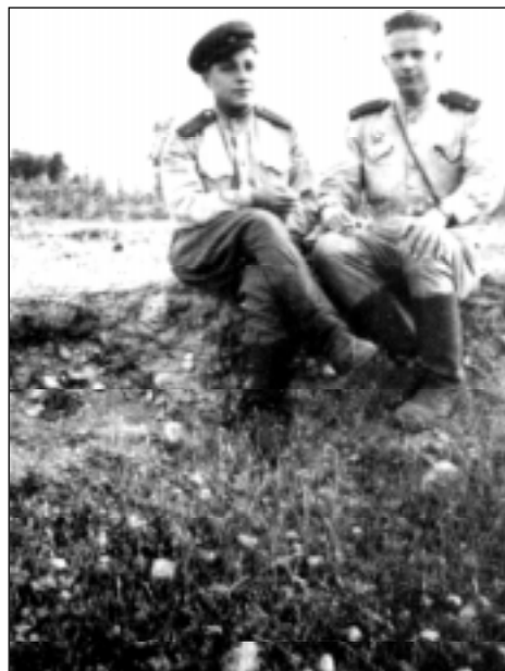
Франтавыя здымкі Васіля Быкава.