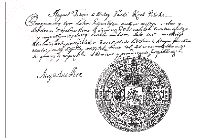
Пячатка і подпіс вялікага князя і караля Аўгуста III

Скінуўшы Людовіка XVI, французскія рэвалюцыянеры-рэспубліканцы папрасілі ў царыцы партрэт — на знак яе спачування вальтэр’янскім ідэям. «Самая аристократическая из