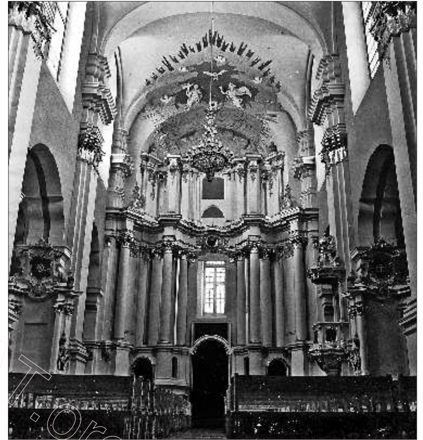
Сучасны інтэр'ер Сафіі Полацкай

Нішу адчынілі ў прысутнасці святароў, мясцовых краязнаўцаў, гарадскога галавы і паліцмаистра. У драўлянай, абабітай брунатным аксамітам труне са срэбным пазументам ляжаў чалавек у мітрапаліцкім уборы. На грудзях у яго быў срэбны з пазалотаю крыж з гнёздамі пад рэліквіі, на правай руцэ — залаты пярсцёнак з сердалікавым каменем. Выразаны на ім герб дакладна паўтараў герб з пячаткі «стаўленай граматы» 1747 года, што пачыналася словамі: «Флориан Гребницкий, Божию и Святого Апостольского Римского Благодатию, Архиепископ Полоцкий, епископ Витебский, Мстиславский, Оршанский и Могилевский, Трону Папесскаго Ассыстент», а канчалася