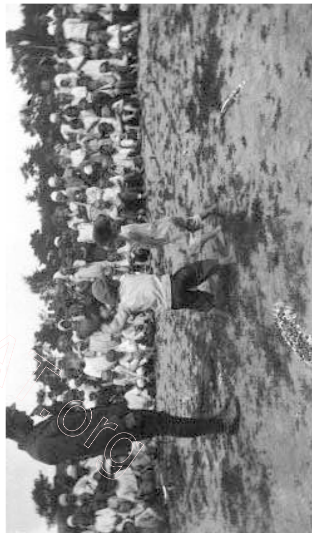
Уцекачы накормлены, надвор'е добрае, амэрыканцы прывезьлі баксэрскія пальчаткі – матч на прыз АРА пачаўся