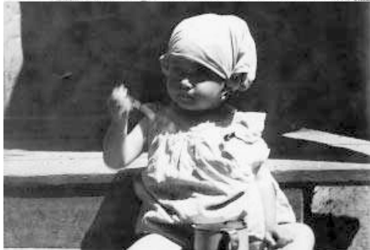
Ремонт паровозов и вагонов. На Минском узелке Эап. ж. д. и по

после для в 5 р. 1 тит ш Для ных с разбит ВУЗ ствани КСМ, ты ос фак, лица, нов Р дватг лица, лом, i устанн нимум Поме В в ды эи ВГУ, ствонн ных с шивай Барьб Для ми на двидлы щатле Прист стают В тн измски 7.629, по 'трн но 7.1