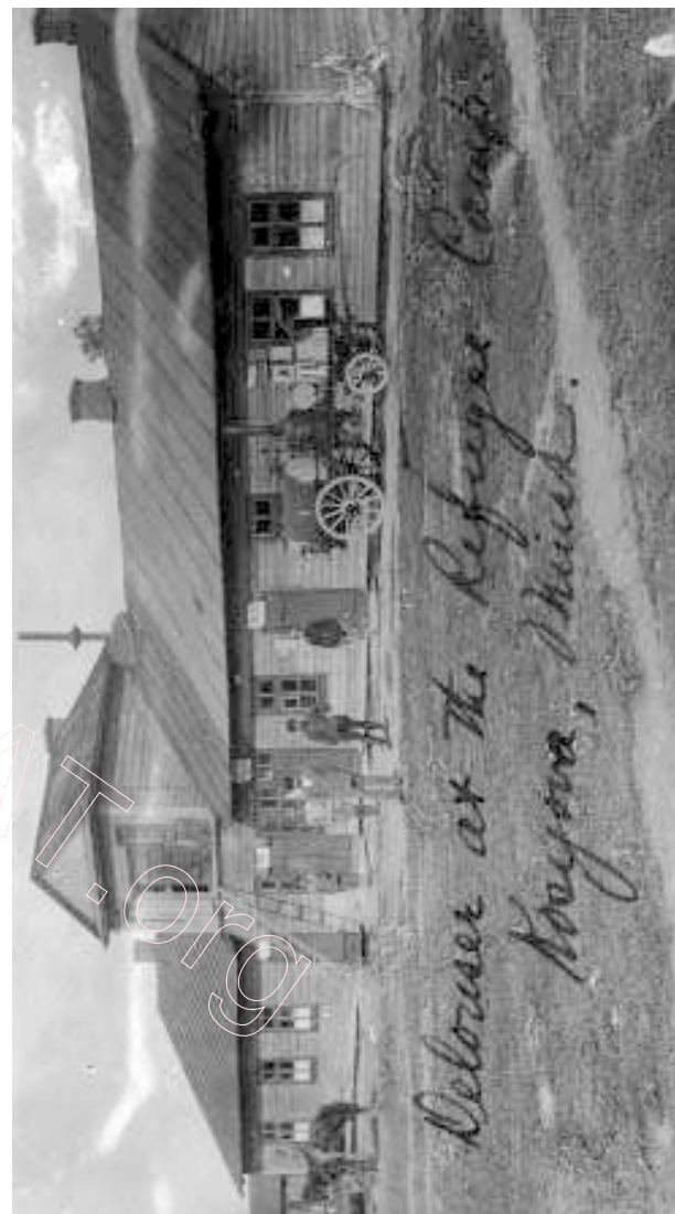
Сьмерць вошам! Перад будынкам – перасоўная вашабойка для абавязковай санітарнай апрацоўкі адзеньня ўцекачоў

Беларускую эвакуацыйную камісію (Белэвак), якая займалася ўцекачамі, узначальваў будучы куратар АРА Мар'ян Стакоўскі. Ад студзеня 1921 па красавік 1922, паводле зьвестак камісіі, празь менскі вакзал прайшлі 251 тысяча 734 уцекачы. Амаль для кожнага трэцяга Менск быў канцавой станцыяй. Далей, да родных вёсак пад Лагойск ці Мар'іну Горку, яны дабіраліся самастойна. Рэшту ўцекачоў трэба было перапраўляць у Негарэлае й далей у