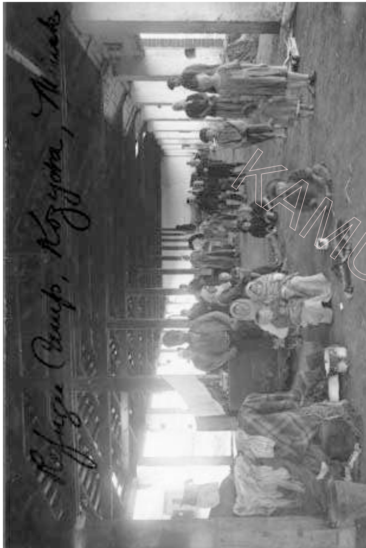
У Козыраве да фатаграфавання стаяцца сур'ёзна і малыя, і старыя

Прайсьці немагчыма. Заля чаканьня, калідоры, кожны сантымэтар густа занятыя людзьмі, якія ляжаць, сядзяць скурчаныя ў самых неверагодных позах. Калі прыглядзецца, дык відаць, што сьмярдзючыя лахманы кішаць вошамі. Хворыя на тыфус курчацца й трасуцца ў ліхаманцы разам зь дзецьмі. Немаўляты страцілі галасы й болей ня могуць плакаць... Жанчына спрабуе супакоіць малое дзіця, якое плача й просіць есьці. Яна люляе яго на руках. Затым раптам б'е. Малое крычыць. Жанчына вар'яецца. У шаленстве, зь перакошаным тварам яна пачынае зьбіваць дзіця. Удары кулаком градам сыплюцца на тварык, на галаву, потым яна кідае дзіця на падлогу й б'е нагой. Вакол у жаху крычаць. Малое падымаюць, лаянка абрынаецца на маці, якая пасля шалёнага выбуху сьціхла й абсалютна не зважае навокал. Вочы расплюшчаныя, але нічога ня бачаць.