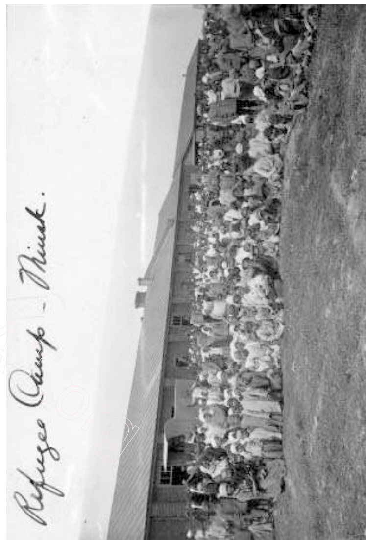
Козырава, лягер уцекачоў ад голаду: самае страшнае пакуль засталася ззаду

29 Паводле афіцыйнай расейскай статыстыкі, усяго было дэпартавана 3 300 000 чалавек, зь іх 800 000 палякаў, 200 000 габрэяў, астатнія 2 300 000 складалі беларусы і ўкраінцы. Паводле БелЭН, беларускіх ўцекачоў было больш за 2 292 000.