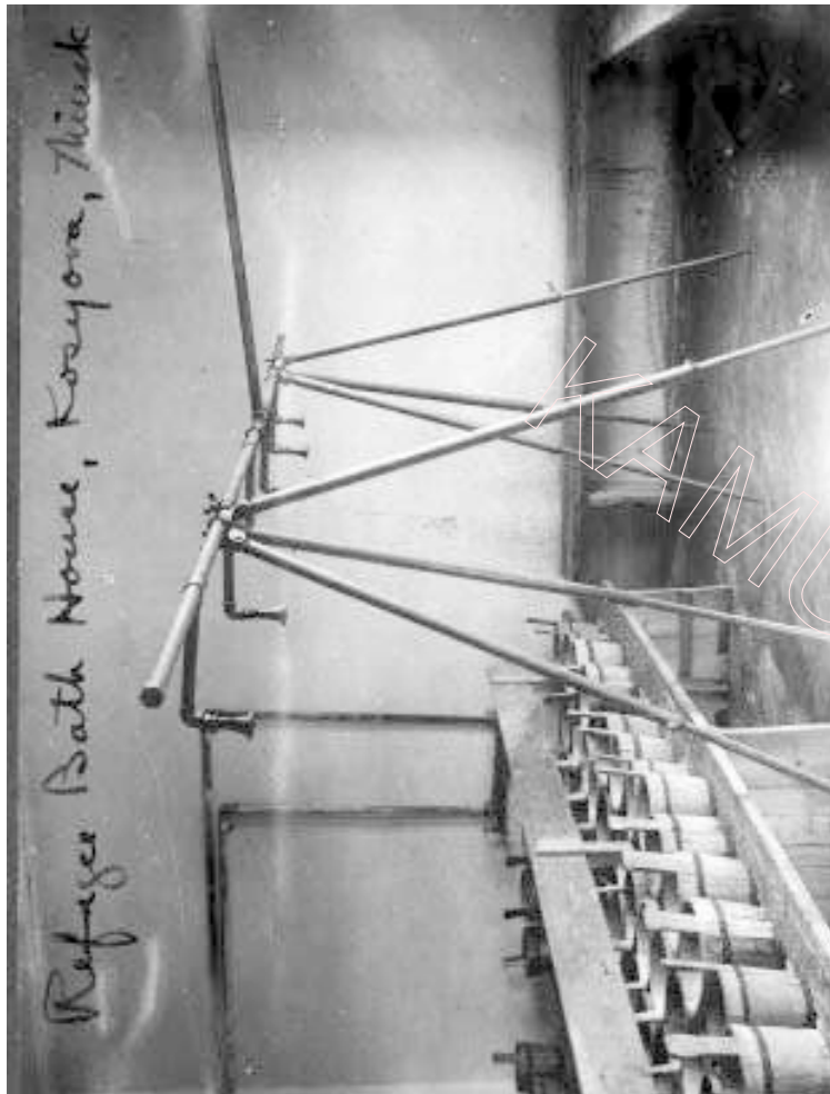
Усіх уцекачоў перад адпраўкай у спальны барак накіроўвалі ў лазню — гэта была першая магчымасць памыцца цалкам пасля некалькіх месяцаў дарогі

духіліць эпідэміі, на польскім баку пасажыраў з таварных вагонаў накіроўвалі ў канцэнтрацыйныя лягеры, дзе яны праходзілі карантын 30 . Пасля санацыі ўцекачы адпраўляліся ў свае родныя куты, ня ведаючы, што іх там чакае, але цвёрда ўпэўненыя, што горш, чым на чужыне, ужо ня будзе.