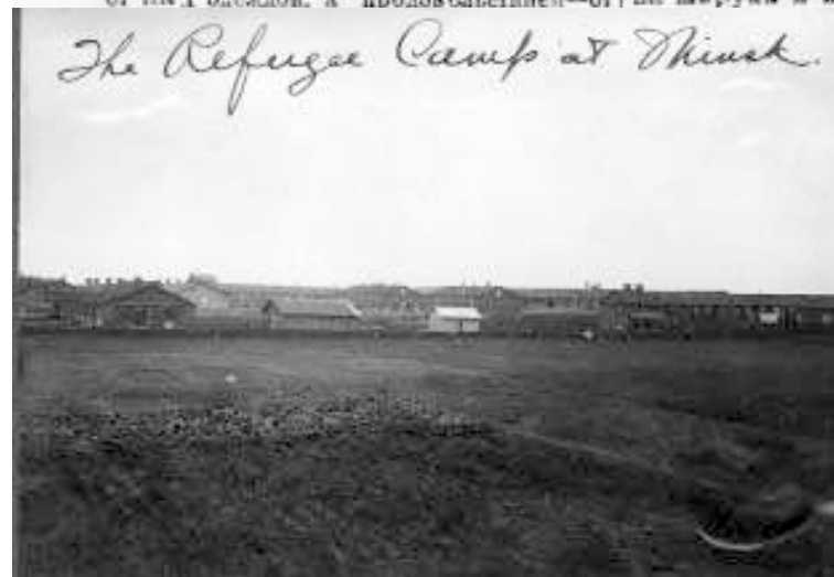
The Refugee Camp at Minsk.

вешали жетоны работы в белых че- двиках.