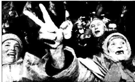
Майдан Незалежности. Чем мы хуже? Надо искать свой путь!