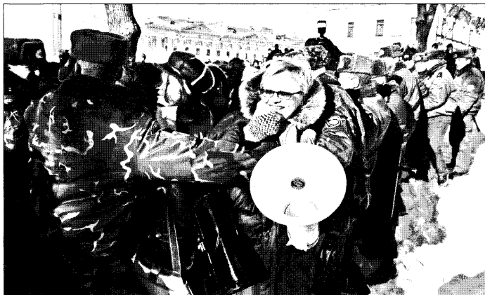
Предпринимателей не пускают к Лукашенко в администрации, куда они хотели передать свои требования