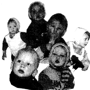
Часть 2. Малолетки.

Ещё в прошлом году у них была школа, а все они жили в двухэтажном корпусе. Сейчас в школе проживают женщины-заключённые, а подростки занимаются в трёх грошечных комнатках, находящихся на первом этаже их корпуса, которые и называются «Школа».