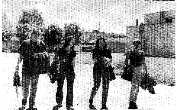
После первого посещения