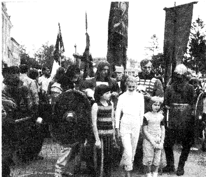
Рыцарский клуб «РАДАГОСТ». г. Пинск

Новогрудок. Маленький, скромный, уютный городок с огромной, могучей историей. В 13 веке он был первой столицей старинного белорусского государства Великого Княжества Литовского. Город, который на протяжении веков выдерживал несчетное количество осад различных завоевателей, неоднократно, практически полностью, разрушаемый, теряя с каждым разом свое непревзойденное величие, тем не менее, стал гордостью, символом независимости, непреклонности для многих поколений белорусов.